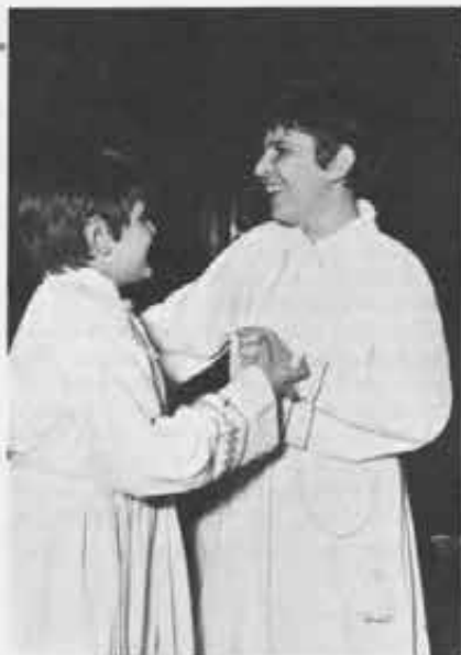
Il momento comunitario della crescita nella fede: i ragazzi lo vivono con gli altri, nella parrocchia, nella scuola, nel gruppo.

Ambedue i termini derivano da una parola greca che significa «far risuonare all'orecchio». Far risuonare che cosa? Per i primi cristiani era — e rimane anche per noi — l'annuncio del Vangelo, cioè la «notizia» che Cristo ci ha portato la salvezza, che ci raccoglie in assemblea (Chiesa, popolo di Dio), che ci conduce al Padre. L'incarnazione di Cristo nella nostra sto-