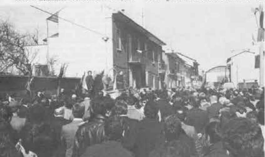
I suoi amici non potevano mancare nel giorno di dedizione della «Via Don Ponzetto»; c'erano gli anziani che l'hanno conosciuto da vivo, e i ragazzi delle scuole che imparano a conoscerlo ora.

Un giorno il direttore dell'oratorio conduce in classe il Vescovo di Novara, in visita inattesa. I ragazzi scattano