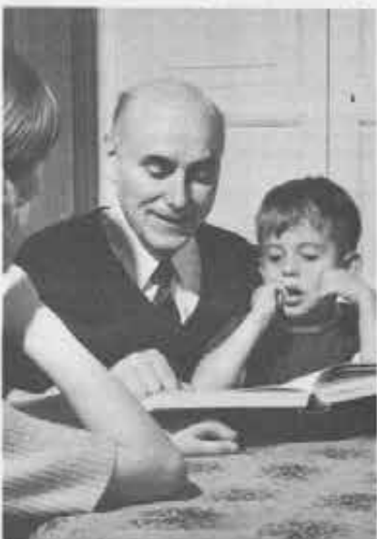
Il momento conoscitivo dei contenuti della fede è necessario, come è necessaria la tanto biasimata memorizzazione. E oggi le parrocchie si orientano per la catechesi familiare, svolta attorno al tavolo di cucina.

E' tipico questo approccio con le verità divine, e l'aveva già notato Pascal. «Le cose umane — ha lasciato scritto in un «pensiero» — bisogna capirle per amarle. Le cose divine invece bisogna amarle per capirle». La storia è piena di cristiani, magari santi con l'aureola, che ignari di teologia