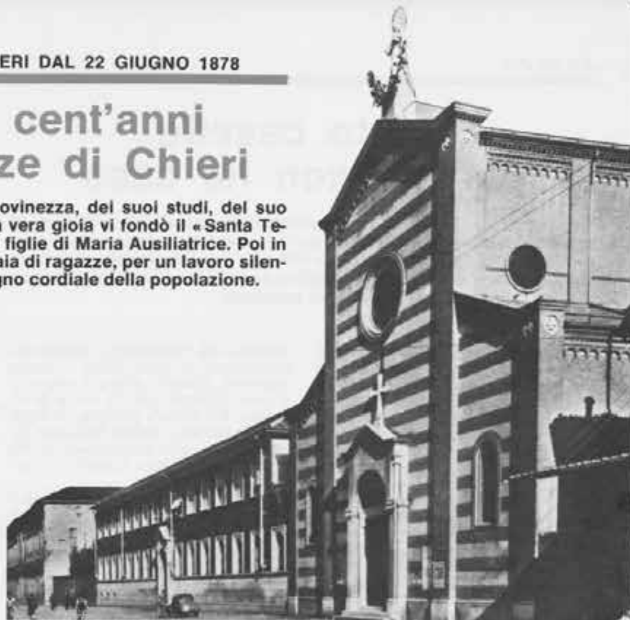
Chieri: la chiesa e l'Istituto Santa Teresa come si presentano oggi.

Un palazzo per la gioventù. I dieci anni trascorsi da Don Bosco a Chieri furono memorabili nella sua vita: «tempo forte» di maturazione verso il sacerdozio, «tempo sereno» di programmazione spirituale e apostolica. Perciò fu grande la sua gioia quando i coniugi Ottavia e Carlo Bertinetti, che non avevano figli, nel 1858 decisero di lasciargli in eredità il loro palazzo perché se ne servisse a vantaggio della gioventù. Don Bosco ricordava con piacere che proprio in quella casa, compiuti gli «studi di latinità» al col-