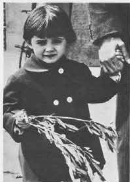
Il momento esperienziale: i bambini vengono condotti per mano dai genitori a crescere nella fede che hanno ricevuto nel battesimo.

volge riguardo ai figli già solo per aver ricevuto il battesimo. Il sacramento del matrimonio santifica poi l'amore dei coniugi e li rende strumenti in modo speciale di grazia per i figli. I genitori diventano di fatto per loro la prima voce della Chiesa, i primi evangelizzatori e catechisti. Altre persone — sacerdoti, catechisti, educatori — potranno in seguito aggiungersi al fianco dei genitori, potranno