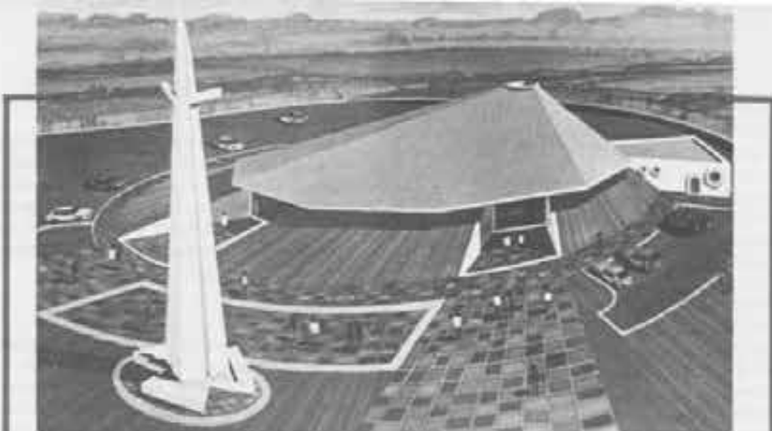
Il Centro Giovanile Don Bosco di Managua. Realizzato all'epoca del terremoto, ha preparato centinaia di giovani addestrati in corsi accelerati per i mestieri più urgenti e necessari alla ricostruzione della città.

«Io sono contro nessuno». Mons. Obando ha idee che evidentemente non piacciono a tutti. Lo definiscono medellinista , da Medellín, la città colombiana dove i vescovi latino-americani nel 1968 si riunirono per applicare le conclusioni del Concilio alle situazioni dei loro paesi: «Un