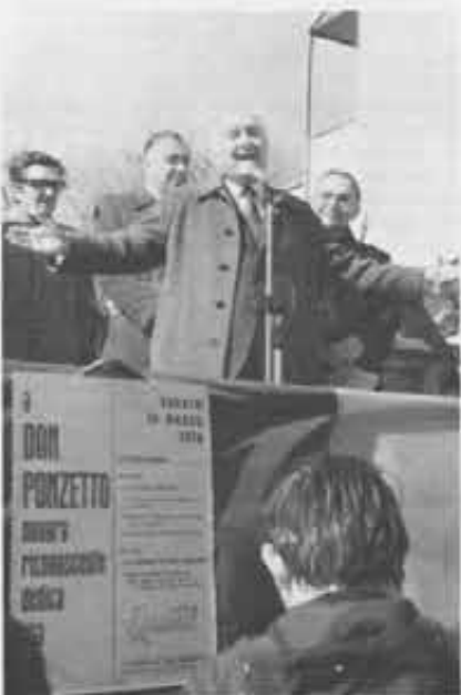
Un altro exallievo, l'on. Oscar Luigi Scalfaro, nel discorso ufficiale non nasconde la gioia per vedere riconosciuto il suo antico maestro.

I cinque giovanotti veneti, causa involontaria del disastro, per più giorni si prodigano nei lavori, e la nuova baracca è più bella di prima. E' impenetrabile al vento e alla pioggia, e soprattutto è a prova di incendio.