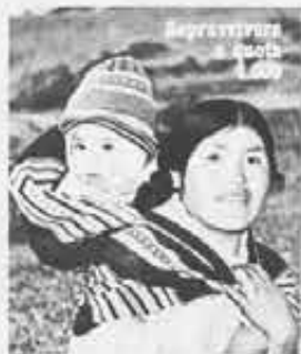
Servizio di copertina, pag. 17