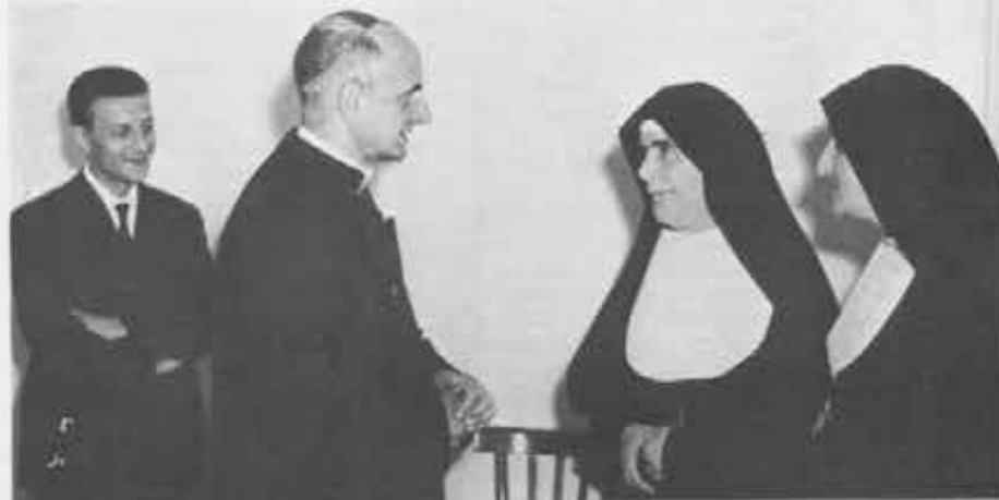
È un giorno del 1962 una visita gradita: l'arcivescovo di Milano mons. Montini, oggi Papa. Il centenario del «Santa Teresa è stato festeggiato nel maggio scorso con una fitta rete di iniziative: una «settimana della gioventù», la commemorazione civile, quella religiosa onorata dall'arcivescovo di Torino, e incontri con tutti i rami della Famiglia salesiana.

Quando giunse a Chieri don Branda, costruttore nato, notò con pena l'incapacità della cappella di fronte alle centinaia e centinaia di oratoriane e alunne. Don Francesca, venuto a conoscenza dell'inconveniente, suggerì di scrivere una «lettera a Don