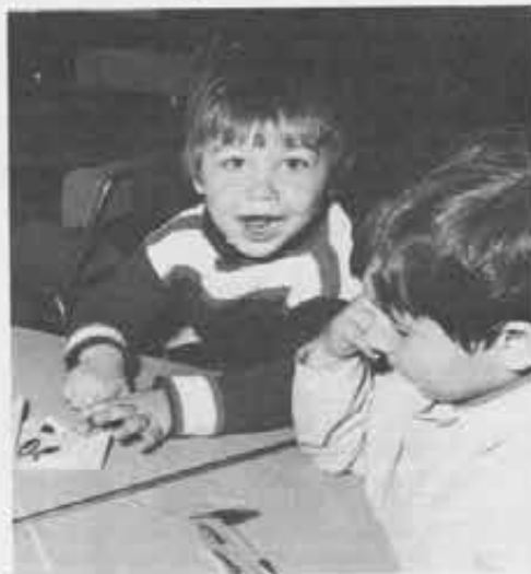
A sinistra: quell'uomo estroverso, cordiale, tempestoso e indimenticabile che fu don Antonio Cavoli, fondatore delle Suore della Carità. Sopra: due minuscoli allievi della scuola materna che le Suore hanno aperto a Roma.

Non basta, si mette su una piccola industria di oggetti di bambù. Non