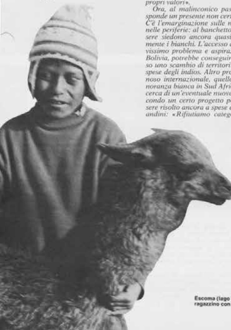
Escoma (lago Titicaca): ragazzino con l'amico llama.

Ogni accadimento è sacro. Esteriormente la gente andina ha una sa-