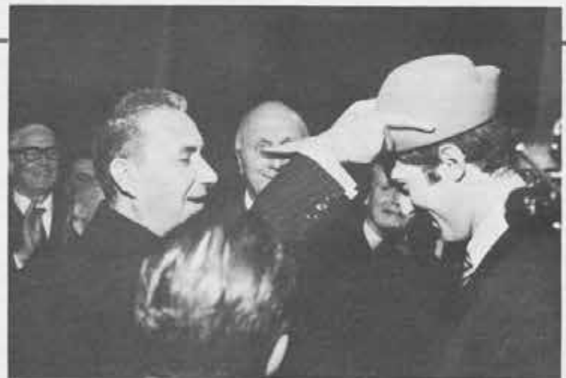
ALDO MORO nel 1968, in visita alla casa salesiana di Pordenone: era amico dei giovani studenti, e essi gli volevano bene.

Il libro vuol anche essere un avvertimento per quanti tra i giovani sognano con troppa leggerezza di avventurarsi in soccorso del terzo mondo, perché racconta «le ripetute umiliazioni che la selva riserva» ai cosiddetti civilizzati che la sfidano, e dice l'ammirazione, di due che hanno visto di persona, per «l'intelligenza shuar nello sfruttare le possibilità offerte dalla natura».