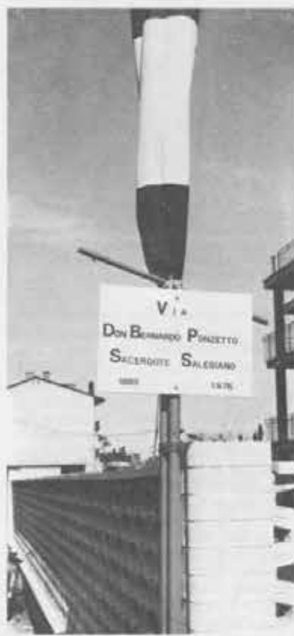
Una via di Novara dal 16 marzo scorso porta il nome di don Ponzetto. Una comune via di quartiere operaio, in parte ancora dissestata e senza marciapiedi, e perciò... perfettamente adatta a chi ora ne porta il nome.

re abbondano, mentre in giro la gente è priva di tutto. Don Ponzetto si mette alla stanga di un carretto, e va a bussare alla caserma. Ne esce col carretto carico di indumenti e scarpe. Stipa tutto in camera sua, poi torna a fare altri carichi, mentre i militari tollerano con indulgenza. La sua camera è ormai piena; per fare più spazio don Ponzetto smonta il letto, e... non ha più dove dormire. A sera si porta sulla giostra nel cortile dell'oratorio; si stende sull'asse sottile e dorme sotto le stelle. Un mattino lo trovano col volto tumefatto: nel sonno era caduto, e aveva sbattuto malamente la faccia a terra.