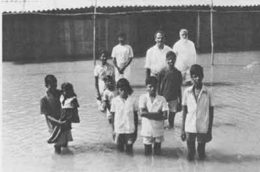
E quando arriva l'inondazione che si fa? Si aspetta che passi...