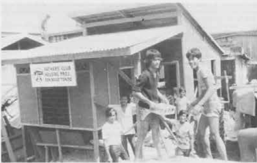
Giovani del Centro giovanile salesiano di Tondo costruiscono una casetta.