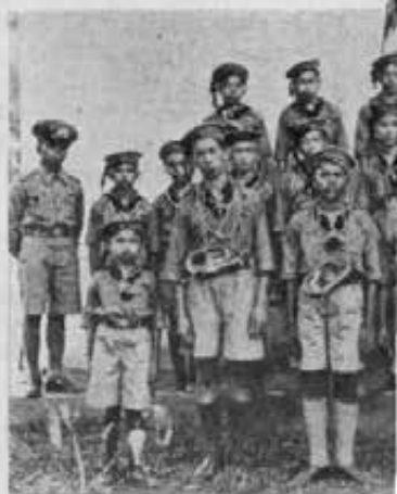
Siam. - Gioventù Thai nella d