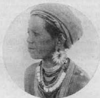
Assam. - Aspetto ed ornamenti di una donna Garo.