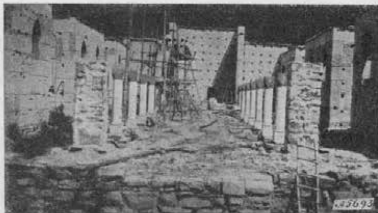
El Guacamayo. - La chiesa in costruzione.

modo e godono quando mi vedono passare. Il campo di lavoro è assai vasto e, se si vuole, un po' difficile per l'indole dei ragazzi e per la complicazione che presenta una Casa sui generis come questa.