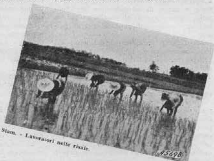
Siam. - Lavoratori nelle risaie.