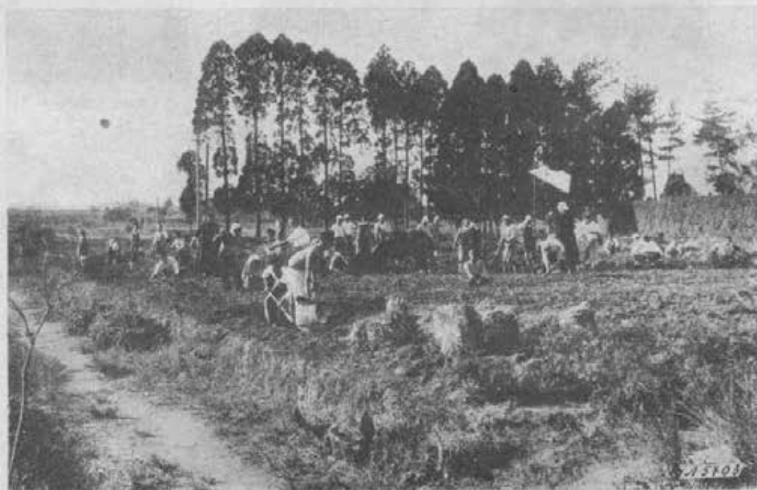
Miyazaki (Giappone). - I nostri seminaristi al lavoro in aiuto alle famiglie dei soldati.

Uno spettacolo nuovo e singolare che s'impose alla gente del luogo e parve un simbolo e una promessa della materna protezione dell'Ausiliatrice sulle povere indie del Chaco, vicine a Lei in quelle primizie di vita cristiana.