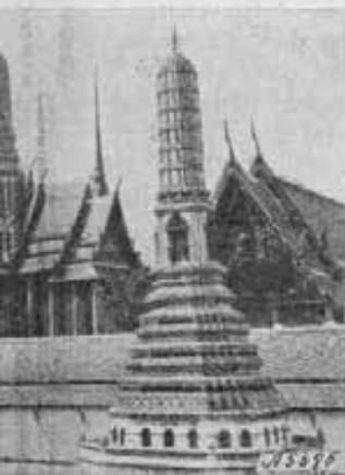
Città delle pagode

Questo suo desiderio è ormai realtà. Riservo ad una prossima relazione le notizie del lavoro che compiamo nel nuovo campo; per ora mi limito a qualche cenno dell'ambiente che in questi giorni è sotto l'influsso quasi d'un senso di rinnovamento per la recente disposizione che ha mutato il nome del Paese da Siam in Thai .