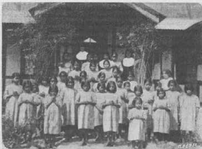
Jowai. - Orfanotrofio Beata Maddalena.

Dopo il ritorno dallo sperduto paesello di Pak-Heong, dove per interessamento di S. E. Rev.ma Mons. Vicario Apostolico cercarono scampo per alcuni mesi, non poterono godere a lungo della relativa tranquillità che speravano.