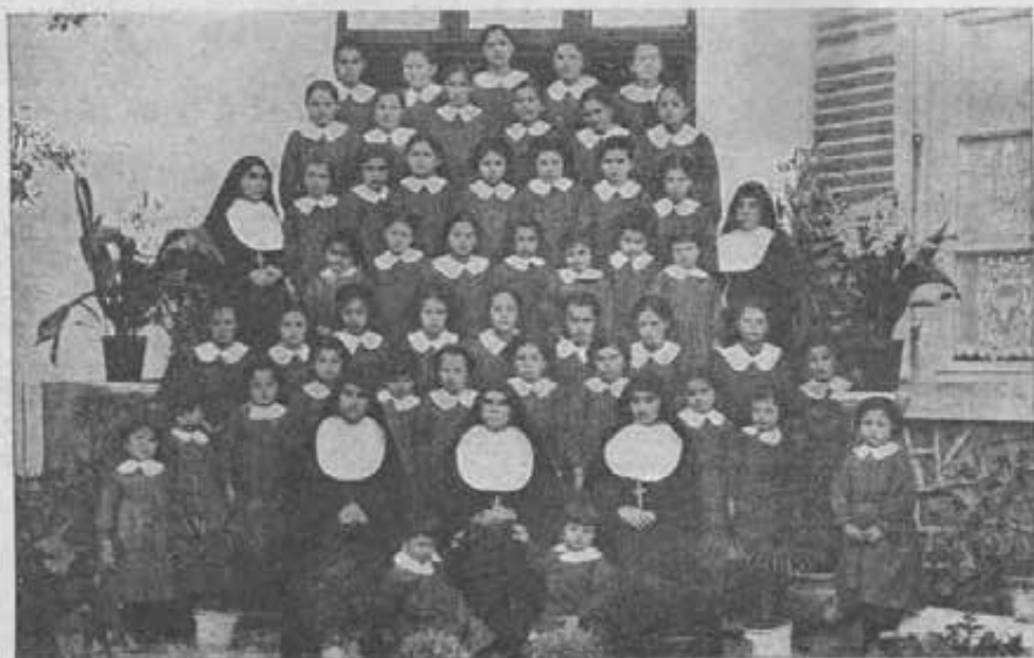
Scutari (Albania). - Gruppo di orfanelle.

L'Ospedale «Principessa Jolanda», tanto ben visto dalla popolazione, è sempre più fre-