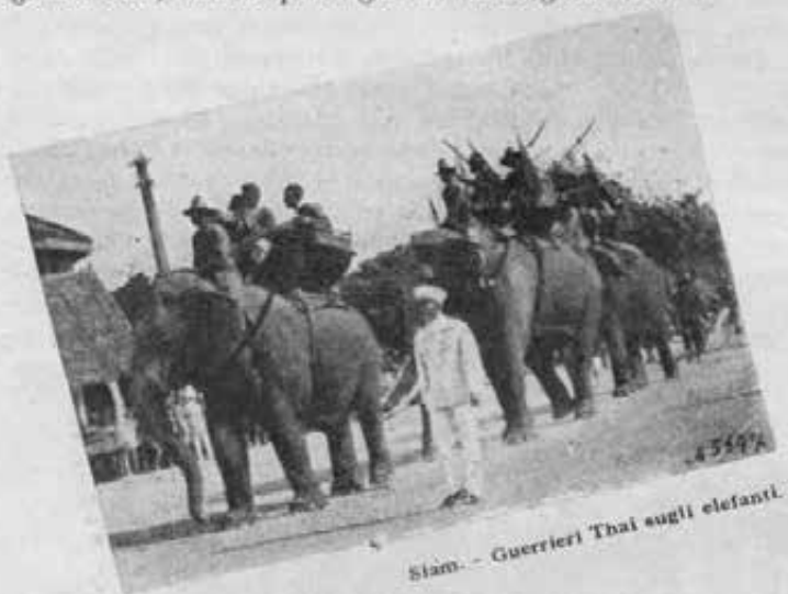
Siam. - Guerrieri Thai sugli elefanti.