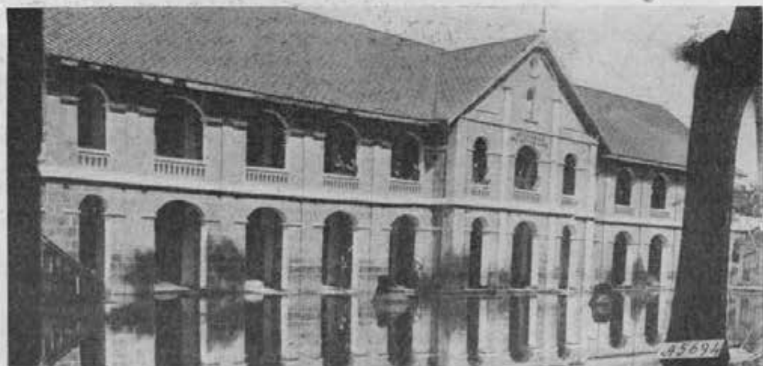
Bang-Nok-Khuck (Siam). - Lo studentato salesiano durante la stagione delle inondazioni.