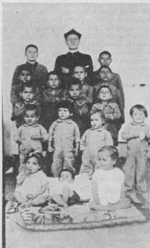
El Guacamayo. - Rappresentanti delle generazioni dell'asilo per figli di lebbrosi: da 4 mesi a 16 anni.

modo e godono quando mi vedono passare. Il campo di lavoro è assai vasto e, se si vuole, un po' difficile per l'indole dei ragazzi e per la complicazione che presenta una Casa sui generis come questa.