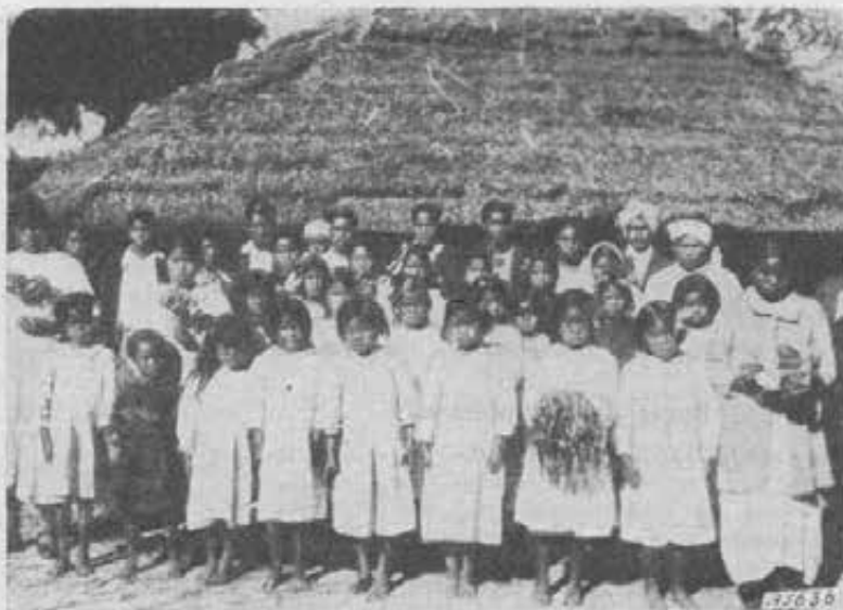
Assam. - Una nuova comunità cristiana

E questo fu un premio anche per le Missionarie; giacchè videro come la giovane vincitrice della gara non possedesse il catechismo solo nella mente, ma soprattutto lo portasse nel cuore!