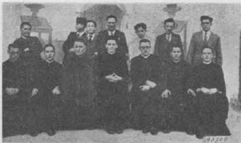
El Guacamayo. - Il personale salesiano.

Gradisca, amatissimo Padre, i filiali saluti di tutti i Salesiani e bambini di questo asilo, che per lei elevano preghiere al Signore e implorano una sua benedizione speciale.