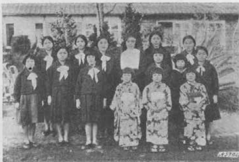
Miyazaki (Giappone). - Aspiranti all'Istituto delle Suore giapponesi della Carità.

Se sarà nei disegni della Divina Provvidenza che le due suore della Carità giapponesi un bel giorno siano 20.000 e l'unica Casa che è a Miyazaki ne vegga sorgere altre 20.000, si può sperare che la stessa Divina Provvidenza muova queste rondinelle a spiccare il volo verso lidi anche lontani, e le infiammi di zelo santo, operoso, in guisa che il loro resoconto annuale, mentre somiglierà al canto che gli uccelletti si mandano di fronda in fronda, sarà sopra tutto un inno a quel Cuore che ha tanto amato gli uomini. Ci aiuti lei, amatissimo Padre, colla sua benedizione.