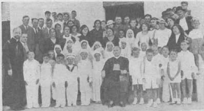
Vaiguras. - Piccoli comunicandi.