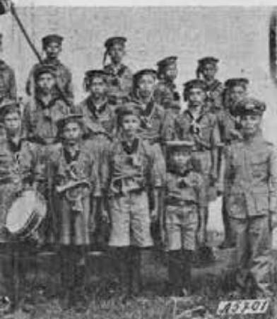
visita delle organizzazioni nazionali.

Cambiare nome è un po' nella tradizione del popolo. Quante volte, ai bambini si appiccica un nome che ricorda una circostanza della nascita (per esempio: «quando pioveva»), oppure una qualità fisica (come «macchia sulla fronte») ecc. Tutti i bambini poi, nel linguaggio familiare sono chiamati col vezzeggiativo comune di «topolino».