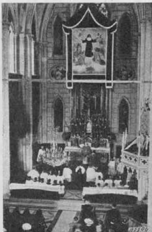
Gerusalemme. - Nella concattedrale per le feste ad onore della Beata Mazzarello.