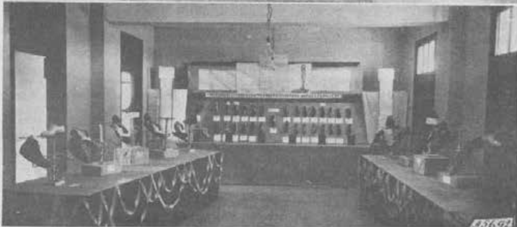
CIUDAD DE TRUJILLO (Santo Domingo). - Due sa'e della mostra delle nostre Scuole Professionali con gli alunni interni dopo la premiazione presieduta dallo stesso Ministro della Educazione Nazionale.