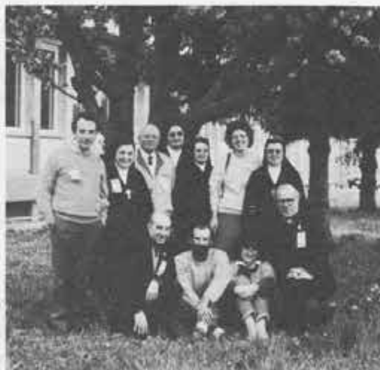
Lombardia - Emilia: Le radici di... un albero in fiore. Sempre in gambal!