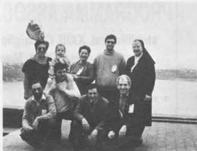
Sicilia: ...beddal Presente e... futuro.