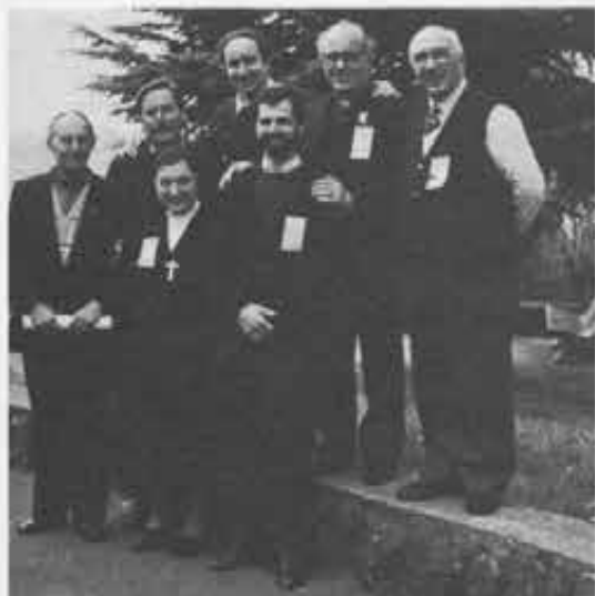
Abruzzo - Marche - Romagna: Speranza e... sorriso.