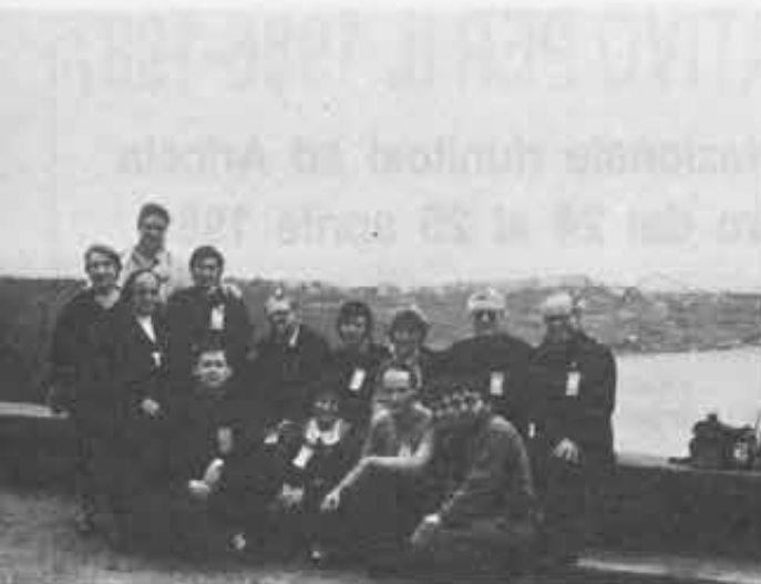
Liguria - Toscana: In tanti per un futuro meraviglioso.