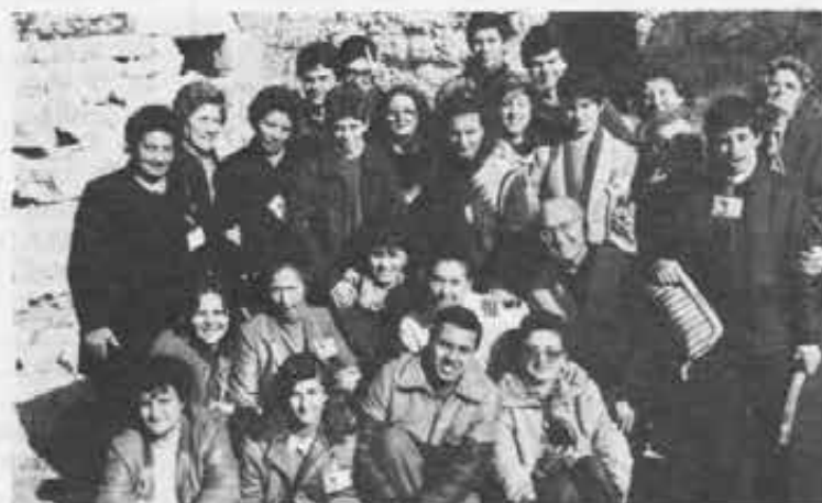
Palermo (Sampolo) - Cooperatori in festa: ricordano la fondazione del proprio Centro. Complimenti e auguri per il vostro intenso lavoro.