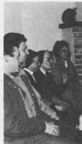
Nizza Monferrato: Attorno a lui calore e forza spirituale.