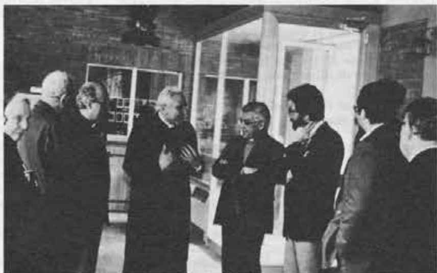
Ariccia: L'accoglienza al Card. Edoardo Pironio.

di Maria Ausiliatrice affinché studino anche loro delle strategie comuni per diffondere il Regolamento di vita apostolica capillarmente tra i rispettivi religiosi e religiose.