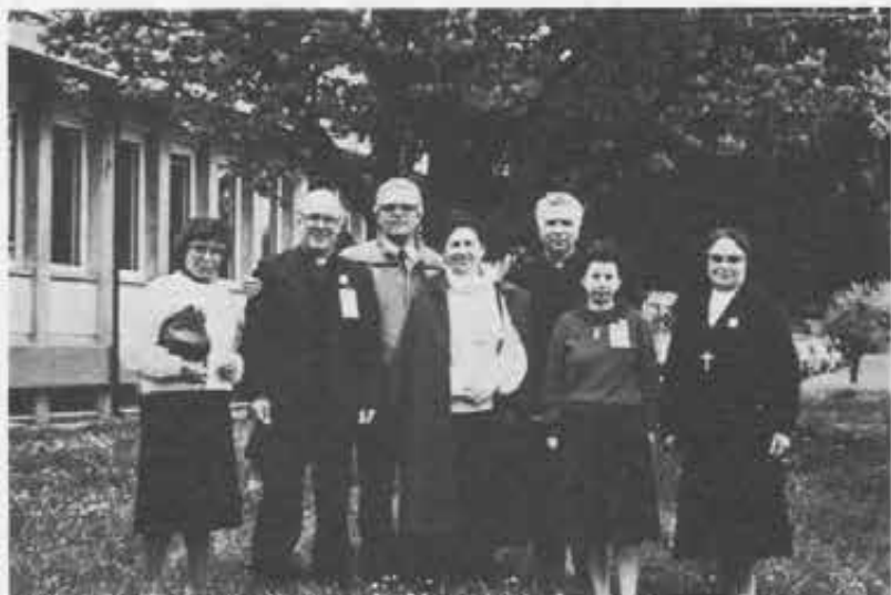
Puglia: ...un «pezzo forte» della Meridionale.