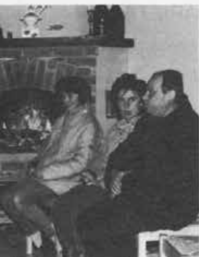
...terminano il gruppo «Proposta» attinge...