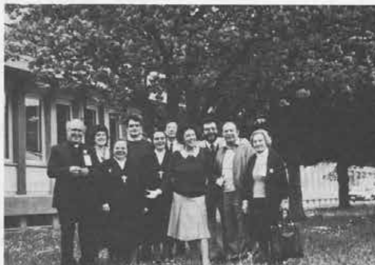
Lazio: ...fatece largo che...! Con le braccia aperte sempre all'accoglienza.