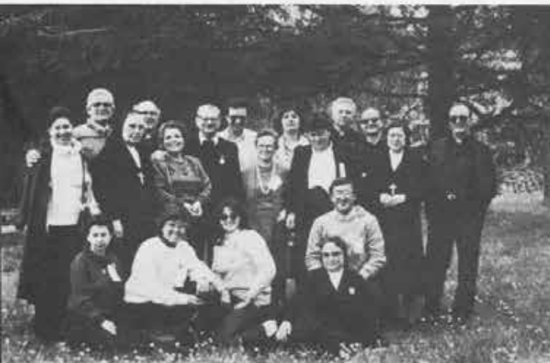
Calabria - Campania - Lucania - Puglia: Tra la gioventù del Sud con «cuore oratoriano».

IMPEGNATE E COMPATTE LE VARIE DELEGAZIONI SONO STATE IL SEGNO DI UNA VITALITÀ NUOVA NELLA VITA DELL'ASSOCIAZIONE. AI PARTECIPANTI... ORA IL COMPITO DI FARSI SEME DI CRESCITA NEI VARI CENTRI.