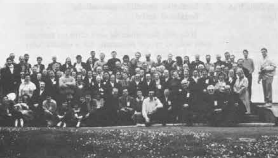
«Avanti, insieme!... verso una nuova primavera di Vocazioni!»