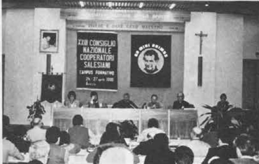
Ariccia: Apertura Campo formativo.

Nei lavori del XXIII Consiglio Nazionale ha avuto particolare spazio, come era prevedibile, il tema «Don Bosco 88».