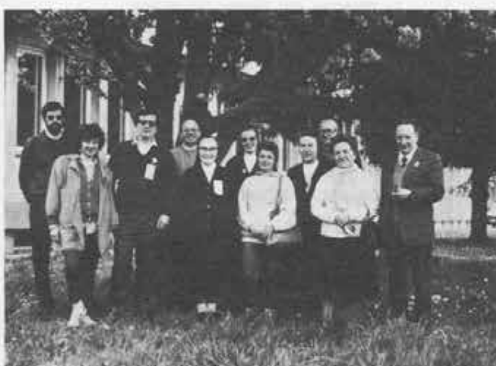
Veneto: Gioia e... simpatia!