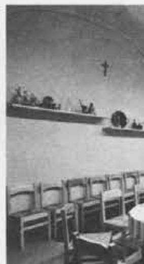
Nizza Monferrato: Congregazione proveranno... Invidia!