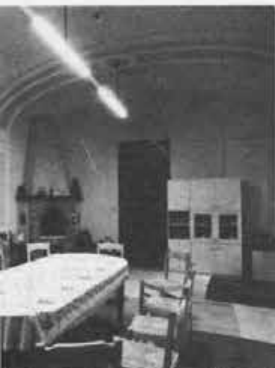
...azioni per la vostra nuova sede! Quanti un esempio da imitare.

La Spezia: Premiazione del concorso «Disegna il tuo Don Bosco» pro- mossa dai Cooperatori del Centro.