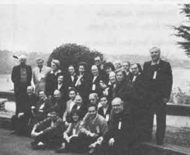
Piemonte: Sorridenti e «forti» con il cuore delle nostre origini.