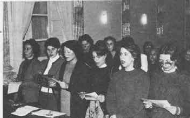
S. Giuseppe lato (Palermo): Un momento di preghiera di Cooperatrici del Centro.

La Spezia: Premiazione del concorso «Disegna il tuo Don Bosco» pro- mossa dai Cooperatori del Centro.