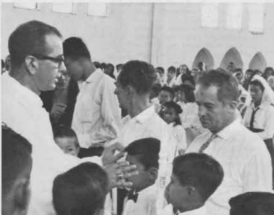
Il Prefetto apostolico mons. Coronado vuol bene ai giovani: per loro costruisce scuole e collegi per preparare i futuri maestri e insegnanti. Qui amministra la Cresima a un gruppo di ragazzi

Caro lei, un conto è il protestantesimo a New York e un conto è il protestantesimo nell'Ariari. Da noi