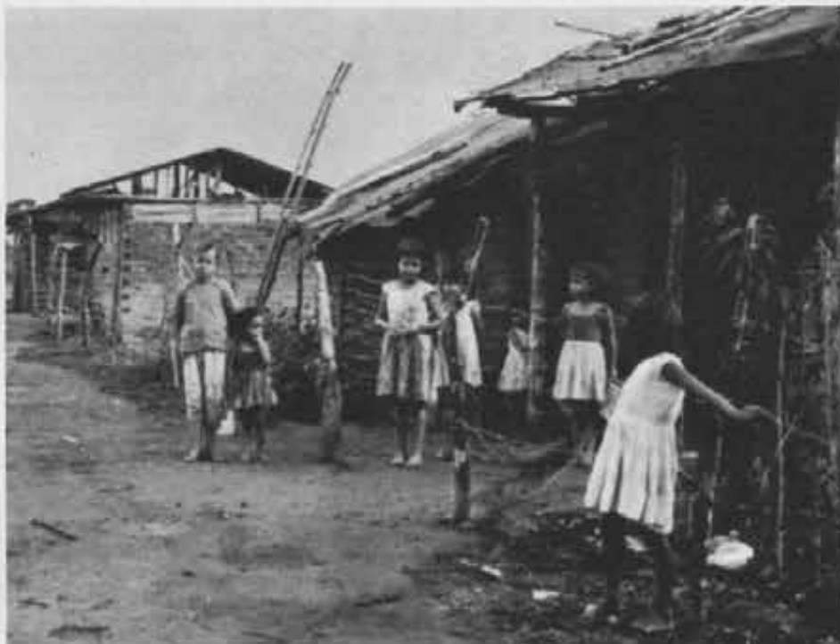
Nella zona dell'Ariari domina la povertà. La maggior parte delle case sono fatte di canne di bambù, di fango e di paglia

« El pueblo es bueno y profundamente religioso por su naturaleza » (il popolo è buono e profondamente religioso quasi d'istinto), disse il Santo Padre Paolo VI in un discorso del 1966, in occasione del decennio