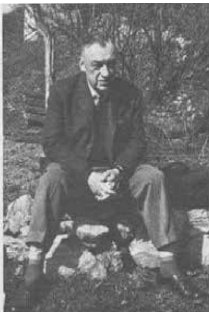
Il card. Stefano Trochta nel 1964: rilasciato dal carcere ma ancora privo dei diritti civili, fu manovale, muratore, addetto alle pulizie.

Fu fatto Vescovo giusto in tempo per esporsi alle nuove persecuzioni del nuovo regime. Venne condannato a 25 anni di carcere per «alto