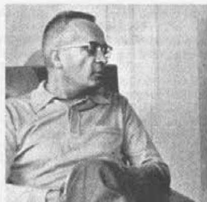
Padre Pican: una visita di 15.000 chilometri.

A Pointe-Noire essi arrivarono nel 1959 su invito del vescovo, e presero in consegna oltre alla parrocchia una scuola tecnica con internato. Al loro fianco lavoravano collaboratori e professori congolese. Nel 1965 la scuola venne nazionalizzata, e ciò lungi dal