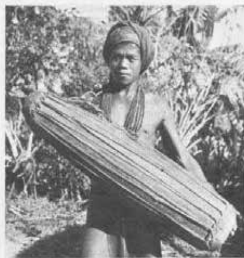
Un ragazzo Garo col tipico tamburo delle danze per i giorni di festa.

Dove non manca più nulla. Così suor Innocenza ha bruciato le tappe di quel pionierismo troppo intenso, fatto di privazioni e di disinvoltata immolazione. Alleviata dalle responsabilità direttive, continua a lavorare anche fra le martoriati inquietudini interiori che le sopravvivono negli ultimi tre anni. Periodi di deperimento e di angoscia,