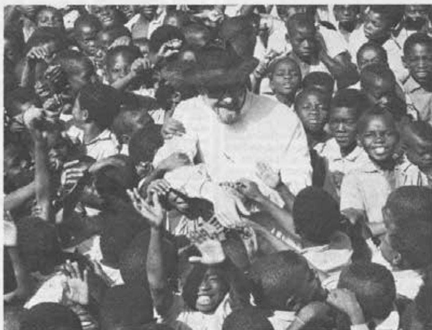
Una scena di ieri (e anche di oggi). Ma le comunità cristiane dell'Africa cominciano a responsabilizzarsi. E il missionario venuto dall'Europa è chiamato a un nuovo rapporto con queste comunità, fatto di servizio, disponibilità e provvisorietà.