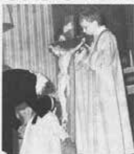
Servizio di copertina, pag. 7