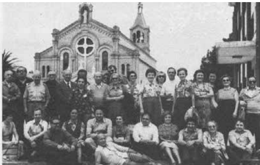
Il gruppo dei Cooperatori salesiani davanti alla chiesa di Fortin Mercedes.