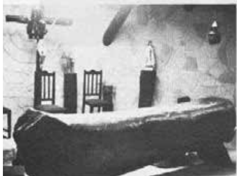
San Nicolás: il primo collegio costruito da papà Benitez è ora trasformato in caserma. Ma la cappellina (nella foto) è rimasta, con la suggestione di quei tempi.

E subito si era messo al lavoro. Sul terreno assegnato appena fuori della cittadina, si cominciò a costruire l'edificio a un piano, circondato da una cancellata di ferro e col bel cortile interno per i giochi dei ragazzi. Intanto Benitez mandava a Torino — togliendoli dalla biblioteca privata — i libri utili per i