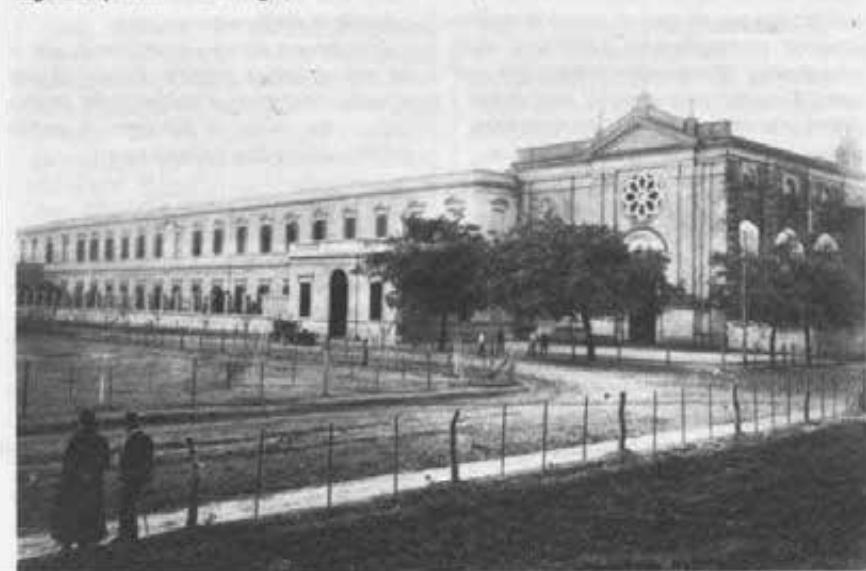
Il secondo collegio, aperto dai figli di Don Bosco a San Nicolás nell'anno 1900. Foto di pag. 25: ragazzi esploratori del collegio, con trombe e tamburi, nell'anno 1927.