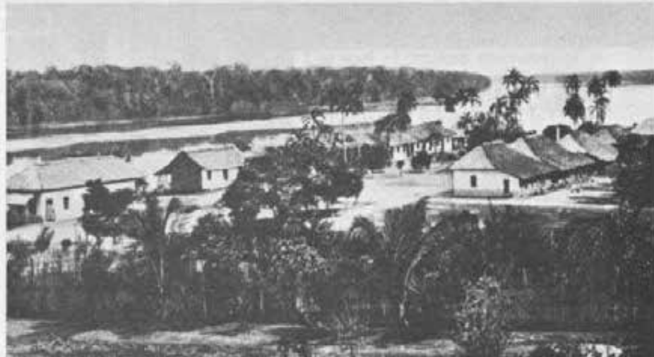
Un villaggio presso Taracua (Rio Negro) costruito dai Tucani sotto la guida dei missionari. I muri sono di paglia e argilla. E fatto il primo, i Tucani sono capaci di farne altri come quello.

Onestà a tutta prova. Ricordo che da ragazzi noi si diceva: roba trovata è mezzo rubata. Ma i miei Tucani non immaginano neppure che si possa chiedere un compenso nel consegnare ciò che si trova.