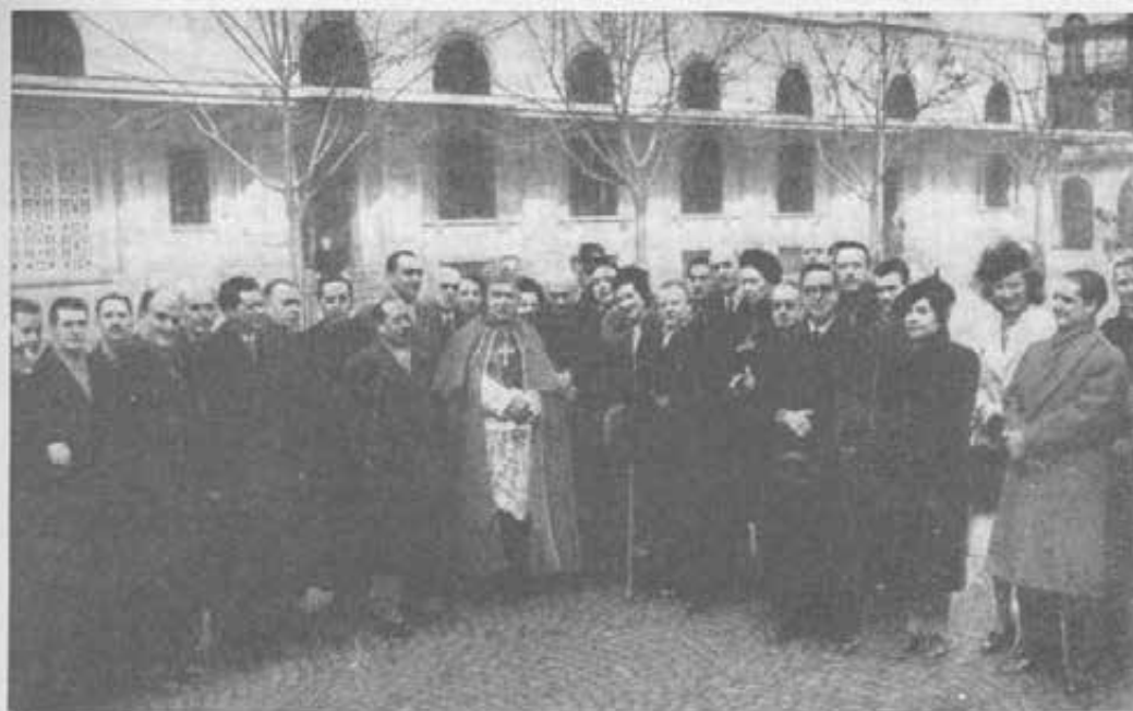
Torino - I giornalisti intervenuti alla festa di S. Francesco di Sales, attorno al Cardinale Arcivescovo ed al Rettor Maggiore.

tata la parola del nostro Don Sinistrero sul « Compito dei Maestri nell'ora attuale ».