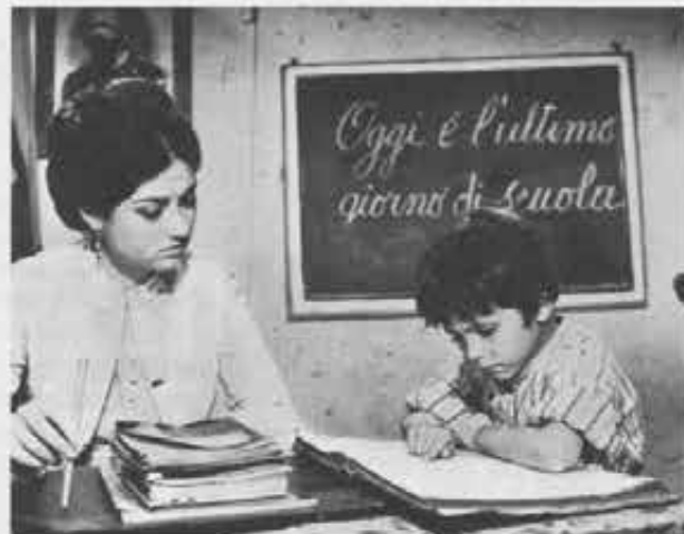
L'inserimento del ragazzo nel mondo della scuola e la necessità di questa per un'autentica apertura alla vita è affrontata nel film «Testa di rapa» (Int. Naz. Luce) diretto da G. C. Zagni. Inquadrata nel tempo del nostro risorgimento, l'opera offre molti spunti educativi

Si schiudono un po' dappertutto interessanti iniziative a carattere più o meno culturale, che si pro-