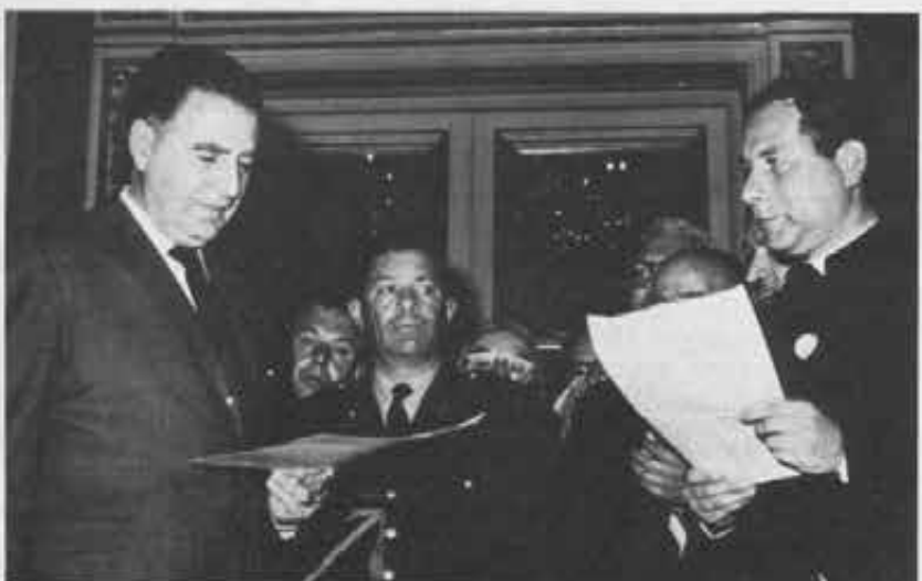
Lima (Perù) - Il presidente della Repubblica Fernando Belaunde riceve dall'ispettore salesiano il diploma di Cooperatore. Da anni il presidente Belaunde lavora con lo spirito di Don Bosco nella organizzazione della "Cooperación Popular", che ha acquistato risonanza mondiale

I Cooperatori salesiani d'Italia e del mondo, che svolgono il loro apostolato al fianco delle altre Opere organizzate, si stanno preparando attivamente al Congresso. L'"Inchiesta" avviata, — per limitarci all'Italia — nei circa 700 Centri Cooperatori, dice l'interesse per una presenza attiva della nostra Terza Famiglia ai lavori dell'importante incontro mondiale del prossimo ottobre.