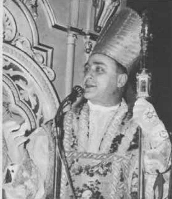
Torino - Festa salesiana a Valdocco.

I diversi interventi si sono conclusi nella Sala del Centro Fides con una preghiera in comune attraverso i testi della Celebratio tenuta l'anno scorso nella Basilica di San Paolo, presenti Paolo VI e l'Arcivescovo di Canterbury.