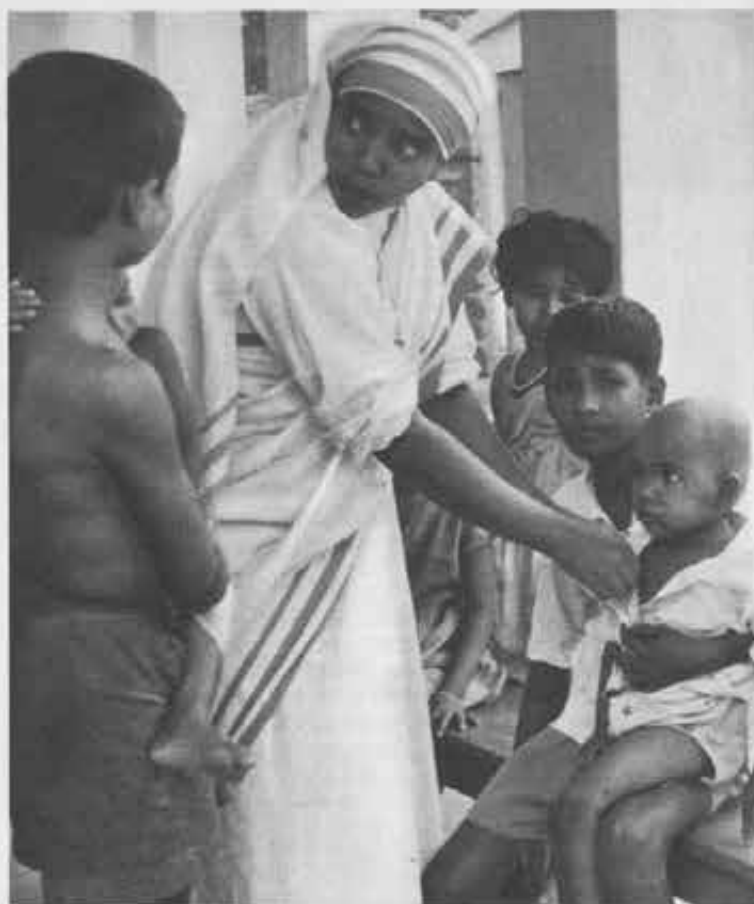
Krishnagar (Bengala-India) • Le suore «cicliste» quando giungono nei villaggi, sono sempre accolte con gioia perchè, oltre impartire lezioni di catechismo, di economia domestica e di igiene, si prodigano anche come esperte infermiere

al dispensario, egli andò in pensione e nessuno più pensava a lui. Ma un giorno vennero a chiamare una suora perchè il bramino voleva parlarle. La suora accorse, e il medico cominciò il discorso molto da lontano. Disse che la serenità imperturbabile dei veri cristiani lo aveva impressionato; aggiunse che il cristianesimo messo in pratica giorno per giorno era una cosa stupenda; dichiarò che per quel che lo riguardava, lui sperava nella redenzione di Cristo e nel perdono dei suoi peccati. Perciò concluse domandando il battesimo. Fu accontentato. Quando morì, lasciò alla missione l'offerta più cospicua che sia mai stata fatta dai fedeli della diocesi: 120.000 lire. Le suore che