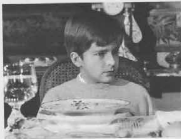
Una inquadratura del protagonista del film "Incognito" (Cineriz). L'opera affronta con serietà e sensibilità educativa il problema della situazione dei ragazzi in seno alla famiglia. Il regista L. Comencini, nel toccare il delicato tasto dello "sconforto" infantile, ha superato i facili pietismi senza cadere nel dramma. Il film insegna molte cose ai ragazzi e ai genitori

luppo fisico è perfetto, la sua educazione adeguata, il suo gusto per la vita è nel soddisfacente esercizio dei sensi, la sua mente funziona da rapida guida, diretta al soddisfacimento economico di fini pratici. Non ha complessi né ideali, e non si stupisce di nulla. Non ha moglie, né figli, né genitori. È giustamente, perché in qualche modo è nato dai desideri repressi e dalle paure inconfessate delle masse. Paure , perché egli — da buon cireneo dell'umanità alienata — le assume tutte su di sé, le vive, le vince, le dissolve. (Combate le atomiche, il pericolo giallo, i russi, i cinesi, i coreani, i delinquenti e perfino la mafia. E con grande sollievo degli spettatori, vince sempre). D'altra parte realizza anche i desideri delle masse, perché ha ciò che l'uomo medio vorrebbe avere: prestantza fisica, salute, fortuna, successo.