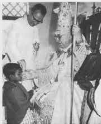
Mons. Luigi La Ravoire Morrow, vescovo di Krishnagar, amministra la creama in un villaggio

Nel cimitero di Bhorpara è sepolto un missionario dei primi tempi. Un mattino si svegliò in preda a brividi e stordito da uno strano malessere. Pensò a un attacco di malaria. Accese il lume a petrolio: erano le tre. Sulla coperta del letto scorse una sagoma sinistra che lentamente si srotolava: un krait , serpente velenosissimo, scivolava via. Si accorse allora d'essere stato morso sopra l'orecchio, e di non avere più spe-