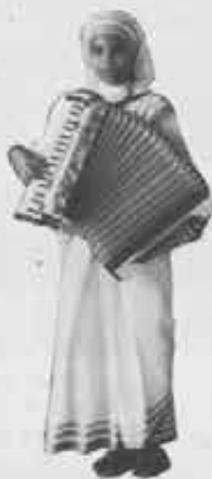
« Servite il Signore nella gioia » è il motto delle «suore del sorriso» di Krishnagar, che si addestrano a suonare gli strumenti musicali più popolari

Il medico del dispensario cattolico di Krishnagar, per esempio, era un bramino di alto rango, al quale nessuno mai aveva osato parlare di religione o di conversione. Dopo vent'anni di servizio