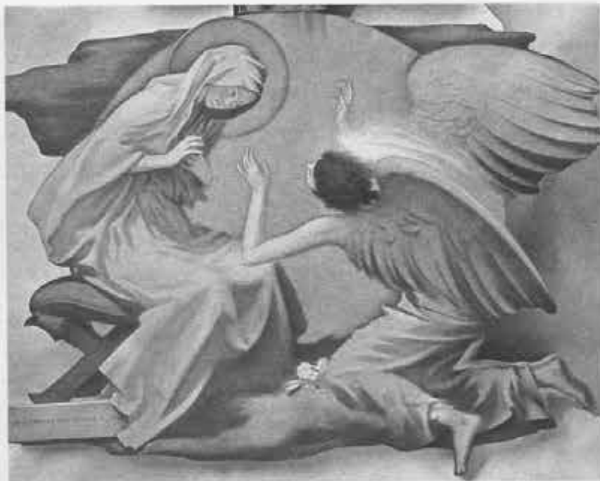
Annunciazione, 1966 (Cappella Figlie della Carità a Montanaro, Torino)

«L'immagine fatta dipingere da don Bosco era di un certo Tomatis che aveva studiato anch'egli all'Accademia Albertina — mi ispirò non tanto dal punto di vista iconografico quanto di quello del costume ed in particolare l'acconciatura dei ca-