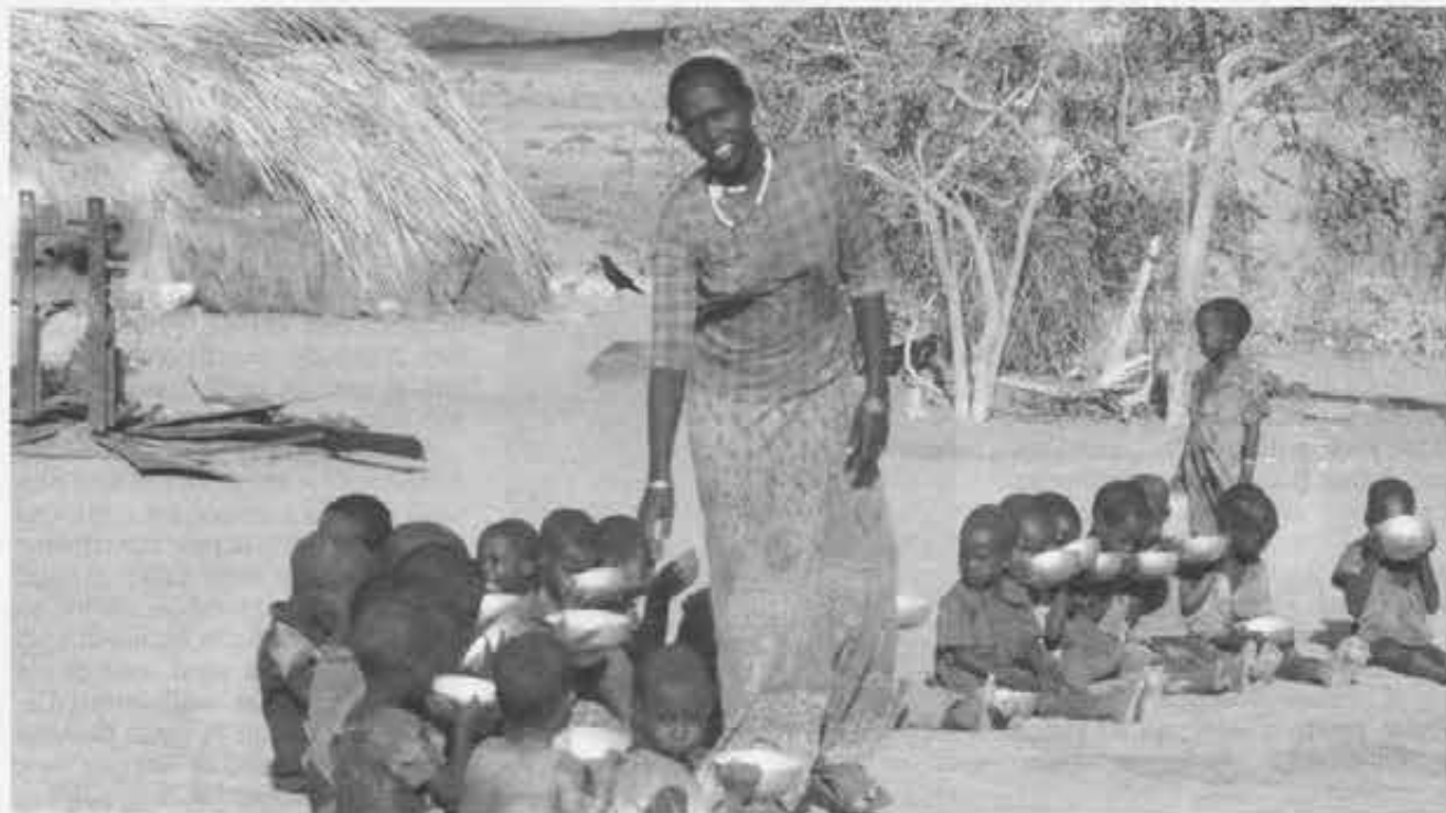
■ Distribuzione di latte a Korr

le e cinquecento metri sul livello del mare e con pochissima piovosità annuale.