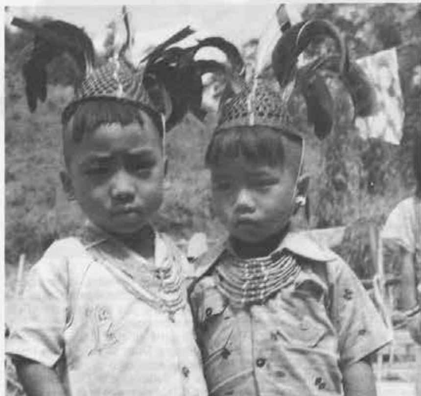
Bambini e guerrieri della tribù Koniak Nagas

La Chiesa di Shillong cresce pur tra le difficoltà e nel 1969 Paolo VI l'eleva ad arcidiocesi. «Questo è un grande giorno per l'Assam e per l'intera Chiesa in India», può affermare il 5 ottobre l'arcivescovo di Calcutta, Picachy, durante la cerimonia di intronizzazione del primo arcivescovo di Shillong-Gauhati, monsignor Hubert D'Rosario, salesiano indiano. «Una nuova provin-