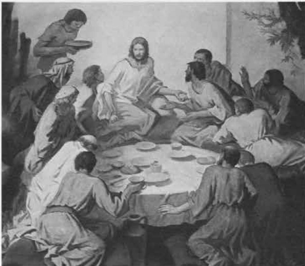
Ultima Cena (Colle La Salle, Roma)