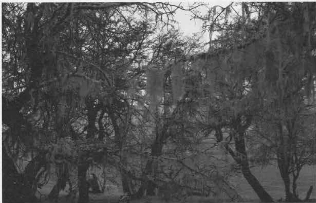
Aspetto del «bosque patagonico» nella Terra del Fuoco.

svedese Otto Nordensköld vi troverà «un record mondiale di taverne dove la gente del mare, i pecorai, i cercatori d'oro e un gran numero di avventurieri vanno a sorbirsi la "copita" e a scialacquare i risparmi fatti in lunghi mesi di lavoro e fatiche». Un censimento della borgata (1890) darà 1800 abitanti in 180 case, con non meno di 65 bettole, una ogni 25 abitanti.