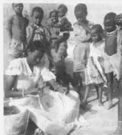
■ Lavori in paglia

un ritmo ordinato ed attento. Grazie al loro lavoro centinaia di mamme sono assistite in programmi di nutrizione per esse stesse ed i loro bambini. È una presenza umanamente eccezionale.