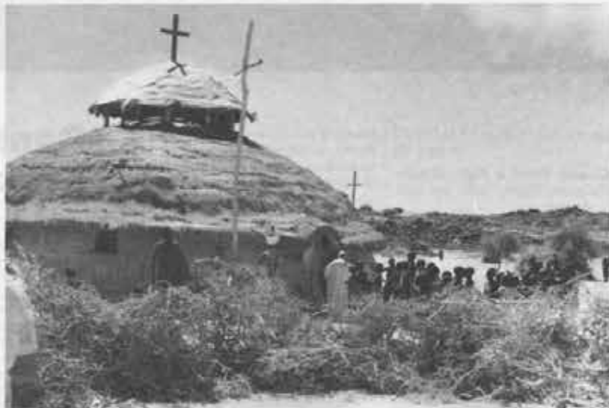
La cappella - capanna di Korr verrà presto sostituita da una chiesa in muratura

proprio come la capanna Rendille. Alla sua costruzione — qui occorre portare oltre ai materiali anche la manodopera — hanno contribuito un gruppo di ragazzi della Lombardia appartenenti all'organizzazione «Africa Oggi». Sono andati laggiù — provenienti da Covenago, Agrate Brianza, Cadonino Monzese e Milano — autofinanziandosi per condividere la stessa esperienza del missionario e si sono fermati un mese.