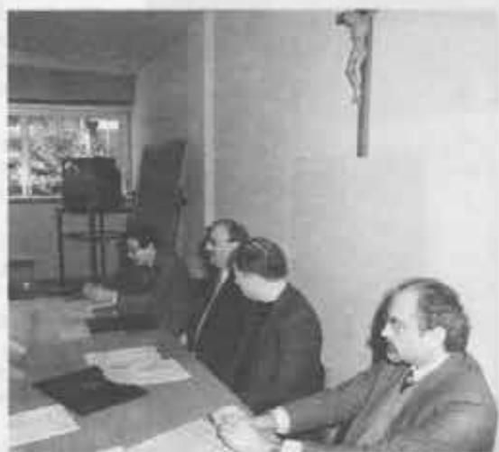
Dibattito sull'informazione religiosa