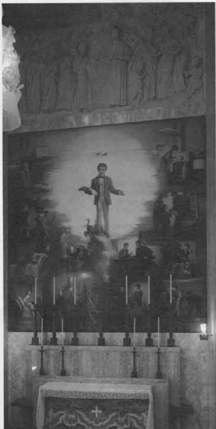
Il Domenico Savio del Tempio D. Bosco a Roma

Il Cristo Risorto, Maria Ausiliatrice, don Bosco, Domenica Mazzarello, Domenico Savio ed altri ancora rappresentano infatti da più di