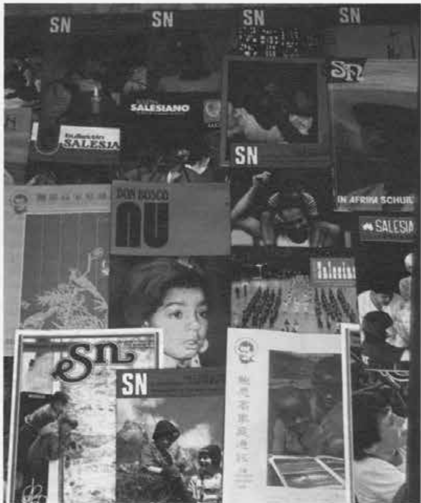
Tante copertine una sola testata: il Bollettino Salesiano

complesso ha dato ai direttori la possibilità di approfondire sotto molteplici angolazioni la conoscenza del settore in cui si trovano ad operare. Impossibile anche solo riassumere la massa di informazioni che i vari relatori, via via presentati da don Costa, hanno fornito. Ci limiteremo anche qui a rapidi cenni, al solo scopo di dare un'idea dell'articolato tessuto di base del Seminario e delle significative presenze che ha registrato.