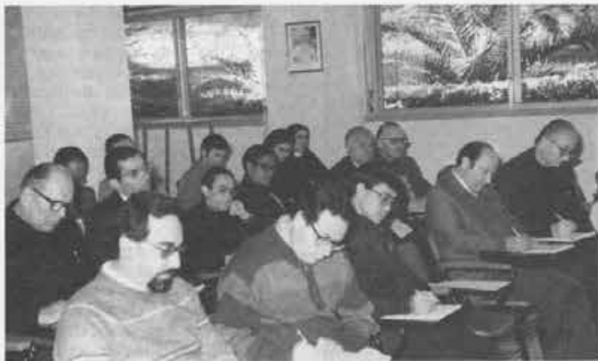
Un gruppo dei partecipanti al seminario