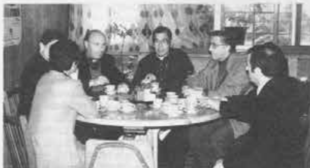
Nella foto: Un momento della visita

L' Anno internazionale della Gioventù ha dato al cardinale Kim arcivescovo di Seul e ad un rappresentante del Governo coreano l'occasione di conoscere l'Istituto Don Bosco e di incoraggiare l'attività salesiana a vantaggio dei giovani operai della città.