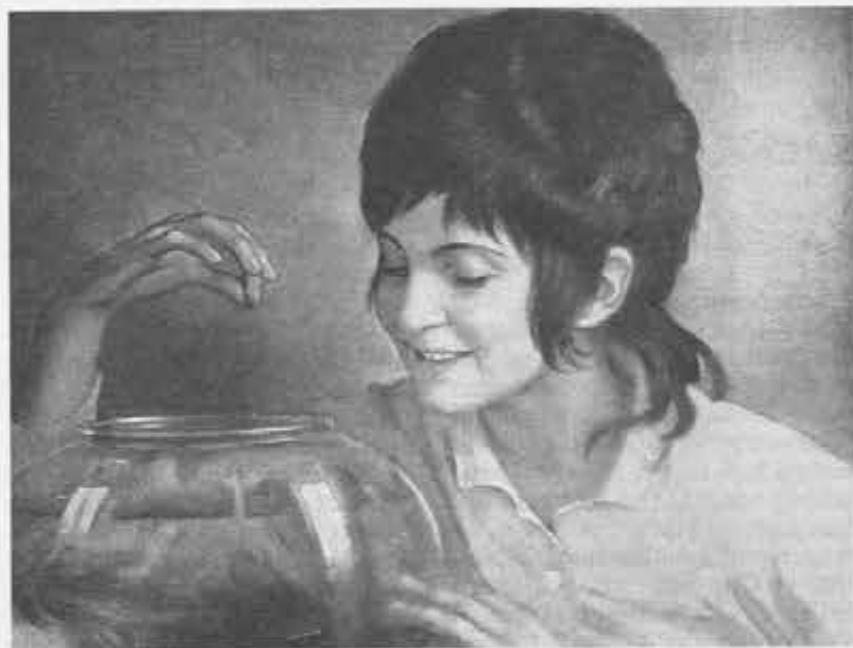
■ Ritratto di fanciulla

PELLI e l'insieme. Don Caviglia poi volle inviarmi un suo allievo — ora sacerdote salesiano — come modello. Da questa copia dal vero ho attinto molto ma sempre con la preoccupazione di dipingerlo così come avrebbero potuto dipingerlo pittori della sua epoca».