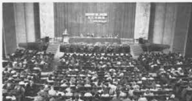
Nella foto: Immagini della manifestazione

hanno reso pienamente partecipi i tanti studenti che gremivano la sala del Teatro Nuovo. L'iniziativa del Liceo Valsalice è riuscita ad imporsi all'intera città di