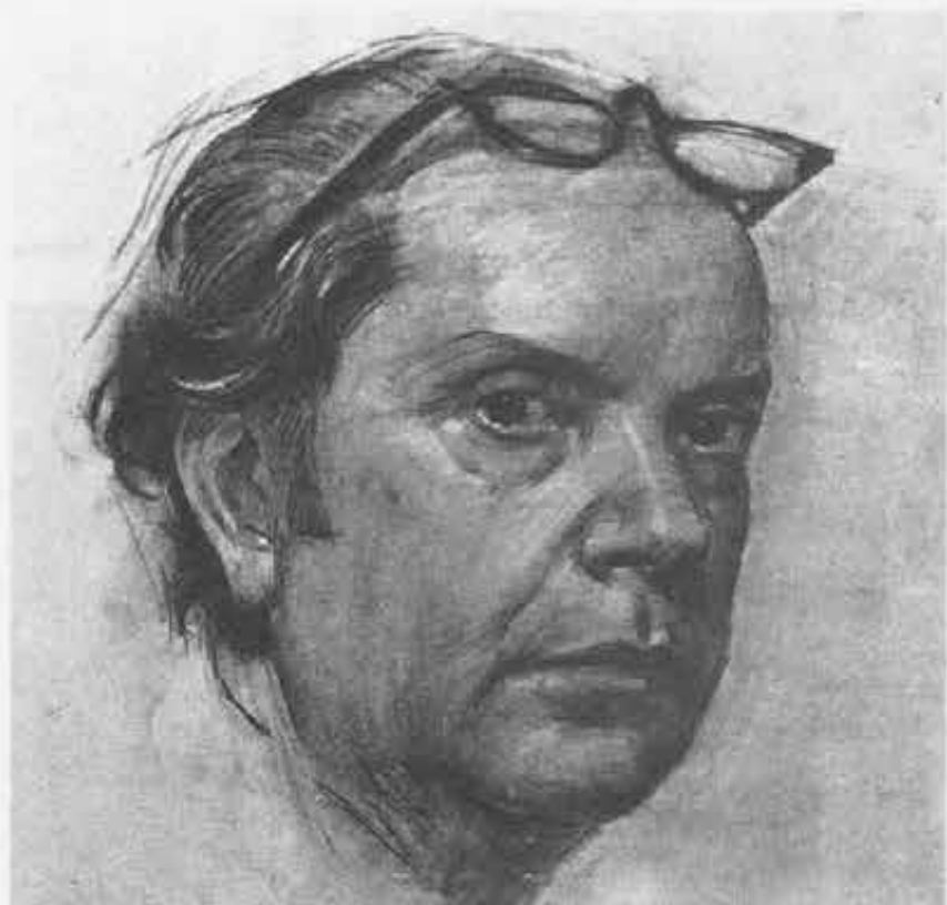
■ Autoritratto di Cáffaro Róre

cinquant'anni l'oggetto pittorico del maestro Cáffaro Róre tanto che questi ha finito con il segnare visivamente la stessa devozione e spiritualità salesiana.