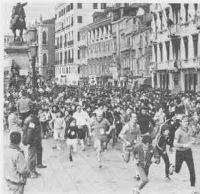
Italia: «Un giorno di marzo», diciottomila veneziani partecipano alla marcia organizzata dal TGS (Turismo Giovanile Sociale).

★ «Un giorno di marzo», documentario 16 mm a colori, durata 35'. A cura dei centri TGS del Veneto e Friuli-Venezia Giulia. Via Marconi 22, Mogliano Veneto (TV).