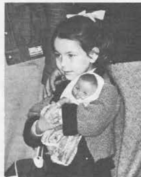
Mamme, papà, ragazzi visitano volentieri il Centro, e riportano un'impressione grata e duratura.