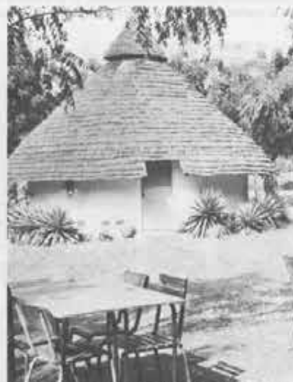
Tambacounda, nell'interno del Senegal: i missionari si costruiscono capanne simili a quelle della popolazione.