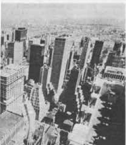
Nel 2000, Città del Messico avrà 32 milioni di abitanti, Tokyo, 26, New York 22. Così prevedono gli esperti. E che ne sarà dell'uomo?

uso del consumatore stanno però nascoste le motivazioni reali, quelle di chi incoraggia al consumismo. Motivazioni, come si è accennato, a volte di carattere ideologico, ma più spesso di indole economica. In ogni caso si ha sempre sopraffazione dell'uomo sull'uomo. Le conseguenze possono essere le più svariate, ma tutte hanno in comune la perdita dei valori autentici della vita.