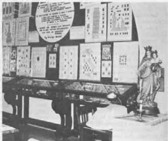
L'esposizione dei francobolli mariani, delle monete e delle medaglie con l'effigie della Madonna, provenienti dalle più diverse parti del mondo.