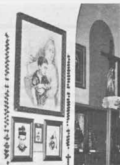
effigie. Al centro, quadro del pittore Giorgio Rocca: la Madonna protegge un bambino vietnamita. A destra «Maria Bambina»: cera del 1700.