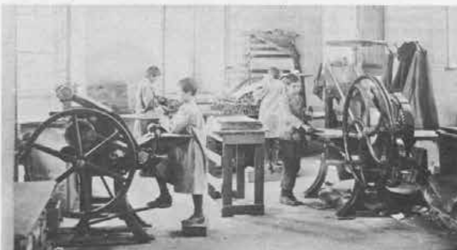
Uno dei primi laboratori, quello dei tipografi-impressori. I ragazzi sotto la guida del Coadiutore imparavano un mestiere, e sul loro esempio imparavano a vivere «da buoni cristiani».

Don Bosco comincia a spiegarsi. Nell'ottobre 1862 Don Bosco presentava ai novizi una concezione «organica» della sua congregazione: un organismo vivente — diceva — ha bisogno di parti ben differenziate ma armoniosamente fuse e in piena collaborazione fra loro; così in congregazione occorrono il sacerdote e il chierico, ma anche altri che si occupano di tutti gli aspetti materiali. E poiché «tutto ciò che fa uno va anche a profitto dell'altro», esortava a «fare