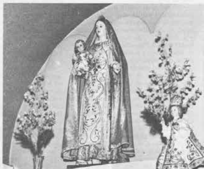
Uno dei pezzi più belli del Centro di Documentazione Mariana: una «statua vestita» della Madonna, risalente alla seconda metà del 1600.