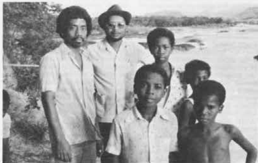
Ragazzi di Bemaneviky, e tra loro — con occhiali e cappello — il loro vescovo mons. Ferdinand Botsy. Bemaneviky è la località che il vescovo intende affidare ai missionari salesiani.

Un altro dato impressiona i due missionari: il Madagascar è un paese di ragazzi e bambini. Secondo una recente statistica, su poco meno di 9 milioni di abitanti, 3.998.000 (cioè il 45,2%) sono dai 14 anni in giù. «Questo dice qualcosa per noi salesiani, non vi pare?», osserva don Lemma nella sua ultima corrispondenza da Ambositra. ■