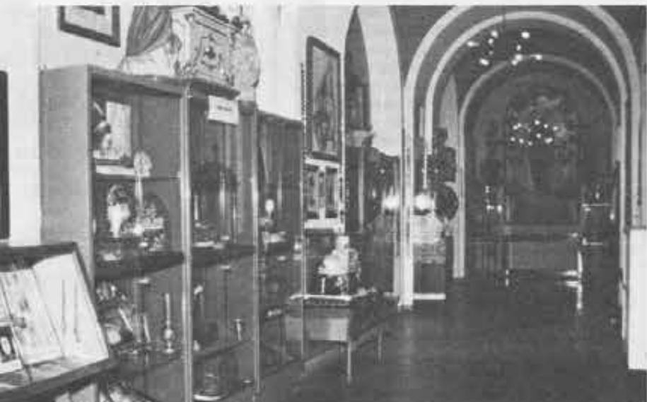
Veduta d'insieme di una sala del Centro. Sulla parete di fondo è collocato il quadro dell'Immacolata che era stato commissionato da Don Bosco al pittore Rollini e datato 1882.