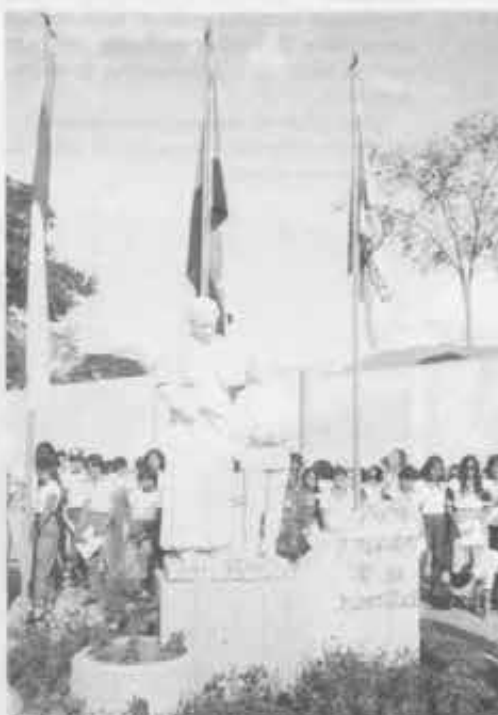
Il bel monumento a «Don Bosco padre e maestro della gioventù», nel giorno di inaugurazione del Centro Giovanile. Sopra il titolo: il coro dei giovani mentre si esibisce nella festa.

Come servizio pastorale da rendere ai giovani, il Centro intende essere una comunità impostata col metodo educativo di Don Bosco, e orientata