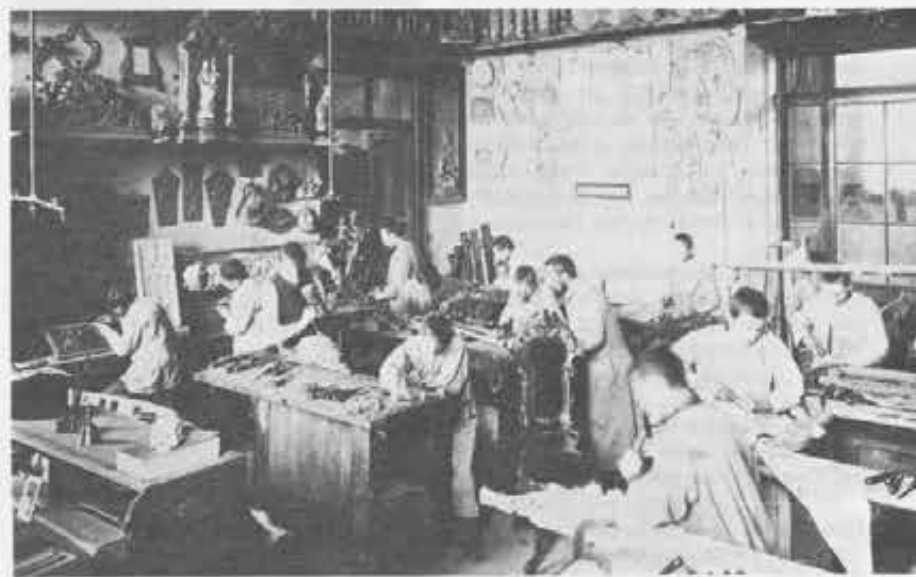
Altro laboratorio dei primi tempi di Valdocco, quello degli scultori.

Altro ruolo insostituibile compete e compete al SC nello stretto ambito dell'educazione dei giovani. Il ragazzo, di passaggio nell'opera salesiana in attesa di ritrovarsi immerso nelle faccende del mondo, cerca istintivamente negli adulti i modelli di comportamento; e trova più vicino a sé non certo il sacerdote — avvolto nell'alone mistico della vita sacramentale —, ma il SC in maniche di camicia e con le mani impastate nelle cose concrete. Se poi questo laico in cui si imbatte, oltre che esempio di attività manuale è anche esempio di onestà e di vita cristiana, l'efficacia