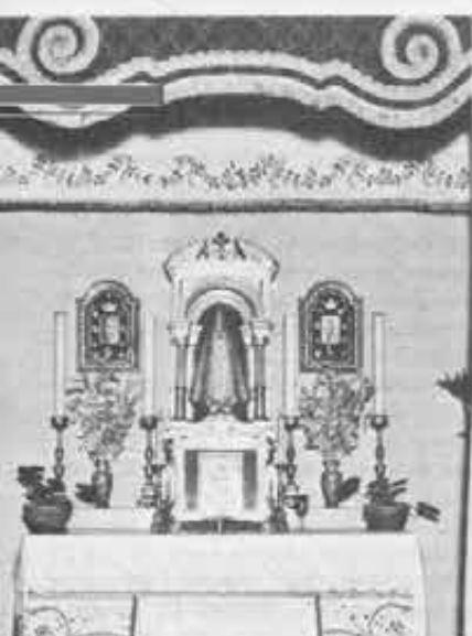
A sinistra, l'altare con la «Madonna del giorno»: ogni giorno in qualche parte del mondo si celebra una festa mariana, e qui viene esposta la sua