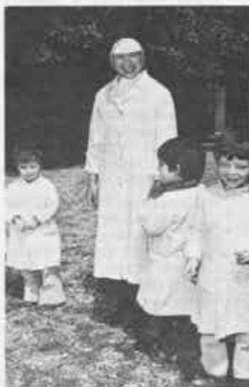
Suora della Carità di Miyazaki, nella casa che hanno aperto a Roma.

JOYEUSAZ (Gioioso) sac. ABELE, salesiano. Era nato a Saint-Pierre (AO) il 31.12.1903, morto al Colle Don Bosco il 5.4.1981. Aveva 78 anni di età, 60 di vita salesiana e 50 di sacerdozio. Era stato per 4 anni maestro dei novizi, per 25 direttore, per 5 ispettore della Novarese Elvetica (1955-59); da ultimo rettore del santuario sul Colle e custode della Casetta.