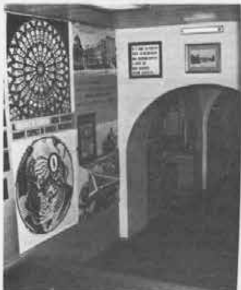
L'ingresso: sulla destra una tela ottocentesca di scuola bolognese, con l'Arcangelo dell'Annunziazione; e poi quadri, standardi, foto, ex voto...