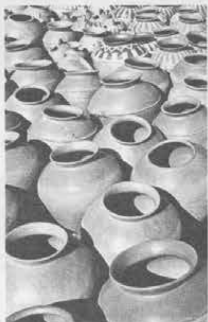
Terracotte dell'artigianato senegalese esposte al mercato.

«I ragazzi, porzione della vigna del Signore destinata ai salesiani, qui sono numerosi come i moscerini»; e ancora: «Solo il 40% dei bambini vanno per qualche anno alle scuole elementari, solo un 20% arrivano alle medie...».