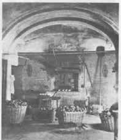
La panetteria di Valdocco. In un primo tempo con la parola Coadiutore s'intendeva una persona che aiutava in casa e per la sua prestazione veniva retribuita. Poi il termine acquistò il significato preciso — proposto dai documenti della Santa Sede — di religioso laico consacrato per una missione.

Buzzetti, testimone dagli inizi. A nove anni arrivò a Torino dalla nativa campagna milanese per fare il garzone di muratore: era il 1841, l'anno in