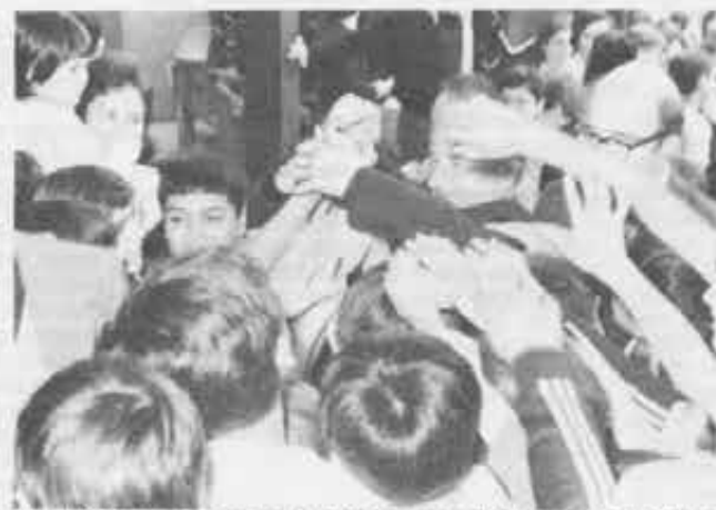
Cile: il Rettore Maggiore ha la febbre. E i ragazzi dell'oratorio di Santiago — allegramente preoccupati — vogliono sentire il polso e quanto scotta la fronte... (Don Viganò nell'aprile scorso era in visita all'America Latina).

Sembrava tutto troppo bello. E infatti non più tardi di 24 ore l'Istituto Nazionale dell'Indigeno faceva inspiegabilmente marcia indietro e spingeva il governo a ordinare che gli indigeni fossero trasferiti in altra località. La cosa in sé sarebbe stata accettabile, ma quell'altra località, chiamata « Km 220 », risultava « inabitabile, priva di acqua, con terreno argilloso e quindi inadatto alla coltivazione dei campi ». Gli indigeni si rifiutarono di partire, ma dopo pochi giorni arrivarono i milita-