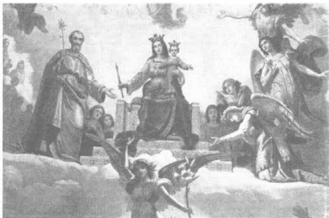
La potente Ausiliatrice di San Giovanni Bosco (particolare della cupola grande della Basilica).