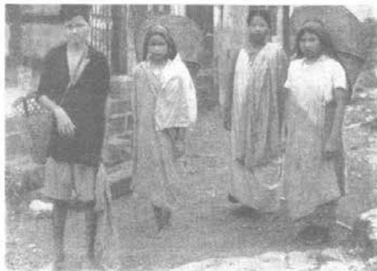
ASSAM (India) - Colline Khasi - Tribù Uar - Vanno al mercato

✠ STEFANO FERRANDO Vescovo di Shillong (Assam-India).