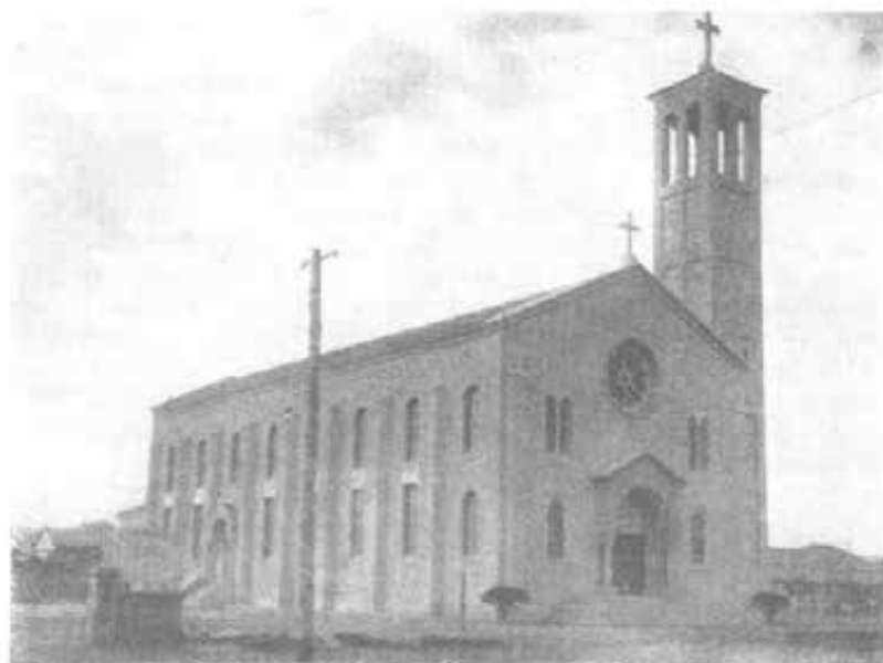
GIAPPONE - La nuova chiesa di Oita, inaugurata l'11 novembre 1951