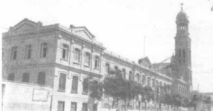
LIMA - Casa Ispettorale e Tempio di Maria Ausiliatrice