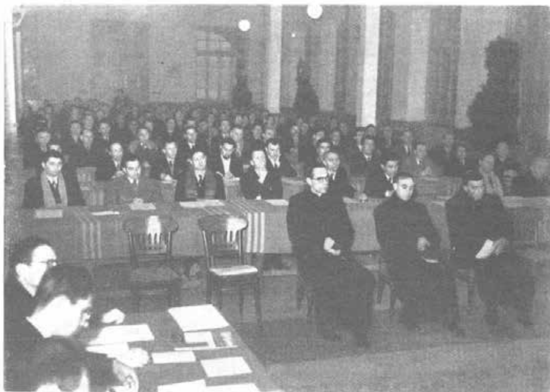
TORINO - Il 1° Convegno della Didattica Professionale Salesiana.

I componenti il folto gruppo, accompagnati dai predetti Superiori, vissero una giornata indimenticabile, profondamente salesiana, tra l'allegria degli alunni del modernissimo Istituto e la pace spirituale della casetta di Don Bosco, Betlemme salesiana.