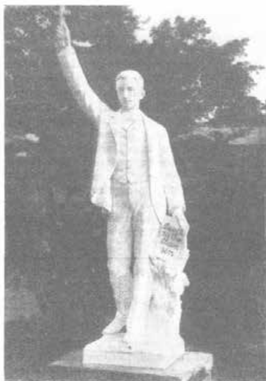
SHRIGLEY (Inghilterra) Monumento al Beato Domenico Savio.

A convertire questa fiamma già viva in vero fervore di ardente devozione venne la Beatificazione con le sue solenni ed entusiastiche celebrazioni che mossero non solo la gioventù salesiana, ma tutta la gioventù e le famiglie cattoliche, mettendo in risalto la figura del Savio come mèta ed esemplare per educandi ed educatori. Per glorificare il Savio, frutto della pedagogia di Don Bosco, si fecero conferenze riuscitissime agli Educatori cattolici e si stamparono due libri: Serè como tú , studio sul lavoro educativo di Don Bosco su Domenico Savio, e Un modelo para tí , commento incisivo e avvincente alle caratteristiche