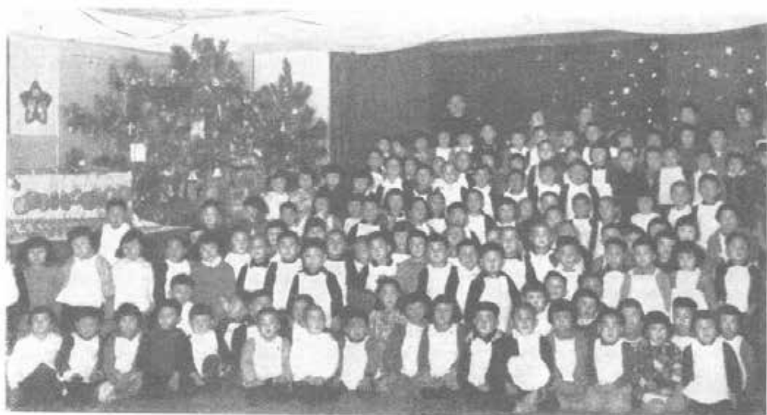
OITA (Giappone) - Gruppo di bambini nella notte di Natale.