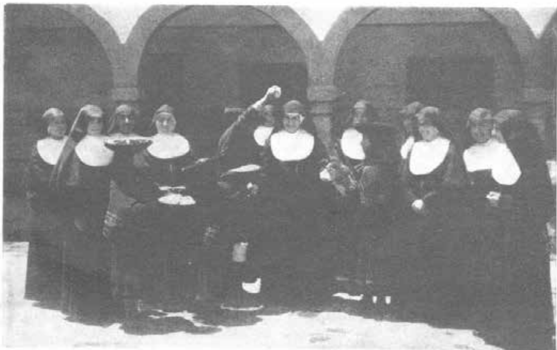
CUZCO (Perù) - Donne Indio che offrono doni alla Rev.ma Madre Visitatrice.