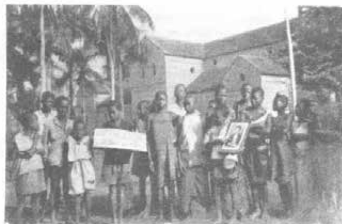
BUTA (Congo Belga) - Un gruppo di amici del Beato Domenico Savio.

Lo stato presente del martoriato Paese di Gesù ha ostacolato, ma non impedito ai Salesiani di concretizzare un vasto programma di manifestazioni destinate a glorificare il beato Domenico Savio e a diffonderne sempre più la conoscenza. Anche tra i conterranei di Gesù l'angelico Giovane conta ormai innumerevoli amici, alcuni dei quali hanno già ricevuto grazie straordinarie per sua intercessione. Sua Beatitudine