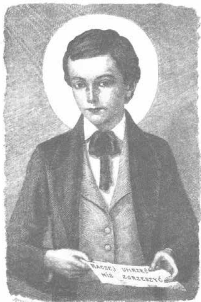
L'immagine del B. Domenico Savio venerata in Polonia.

la vita di Domenico Savio scritta da Don Bosco. Il libro fu largamente diffuso nelle scuole della Missione, e da qualche insegnante delle Scuole elementari fu persino adottato come testo di educazione morale. Negli Oratori aperti dai Salesiani in Missione e nella Capitale si fecero conoscere a tempo le virtù dell'angelico giovanetto stimolando gli allievi all'imitazione e all'emulazione. Parecchi giovani, al bettesimo, vollero chiamarsi « Domenico Savio » per averne più sicura la protezione. Ma la casa che più intensificò la devozione a Domenico Savio fu ed è certamente quella di Nakatsu che favorì sempre tra gli allievi la conoscenza e la devozione al santo Protettore; devozione che servì di valido aiuto nell'opera educativa dei giovani stessi, e che fu premiata anche con una grazia veramente straordinaria: la guarigione istantanea di un giovanetto nel 1950. Per la conoscenza del santo Allievo di