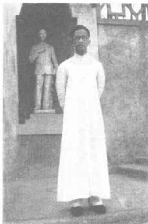
SHILLONG (Assam - India) - Studente di Teologia Khasi presso la statua di Domenico Savio.

assai critico si è vista affluire le novizie invocando il Beato. Tutte le novizie ora lo prendono come protettore. Nel Bollettino Salesiano Olandese fu riferita a suo tempo una grazia strepitosa ottenuta