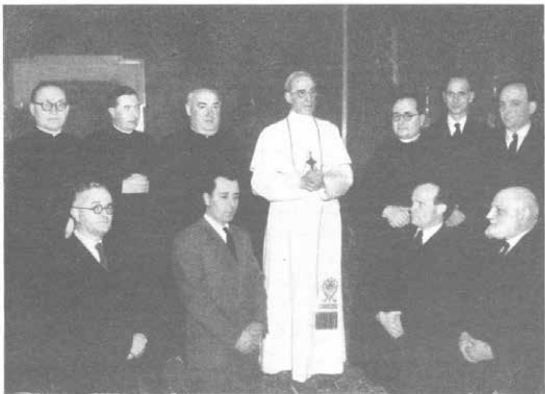
Il Santo Padre si compiace posare tra i Salesiani che dirigono la Tipografia Poliglotta Vaticana (27-1-1952)