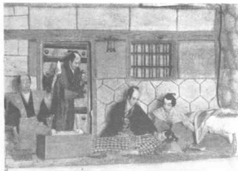
OITA (Giappone) - L'ultima scena del dramma "Cikatorà".

di musica italiana, diretto dal nostro venerando e sempre giovane Mons. Cimatti.