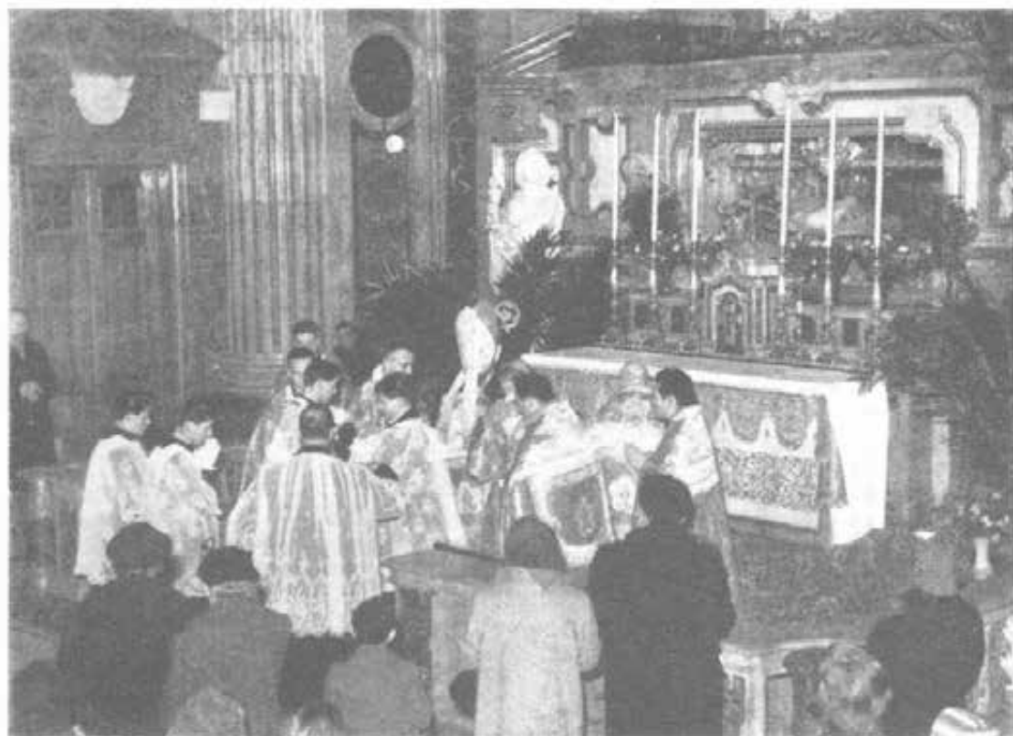
TORINO - Festa di San Giovanni Bosco - L'incensazione all'altare del Santo