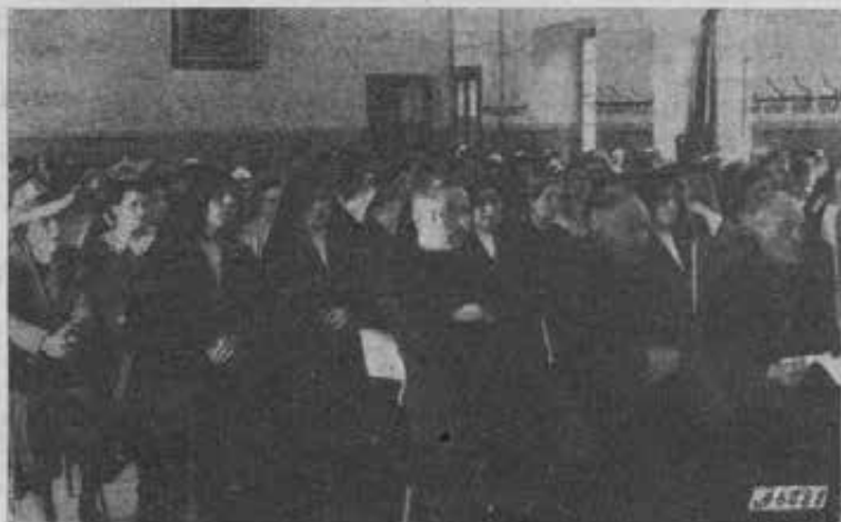
Ivrea - Durante il Congresso delle Suore, Maestre e Catechiste.

Le riunioni furono rallegrate dalla banda musicale del Dopolavoro.