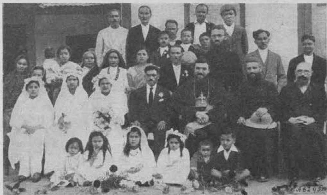
SHIHOUG • Novelli sposi attorno al Vescovo dopo la celebrazione delle nozze.