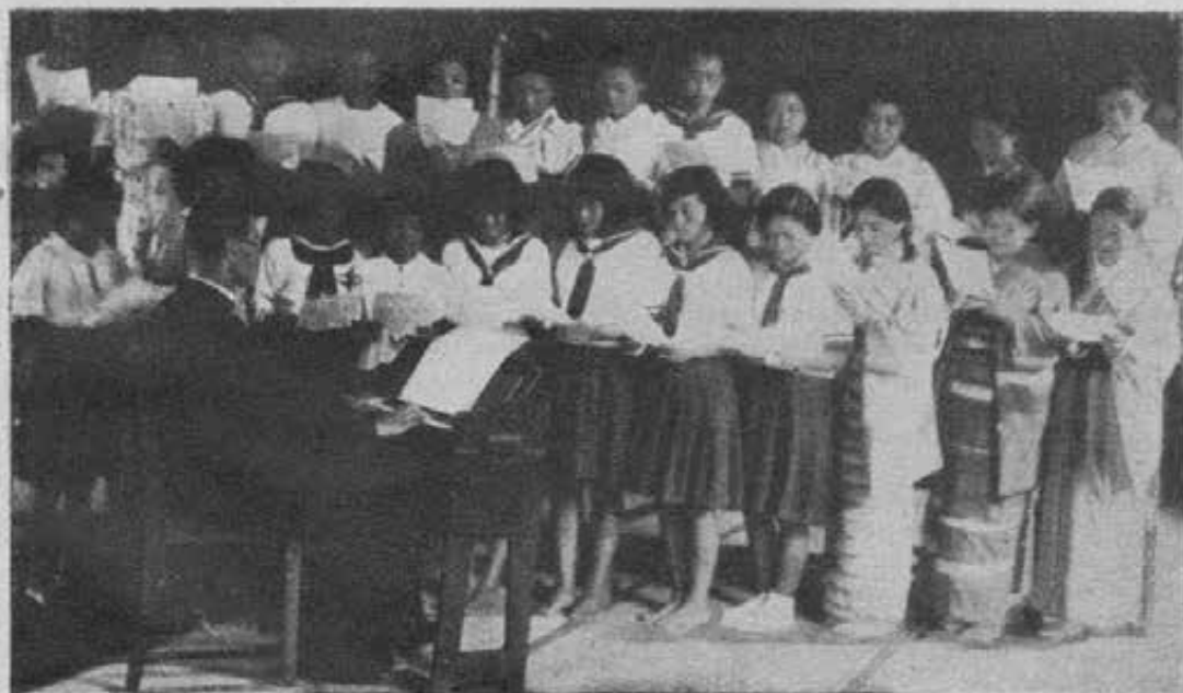
Miyazaki - Le alunne della scuola di canto.