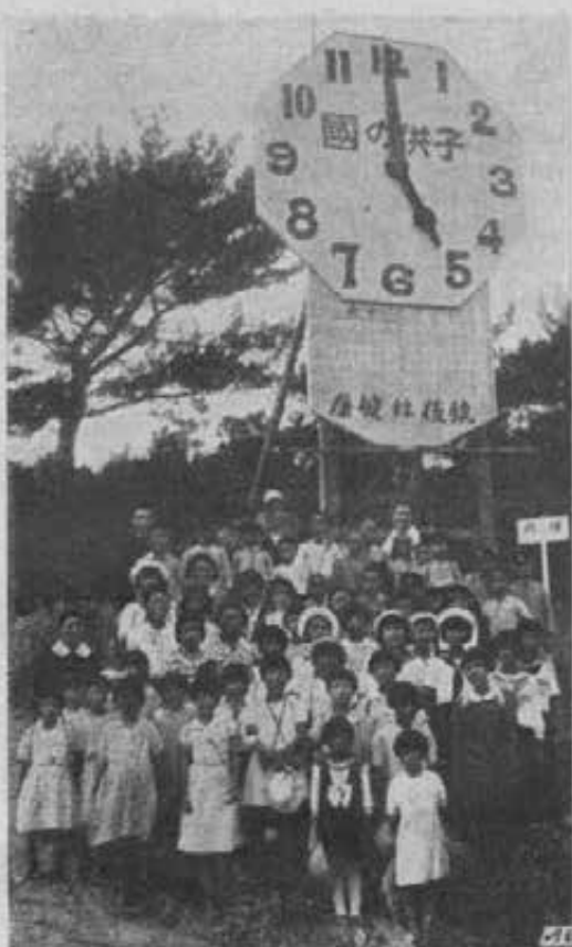
Miyazaki - I premiati alla gara catechistica.

Quanto alle manifestazioni religioso-tradizionali anche per il fatto della nuova legge sulle religioni emanata in Giappone (non ancora applicata su tutta la linea per le religioni che hanno domandato il riconoscimento ufficiale) si è notato da qualche tempo a questa parte un accrescimento e rinnovamento non solo di edifici, monumenti o altri segni, rimessi a nuovo o costruiti ex novo, ma di tutta l'attività di cui sono rappresentazione: pubblicazioni a stampa, discorsi, pellegrinaggi, feste e cerimonie, propaganda all'interno e all'estero, ecc. Per dire di alcune che cadono in aprile ad es., bisogna vedere lo splendore con cui si