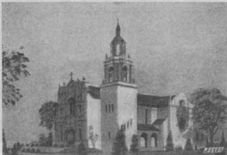
New Orleans - La bella chiesa dedicata a S. Giovanni Bosco. (v. Bollettino di luglio, pag. 158).

sacerdotale di Don Bosco, nella magnifica Basilica di S. Croce, il 29 giugno u. s., è assunta ad una vera glorificazione cittadina. Vi accorse una folla imponente di Cooperatori e di ex-allievi, ed un'eletta rappresentanza del Clero e del Patriziato fiorentino, degli Ordini e delle Congregazioni religiose, degli Istituti di edu-