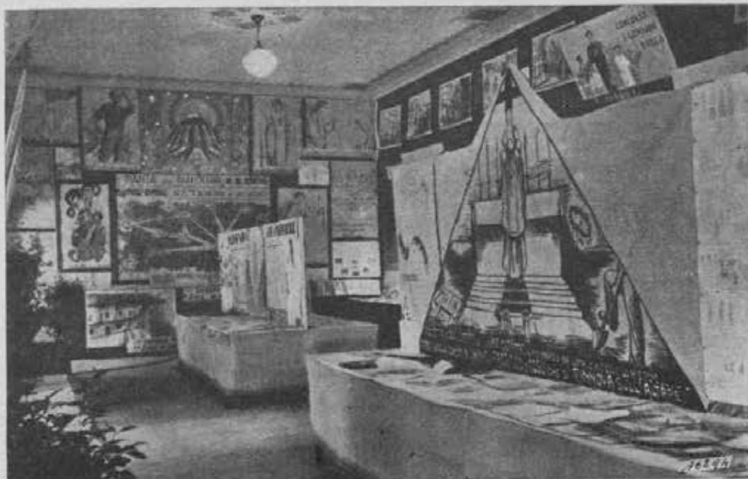
Ivrea - Uno scorcio della Mostra Catechistica.

Terminato il discorso di Mons. Piccioni, accolto da unanimità di consensi, fu data lettura di un telegramma inviato dal nostro Rettor Maggiore.