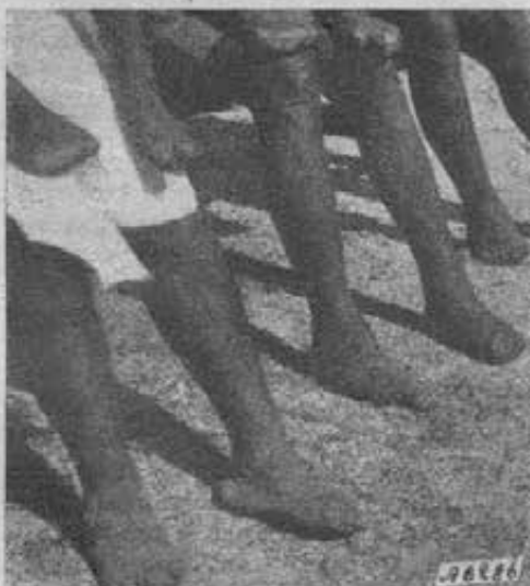
Tura - La lebbra agli arti inferiori.

Garo fu lungo e faticoso: ho fatto colla mia macchina più di 1200 chilometri. Troppo sovente la strada era in pessimo stato tra la bella foresta dell'Assam. Non ci mancarono avventure; ma, grazie a Dio, ogni cosa andò bene. Per la prima volta abbiamo potuto organizzare due grandi Convegni tra i Garo. È consolante vedere come questa tribù, che un'ottantina di anni fa era temuta come composta di cacciatori di teste, ora accolga con docilità il santo Vangelo! I due convegni durarono quattro giorni. Ampie tettoie coperte di paglia ospitarono i cristiani che giunsero anche da molto lontano. Abbiamo trattato i più vitali problemi religiosi con grande praticità e frutto spirituale. Ambedue si chiusero colla processione eucaristica che riuscì assai bene, quantunque fosse un'impresa incolonnare donne e fanciulli che non avevano un'idea del nostro ordine processionale. In mancanza di bande strumentali, supplirono i tamburi locali. In uno dei convegni abbiamo tenuto anche la gara di Catechismo, con candidati di diversi villaggi, che contavano dai 10 ai 40 anni. Nelle notti precedenti, mentre gli altri cantavano e saltavano fino a mezzanotte, questi studiavano di gran lena per imparar bene a memoria le risposte. Il tentativo è riuscito oltre