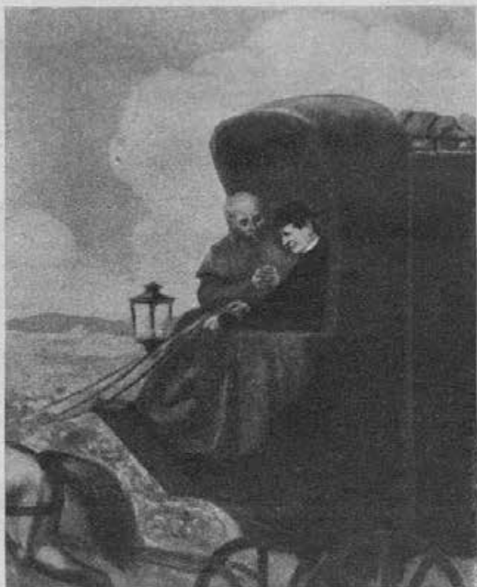
Don Bosco confessa a cassetta di una pubblica diligenza (Illustrazione del Galizzi).

Fondata che fu la Società Salesiana, il fondatore le assegnò, secondo il costume, lo stemma e un motto. Il motto dice: Da mihi animas cetera tolle . Queste parole vogliono significare che per guadagnare anime a Dio i soci debbono essere sempre disposti a sacrificare ogni altro interesse. Di ciò tutta la sua vita fu mirabile esempio. Ben poteva egli appropriarsi la dichiarazione di S. Paolo che, scrivendo ai Cristiani di Corinto, protestava di sentirsi pronto a dare per le anime non solo quanto aveva, ma anche tutto se stesso: impendant et superimpendar .