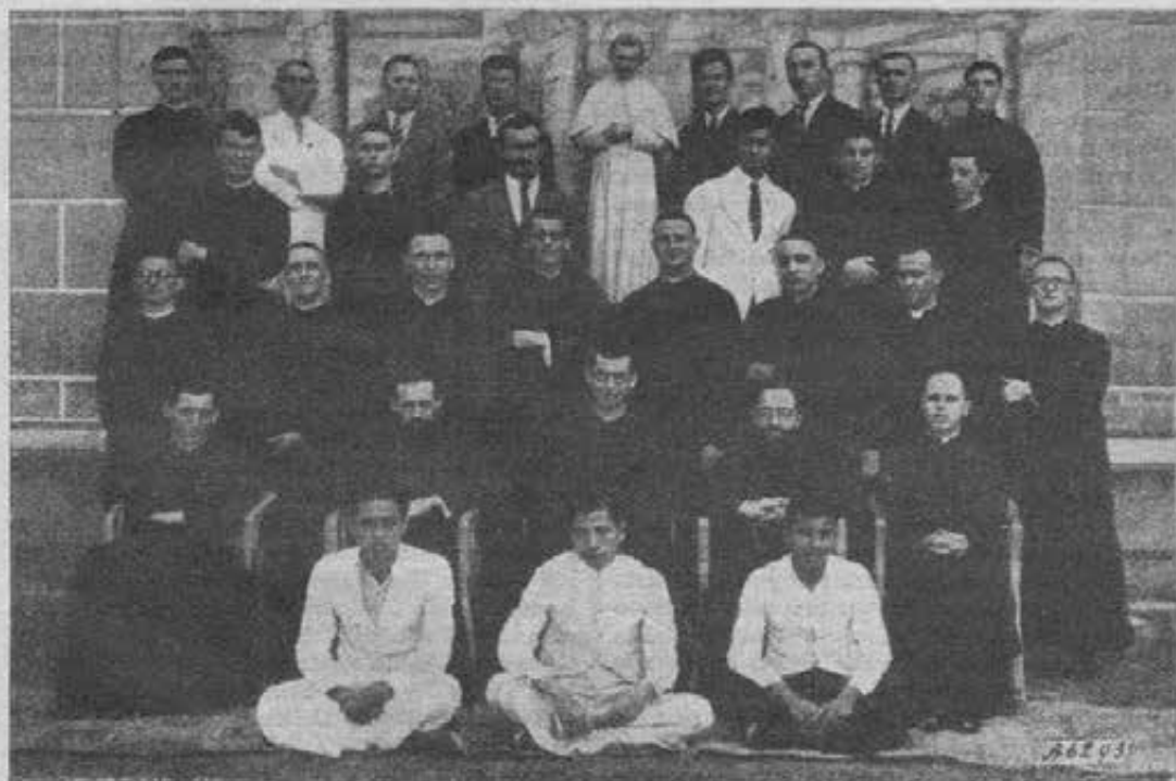
Thailandia - I Salesiani della Casa di formazione di Bang Nok Khuek.