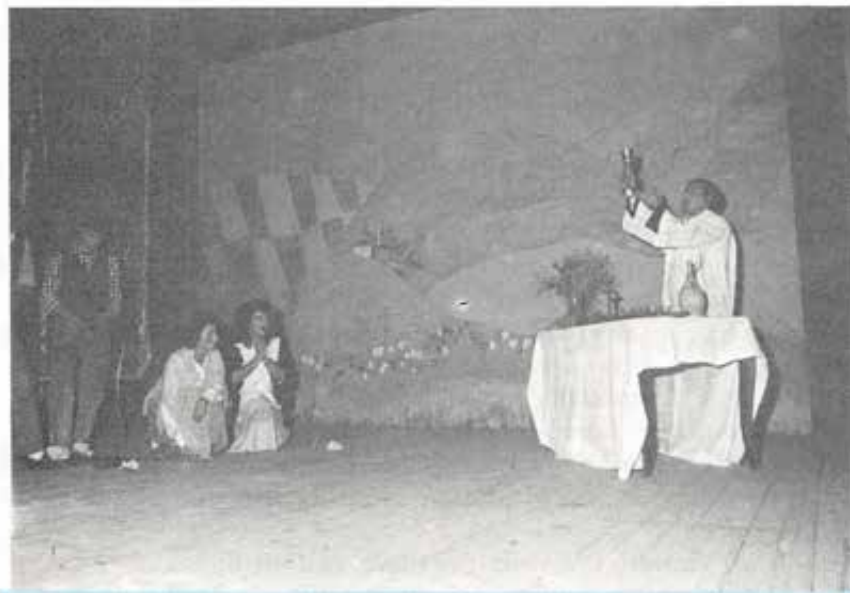
Don Bosco durante la prima Messa al paese natio, tra i contadini e la sua gente.

Ma sentiamo alcune riflessioni di Susy Mocerino stessa sul lavoro fatto. «Nel nostro musical il pensiero del Santo è esemplificato da alcuni episodi della