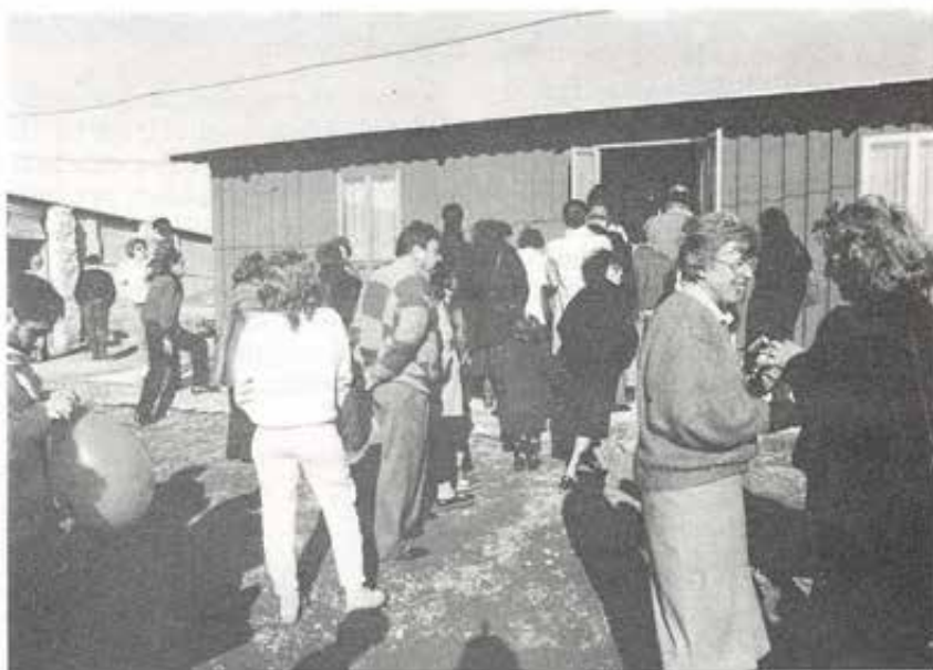
Visita ai nuovi locali di «Provvidenza 2»!

di accoglienza. Purtroppo non possiamo venir meno all'impostazione di tipo familiare della nostra comunità, trasformandola in un collegio; quindi cerchiamo di selezionare le richieste in base alle problematiche che i giovani portano con sé, alle loro effettive possibilità di inserimento, alle forze disponibili per se-