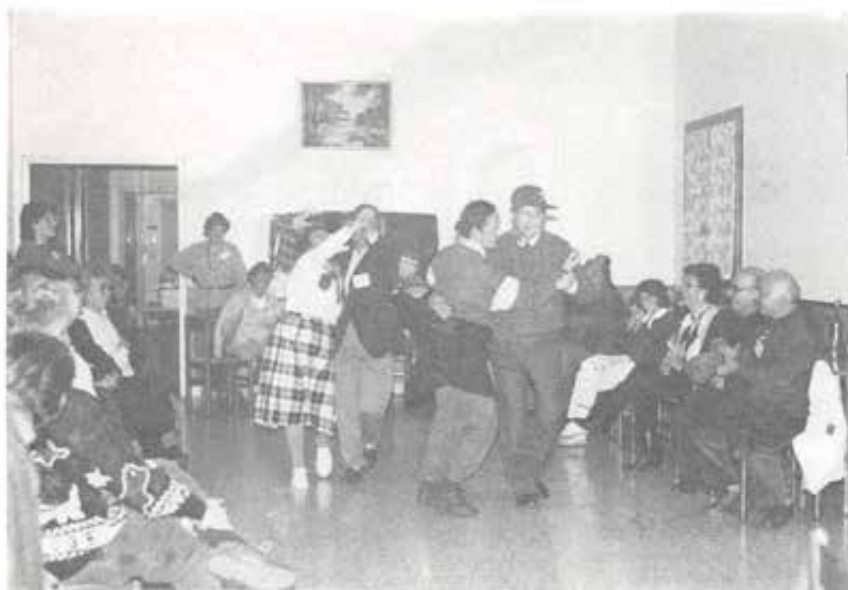
Arcinazzo (Roma) - «Incontri di Amicizia per famiglie» - È il momento della... festa!