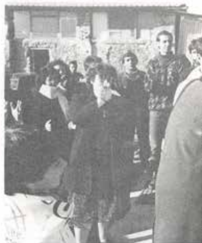
Il taglio del nastro dei nuovi locali.