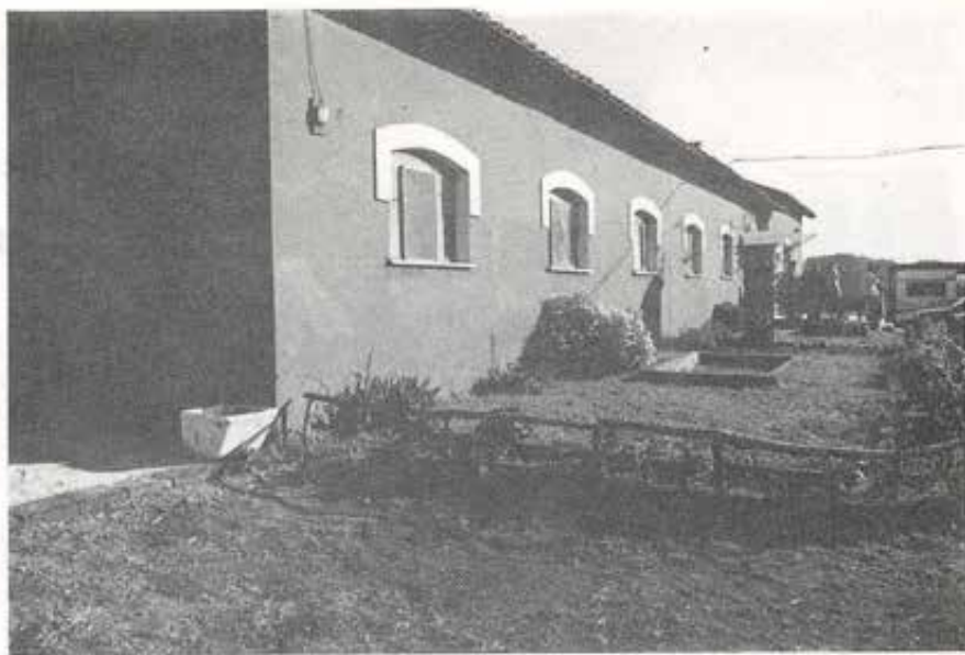
La casetta «Provvidenza»... rimessa a nuovo.

di accoglienza. Purtroppo non possiamo venir meno all'impostazione di tipo familiare della nostra comunità, trasformandola in un collegio; quindi cerchiamo di selezionare le richieste in base alle problematiche che i giovani portano con sé, alle loro effettive possibilità di inserimento, alle forze disponibili per se-