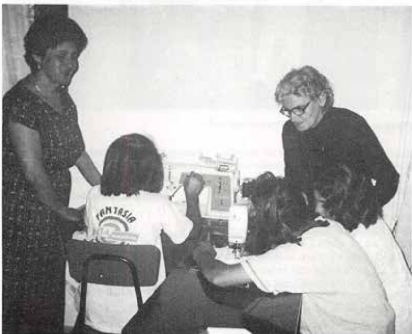
Arborea: Animatrici e oratoriane al Laboratorio «MM».

Speriamo, avendo quanto prima la definizione tecnico-finanziaria del progetto, di poter dare un contributo determinante a questa meravigliosa iniziativa nell'anno centenario di Don Bosco.