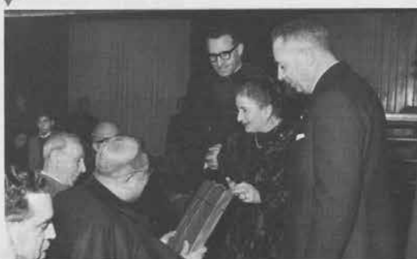
▲ Bari - L'arcivescovo mons. Nicodemo, dopo aver aperto un ciclo di conferenze sull'Apostolato dei Laici, riceve l'omaggio dei Cooperatori e degli Exallievi