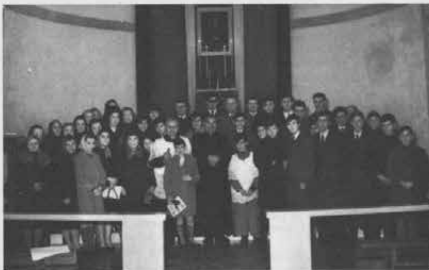
▲ Reda di Faenza (Ravenna) - Un bel manipolo di nuovi Cooperatori. Il Concilio ha detto che i giovani devono fare l'apostolato tra i giovani. La formula dei Cooperatori giovani, bene attuata, può corrispondere a questa esortazione della Chiesa