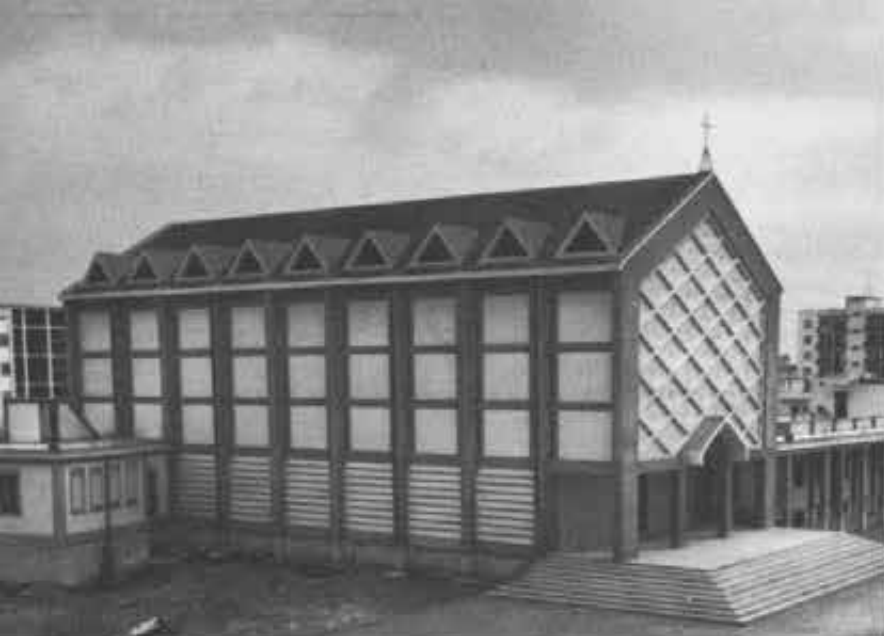
La nuova chiesa salesiana intitolata a Cristo Re, che sorge presso le opere giovanili, già parzialmente operante a Cerignola (Foggia)