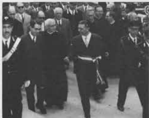
Minéo Il Rettor Maggiore accompagnato dal Sindaco e dalle altre autorità della sua cittadina

Fece visita anche alle Salette, altra opera di periferia. Lì nel 1922, giovane chierico, aveva fatto le sue prime esperienze oratoriane; erano stati tempi tristi: i monelli gli avevano lanciato sassi. Il suo ingresso alle Salette fu piuttosto movimentato. L'autista notò da lontano un assembramento, e da uomo pratico sentenziò: « C'è stato un incidente; dovremo