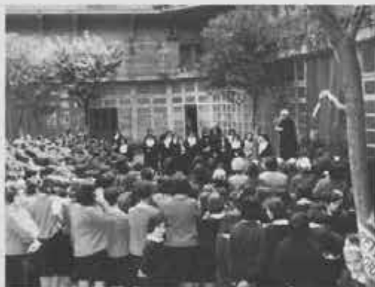
Palermo, Istituto Santa Lucia Il Rettor Maggiore si intrattiene con le allieve

di Azione cattolica, avevano vinto il primo premio catechistico nazionale, e in udienza speciale da Pio XI avevano ricevuto il gagliardetto dalle mani del Papa.