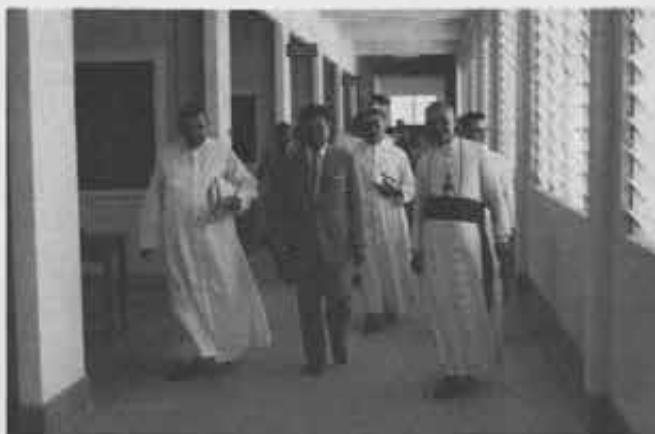
Mons. Carretto con le autorità inaugurano il nuovo edificio della Scuola di Haad Yai (Thailandia), una delle opere cattoliche che il Vescovo si preoccupa di disseminare attraverso la penisola con metodica regolarità

Me-Klong, trovò quattro case, una pagoda buddista e una segheria; il posto gli piacque e si fermò. Aveva una fede contagiosa: i pescatori del villaggio vollero anch'essi il battesimo. Dal 1857 un missionario si fermò stabilmente tra loro; costruì una chiesetta e una scuola di legno teck, acquistò i circostanti terreni incolti e si mise a disboscarli. Con i suoi neofiti lottò aspramente contro la foresta, ma alla fine vinse, e dove prima barrivano gli elefanti fece sorgere orti e piantagioni di noce di cocco.