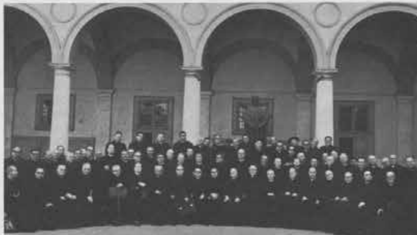
▲ Roma - Sacro Cuore - Convegno di Sacerdoti Cooperatori ed Exallievi