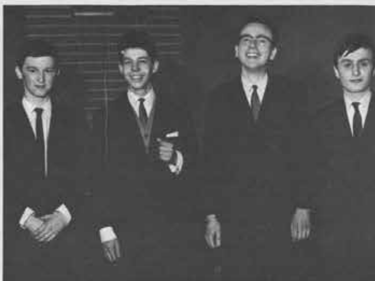
Apustolato dei mezzi di comunicazione sociale. Questi quattro allievi dell'Istituto Don Bosco di Woluwe-St.-Pierre, vincitori in una trasmissione della televisione belga dedicata ai giovani, si preparano a svolgere il loro apostolato in un settore dove urgono più che altrove gli apostoli laici

Immessi nella società , i laici lavoreranno a costruire una "cristianità" che non sia lontana dalle linee della "città celeste", a cui anche essa deve cooperare a condurre gli uomini. «L'impegno di informare dello spirito cristiano la mentalità e i