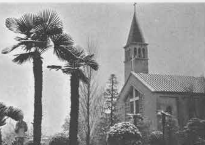
Tokyo-Shimoigusa. La parrocchia di Maria Ausiliatrice, una delle quattro parrocchie salesiane della capitale

La processione di Maria Ausiliatrice a Tokyo, nel rione di Akabane, dove le Suore di Don Bosco hanno la grande scuola "Seibi-Gakuen"