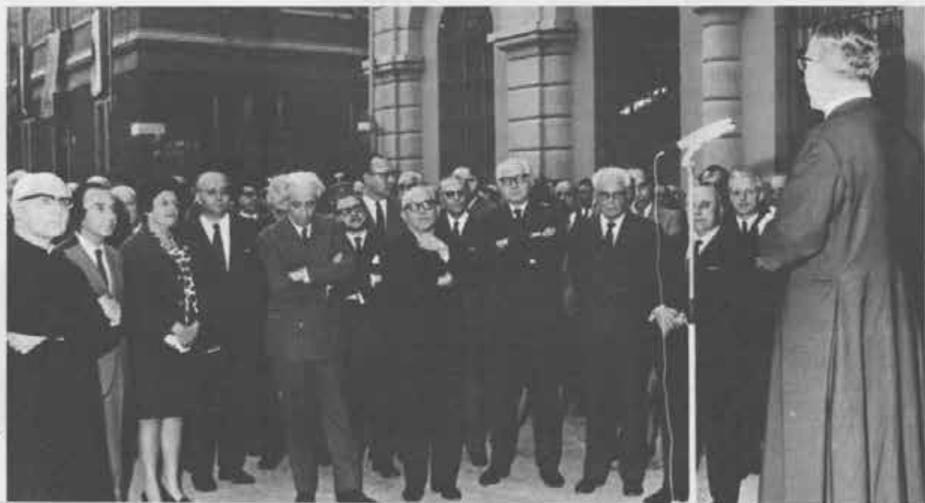
Autorità e personalità all'inaugurazione della Mostra del Centenario

La Mostra, mentre è una testimonianza delle realizzazioni passate, è insieme un affascinante invito a dare un'anima cristiana al mondo di oggi e di domani; e Don Bosco, per suo mezzo, lancia ancora alla società il suo messaggio giovanile.