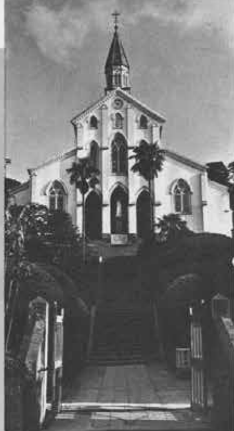
Nagasaki-Oura. La chiesa dei ventisei martiri. Davanti è visibile la statua della Vergine eretta a ricordo della scoperta dei cristiani