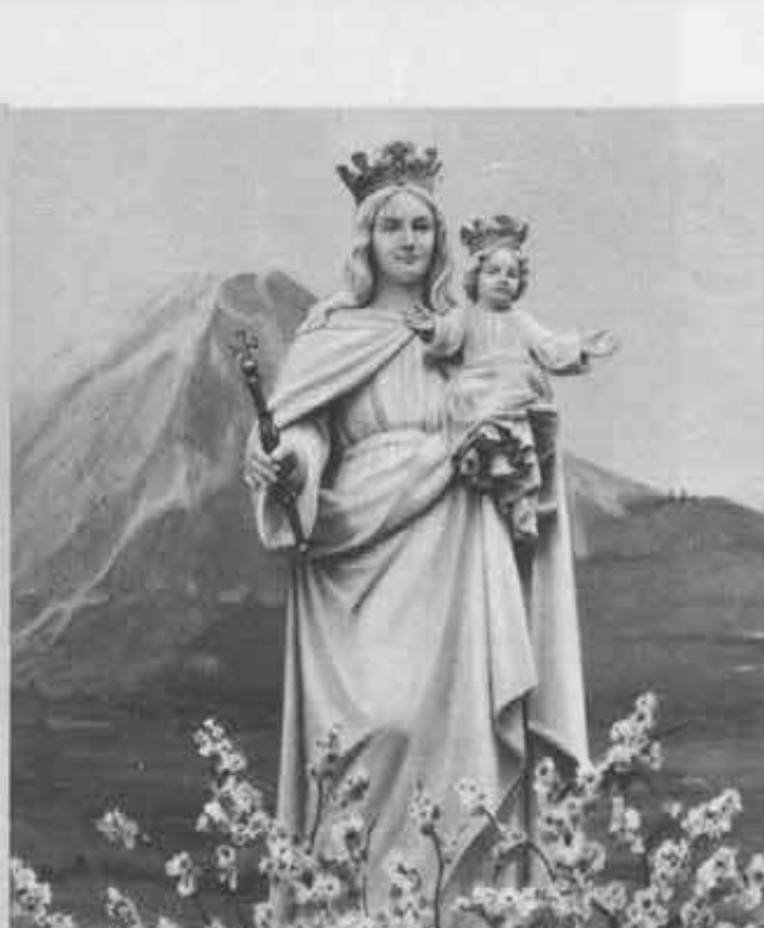
L'Ausiliatrice sul Fujiyama. Eretta a quota 1600, benedice le centinaia di migliaia di pellegrini che ogni anno salgono la montagna sacra

portato la salvezza a tante anime anche nell'Impero del Sol Levante.