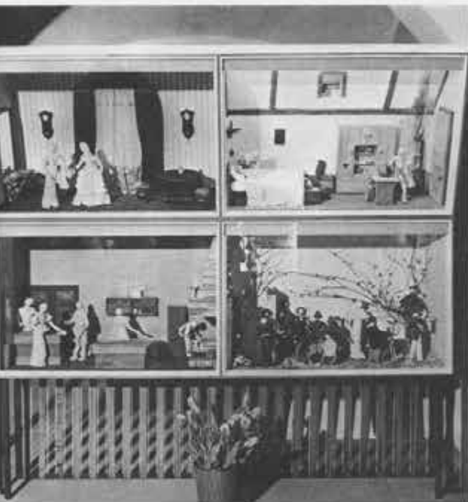
Don Bosco, prete con tutti e per tutti. Quattro quadri di vita: (sopra) a colloquio con la Marchesa Barolo — durante il colera del 1854; (sotto) Don Bosco stipula un contratto di lavoro per un suo ragazzo — passeggiata con i corrigeni della Generala