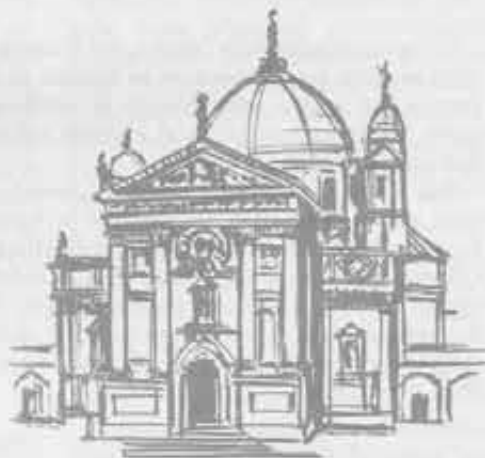
Basilica di Maria Ausiliatrice. Il Rettor Maggiore apre il centenario concelebbrando con 50 Ispettori salesiani convenuti dai cinque continenti