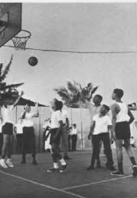
Per Don Bosco il gioco ha forza educativa; potenzia la vita associata, la confidenza con gli educatori, la formazione del carattere e il senso di responsabilità.

Molti ragazzi, molte ragazze, rispondono di no; alcuni di essi, per il senso religioso della loro vita, per i valori personali e l'apertura sociale a cui sono stati educati, sono condotti a voler impegnarsi in un « servizio speciale » in mezzo al Popolo di Dio, nell'apostolato laicale, nella vita religiosa, nel ministero sacerdotale.