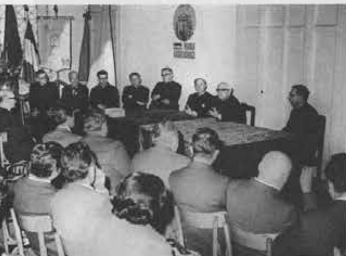
Il Rettor Maggiore ringrazia i Consiglieri nazionali ed ispettoriali dei Cooperatori del lavoro che svolgono, specialmente per la salvezza dei giovani