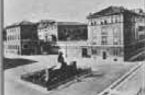
Torino - Casa Generalizia delle Figlie di Maria Ausiliatrice