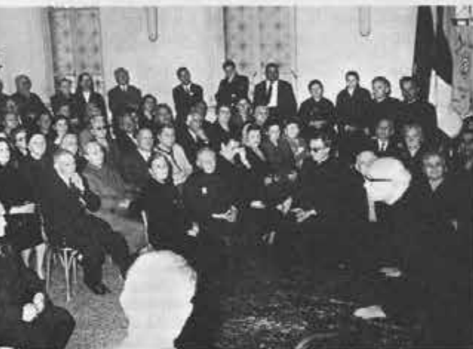
Incontro familiare con i genitori di Salesiani e di Figlie di M. A.: «La Congregazione — ha detto loro don Ricceri — deve a voi tutto, perchè le date gli uomini...»

consegna — concluse il Rettor Maggiore — che vi dà oggi la Vergine, la prima vera Cooperatrice di Gesù. Una triplice missione: missione educativa, missione evangelizzatrice, missione di immolazione».