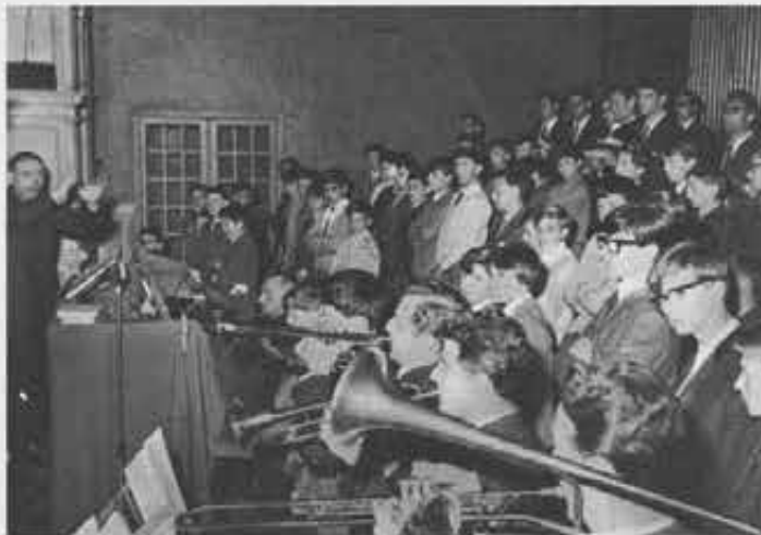
Le trombe del Colle Don Bosco hanno accompagnato alcune esecuzioni musicali tanto all'apertura del centenario (Scuola di Cumiana), quanto alla Messa del Pellegrinaggio Nazionale dei Cooperatori (Scuola del Colle Don Bosco)

Con questi sentimenti tutta la famiglia di Don Bosco raccolta stasera in questa Basilica, vero "cuore" della cittadella salesiana, canta il suo grazie alla Regina del Cielo, che riconosciamo Autrice della Storia Salesiana.