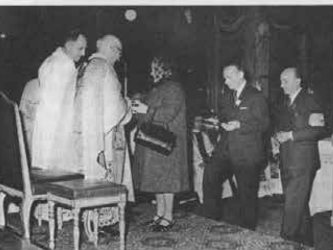
I rappresentanti dei Cooperatori di tutte le Ispettorie offrono doni al Rettor Maggiore per le più svariate necessità