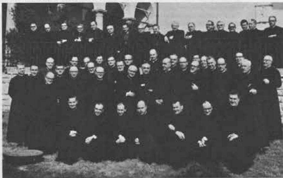
Ispettori salesiani d'Europa, Medio Oriente, Nord America, Australia, Africa, convenuti a Como per fare il punto sui primi risultati delle attuazioni del Capitolo Generale XIX

Il quadro d'interessi giovanili che si è presentato ai Superiori nei tre convegni è stato ricco e completo, perché ad esso sono confluite le esperienze fatte sul vivo e in contatto diretto coi giovani in tutti i paesi del mondo.