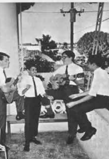
L'allegria si fa canto nelle voci e nelle chitarre di questi giovani aspiranti salesiani di Puerto Rico

Edizioni Cooperatori Salesiani - L. 800 Viale dei Salesiani, 9 - 00175 - ROMA