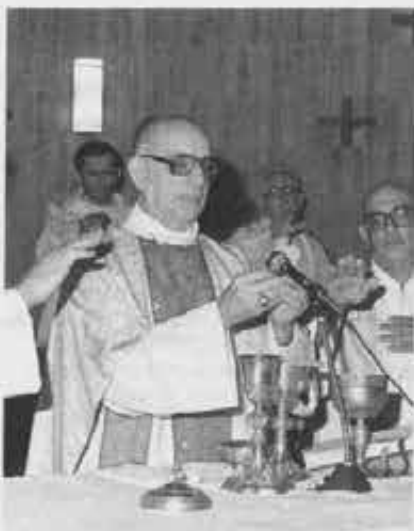
Nella foto: Mons. Rolon