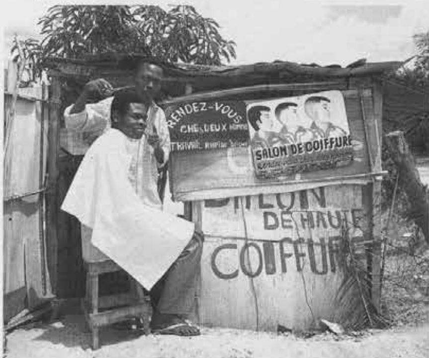
Un barbiere all'aperto a Kinshasa nello Zaire

D'altro canto, se pochi europei sapevano o mostravano di sapere qualcosa degli africani, questi ultimi, salvo rare eccezioni, «erano affetti da un'ignoranza ancora più profonda sul conto degli europei». Di qui l'ingenuità dimostrata da alcuni sovrani africani, che si ostinavano a pensare di poter trattare da pari a pari con i sovrani europei. Il re degli Ndebele, per esempio, non capiva perché la regina Vittoria non potesse stipulare un trattato direttamente con lui piuttosto che dare carta bianca a un suddito come Cecil Rhodes, il conquistatore della