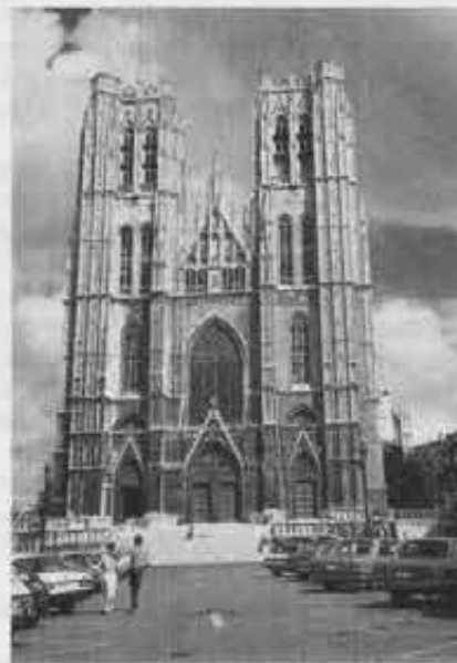
Bruxelles: la cattedrale gotica di Sainte Gudule

Il risultato è che migliaia di lavoratori fanno giornalmente la spola tra la provincia e la capitale per guadagnarsi la vita. Il centro è di-