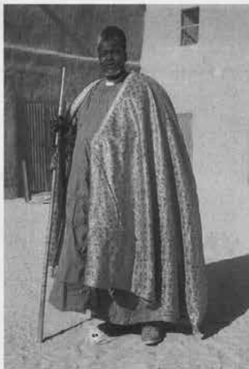
A sinistra: Donne al mercato in Costa d'Avorio e a destra un sultano del Niger

futura Rhodesia. Il re di Asante, a sua volta, sembrò supporre che gli interessi della regina Vittoria sul suo regno fossero gli stessi che nutriva nei confronti del regno della sovrana britannica, cosicché un pacifico accordo tra loro due avrebbe potuto regolare il comportamento dei rispettivi sudditi.