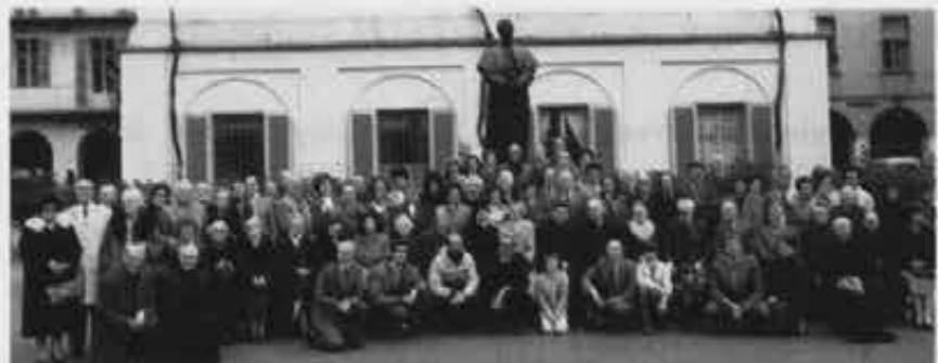
Nella foto: Il ricordo della Giornata

Dopo i saluti è cominciata la manifestazione messa a punto da diversi gruppi di giovani di Catania, Caltagirone, Ali, Palermo. I contenuti molto ricchi hanno avuto al centro la Sicilia, con le sue tradizioni, la sua religiosità, le sue speranze.