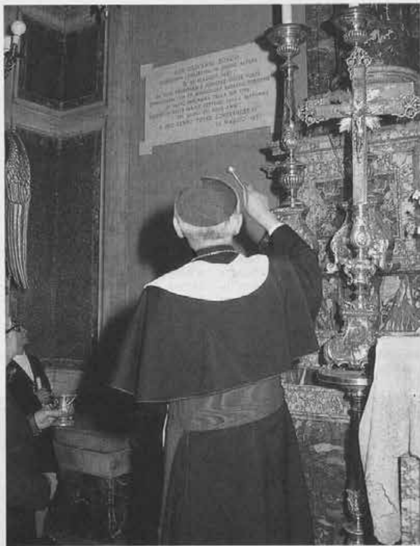
Sopra: il cardinale Ugo Poletti benedice presso l'altare dedicato a Maria Ausiliatrice la lapide commemorativa e sotto i giovani che con la loro presenza hanno allietato la manifestazione