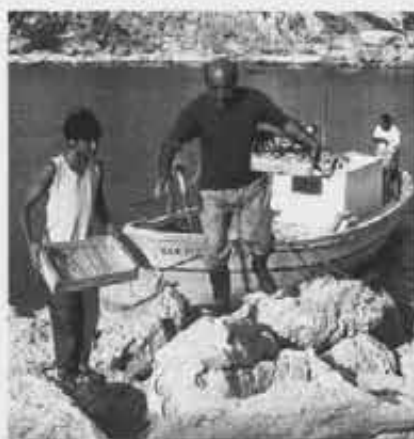
Una scena tratta dal film

È una prova molto dura per un adolescente. Ma non finisce lì. Il suo mondo, il mondo che lo circonda, sembra quasi non capire il suo gesto, non approvarlo, temerlo. Per troppo tempo la gente ha vissuto sotto il segno dell'omertà, ne ha assorbito i germi nell'aria stessa che respirava, ne è diventata succube. E il paese respinge Vincenzino. Saranno però i giovani, i coetanei di Vincenzino a rompere il circolo perverso e, uno dopo l'altro, si stringeranno attorno al ragazzo per testimoniargli solidarietà, appoggio, condisciplina.