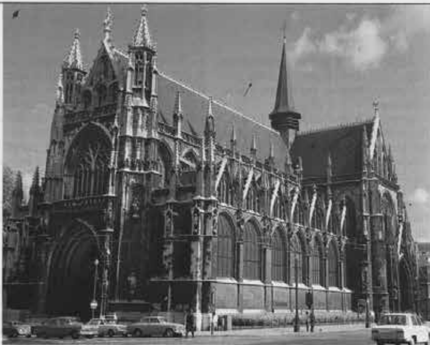
Bruxelles: la chiesa di Notre Dame du Sablon

Come conciliare, innanzitutto, attività parrocchiale e identità salesiana? È un primo aspetto della ricerca la cui difficoltà non va sottovalutata, perché si deve tenere nel giusto conto il problema rappresentato dall'età inoltrata dei fedeli delle tre parrocchie. La conseguenza del prevalere di una popolazione piuttosto anziana è la tendenza a concepire la figura del sacerdote e l'attività della stessa parrocchia in senso abbastanza statico e tradizionale, il che corrisponde ben poco al-