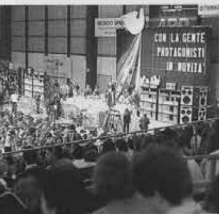
Nella foto: Un momento della manifestazione di Padova

Ma la festa di cui parliamo è stata anche una tappa importante sulla strada di una collaborazione sempre più intensa, imboccata dalle quattro Ispettorie Trivenete che amano definirsi «Il Quadrifoglio». Il confronto delle idee, lo scambio dei servizi, le articolazioni delle competenze, l'osmosi delle culture promette per il prossimo domani frutti ancora migliori di quelli di oggi.