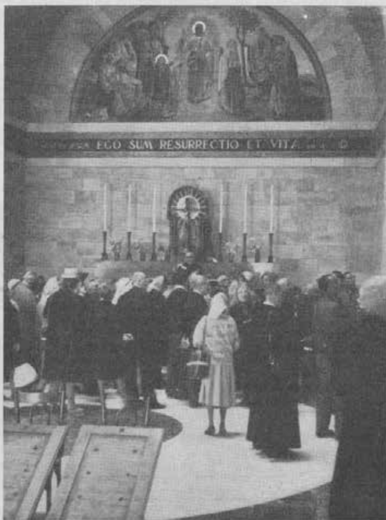
A Betania, nella Basilica che sorge presso la tomba di Lazzaro, a ricordo del grande miracolo della sua risurrezione.

◆ Il nostro ultimo saluto fu questo: «Chi va a Lourdes ci ritorna; chi va in Terra Santa ci lascia il cuore!».