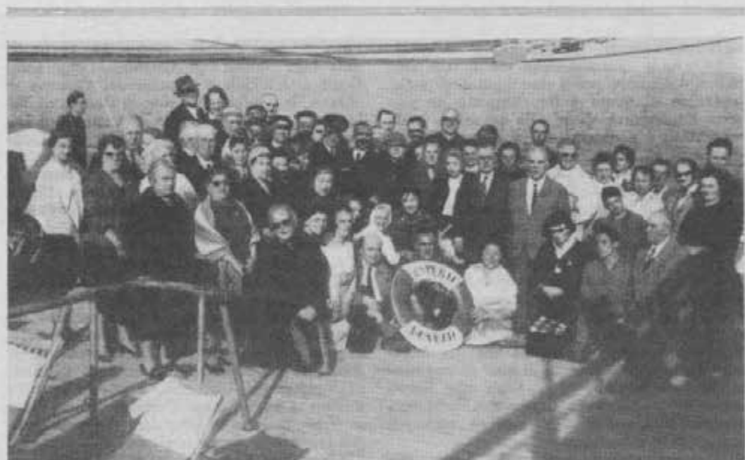
A bordo dell' 'Esperia' , in pieno mar Jonio, nel viaggio di ritorno.