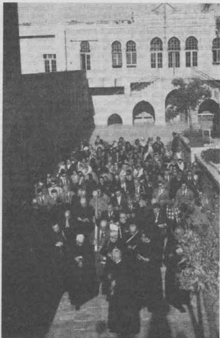
I pellegrini Cooperatori salesiani iniziano la grande Via Crucis, percorrendo lo stesso cammino percorso da Gesù Redentore.

Con la buona impressione di quell'incontro, scesero alla volta di Naplusa, per visitare il pozzo di Sichem, attualmente custodito dai Greci Ortodossi. Prima di scendere nella cripta ben conservata, sopra la quale sono le rovine di un tempio a tre navate costruito dai Crociati, Don Vignato parlò dello storico luogo promesso da Dio ad Abramo e lesse commentando il passo evangelico dell'incontro di Gesù con la Samaritana. Tutti vollero bere della fresca acqua del pozzo, stretto e profondo, col desiderio segreto di bere di quell'altra acqua