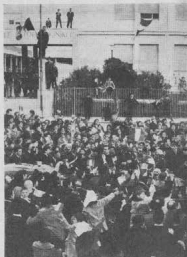
La domenica di Passione, il Santo Padre visitò la parrocchia trovò alcune migliaia di persone che lo attendevano come se il dove più di mille giovani della zona frequentano le scuole — quella del Sacro Cuore dei Padri Agostiniani e quella di lutava con le mani. Ricevuto un omaggio floreale dai giovani

In questo vasto disegno sta la spiegazione della risonanza dell'Enciclica; di una risonanza forse più vasta e più profonda nei circoli meno vicini alla Chiesa, che negli ambienti cattolici. Si domandano infatti gli acattolici, tra l'incuriosito e l'attonito, perchè la Chiesa abbia assunto un tono così significativo anche in questi settori sociali ed economici: essi vedono nell'Enciclica (che definiscono giustamente storica) non solo un documento redatto in termini chiari, precisi, ma soprattutto un fatto nuovo che va oltre le tradizionali raccomandazioni della carità e della giustizia. Il cattolico sa bene che nella Pacem in terris si compendiano i