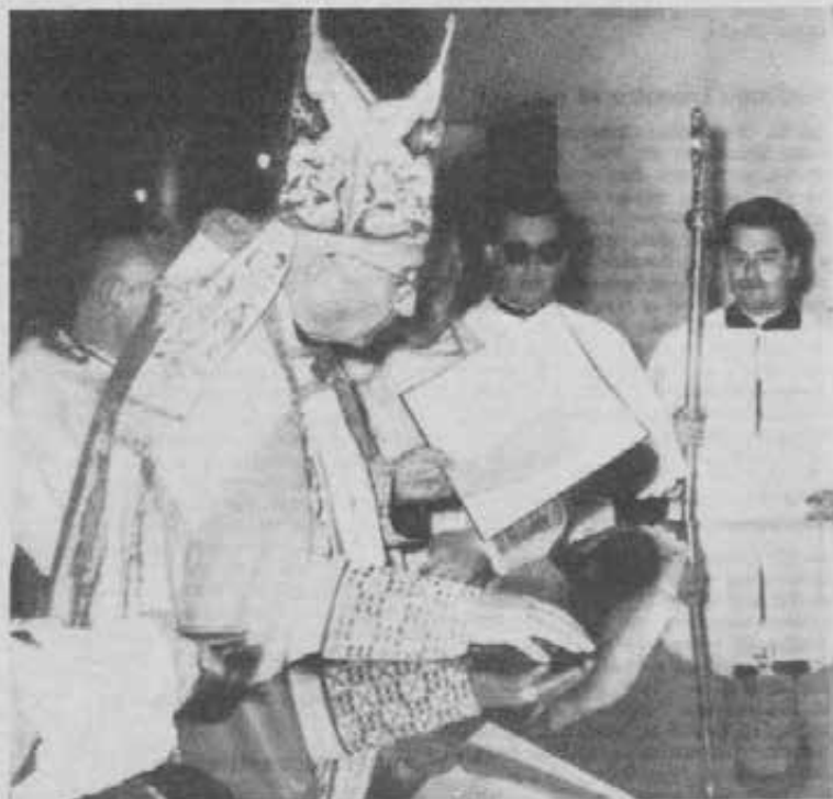
Valencia (Spagna) - S. E. Mons. Marcellino Olaechea, Arcivescovo di Valencia, consacra l'altare della nuova Parrocchia di San Giovanni Bosco.

A partire dallo scorso maggio il nostro Santo Fondatore vede pulsare nel suo nome un complesso di opere cattoliche che, nel pensiero dell'Arcivescovo, vogliono costituire l'attività di una parrocchia modello, capace di permeare di spirito cristiano tutti gli ambienti e strati sociali.