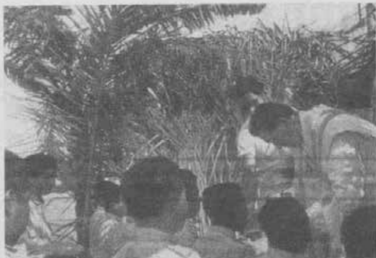
Santa Cruz (Bolivia) • I soldati, preparati dal Sacerdote salesiano, chiudono la novena "pro Concilio Ecumenico" con una fervorosa Comunione.

Quanto vivo è in questi cuori semplici il sentimento religioso!