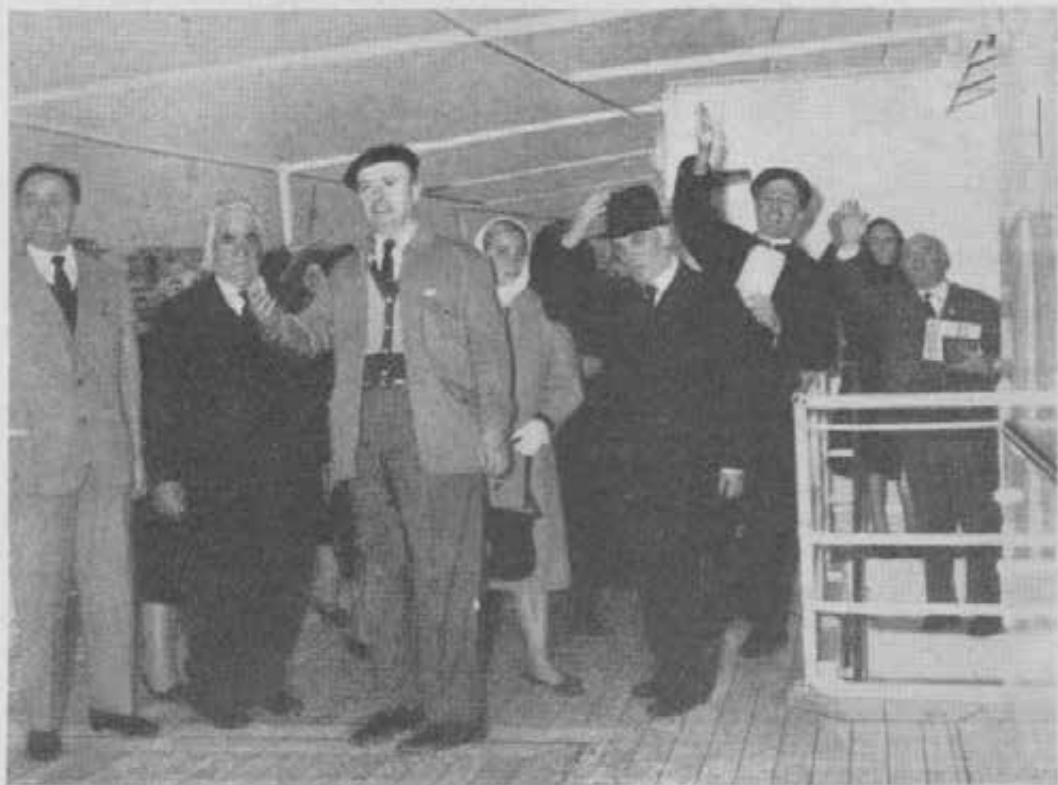
184 Dopo un viaggio felicissimo e ricco d'interesse, i pellegrini via mare sbarcano a Caifa.