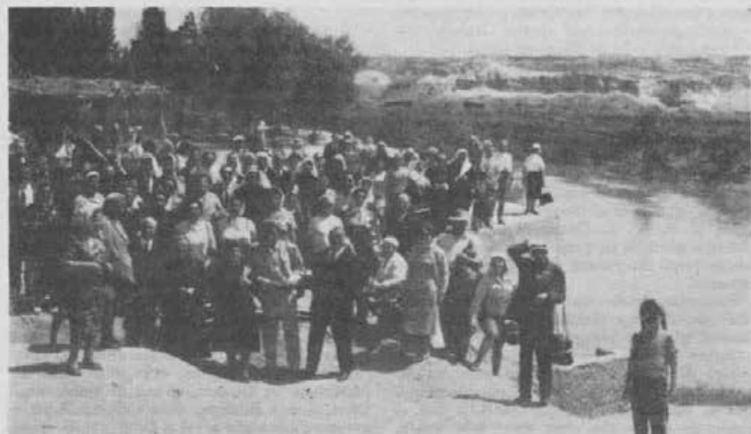
192 I pellegrini presso il Giordano, il fiume nel quale scese Gesù per farsi battezzare dal Precursore.

Sotto l'impressione dei più vivi contrasti passarono a visitare la chiesa della Dormizione, dove secondo un'antica tradizione c'era la casa in cui la Madonna visse dopo la risurrezione del Signore e si addormentò in Lui. Una bellissima basilica con marmi e mosaici. Fu quindi la volta di Ain Karem, villaggio sulle montagne di Ebron, dove la Madonna si recò a visitare Santa Elisabetta e dove nacque il Precursore San Giovanni Battista. Vi sono due chiese distanti circa mezz'ora l'una dall'altra: la prima, dedicata a San Giovanni Battista, corrisponde alla casa di San Zaccaria, dove nacque San Giovanni