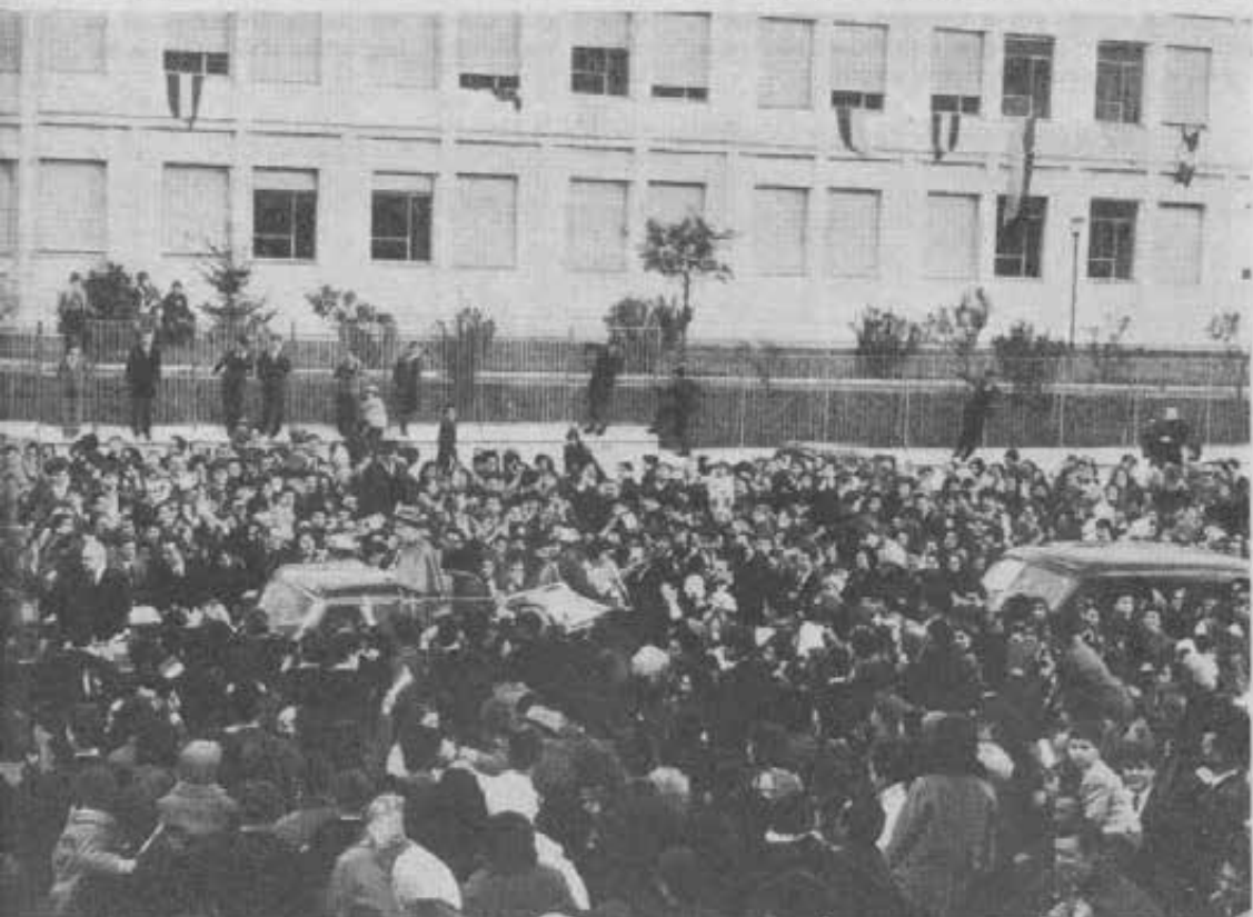
o San Basilio, nei popolosi quartieri orientali dell'Urbe. Attraversando la via Tiburtina, giunto all'altezza di Ponte Mammolo, Papa fosse andato là solo per essi. Una lunga sosta, quindi, davanti al grandioso Istituto Salesiano "Teresa Gerini", professionali. Alla vista del fitto stuolo di giovani coi loro insegnanti e fedeli delle due parrocchie di Ponte Mammolo San Domenico Savio dei Salesiani — il Papa si levò in piedi nella macchina scoperta e commosso e giulivo dall'Istituto Salesiano e acclamato calorosamente dalla folla, rivolse alcune paterne parole e impartì l'apostolica Benedizione.

Documento solenne, dunque, questa Enciclica, ma legato alla più pura tradizione evangelica della Chiesa, che ancora una volta, fidando nell'anelito comune di tutta l'umanità ai sommi valori spirituali — verità, giustizia, amore, libertà — accende una nuova speranza per tutto il mondo.