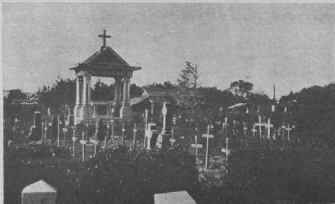
Miyazaki - Il Cimitero cattolico

gli si rade la capigliatura. Lo si lava con acqua calda prendendola ed effondendola colla mano sinistra. Il morto è vestito degli abiti del viandante, bastone, ombrello, la borsa del mendicante al collo, qualche alimento e qualche soldo ed oggetti a lui cari durante la vita.