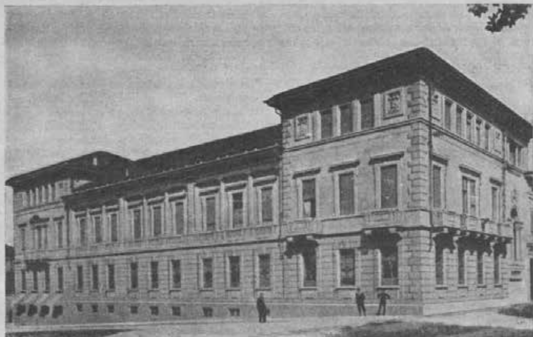
La sede centrale della S. E. I.