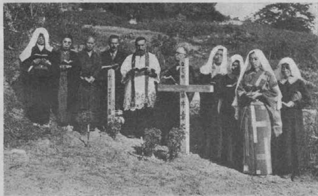
Reppu - Visita al Cimitero nel giorno dei morti.

Si inizia il corteo funebre. Anticamente si faceva verso sera e allora due uomini precedevano con torcie. Ora in generale si fa al mattino e rimane il ricordo della torcia col bruciare un rotolo di carta rossa affisso a un bastone davanti alla cassa. Due uomini precedono con scope (richiamo antico alla pulizia delle strada per cui passava il corteo). Seguono ornamentazioni varie, rami verdi, quattro gonfaloni, due bianchi e due gialli senza scritta (forse simbolo di vestimenta che anticamente si seppellivano col morto), le tavolette colle offerte, i suonatori di strumenti, nuovi gonfaloni come prima, i portatori di archi, frecce, lance, ecc., nuovi kannoshi, portatori di corone e fiori; il gonfalone bianco su cui è scritto il nome del defunto, la tavoletta col nome degli antenati e finalmente la bara, portata da quattro uomini; poi un uomo portante un'assicella, su cui è scritto il nome e le qualità del defunto, che sarà issata sulla tomba. Seguono la famiglia, parenti, amici, vicini.