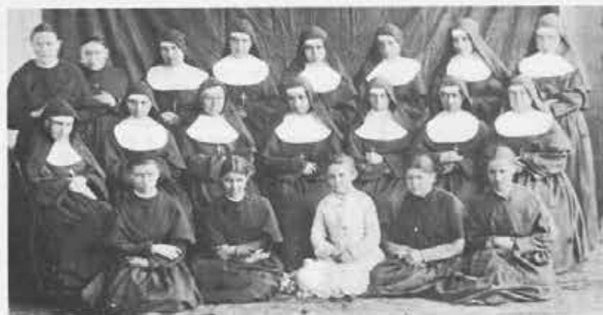
Nel 1879 altre FMA giungeranno, con la loro seconda spedizione missionaria, a Villa Colón: la foto le ha immortalate. Foto a destra: nel 1904 due paggetti portano le corone da collocare sul quadro di Maria Ausiliatrice, nella chiesa di Villa Colón appena ultimata.