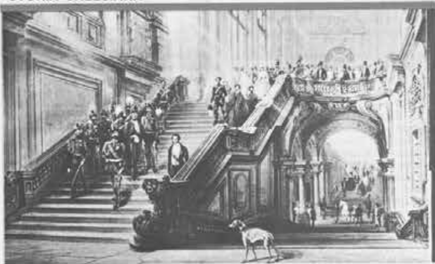
Scaloni di «Palazzo Madama», l'edificio torinese che ha visto tante vicende riorganizzative.