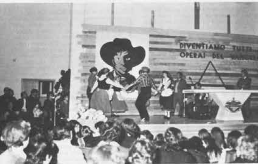
Recital in chiesa, per la partenza dei missionari: la «casa del Padre» diventa davvero casa dei figli nella misura in cui si riconoscono fra loro fratelli.

L'Ispettorato Adriatico da cui i tre si staccano è povera di vocazioni e non sa far fronte a tutte le opere che ha aperte in Italia. Eppure la decisione di andare a lavorare sulle Ande, dove il bisogno è estremo, è stata presa dai confratelli si può dire all'unanimità, come atto di piena fiducia nel «Padrone della messe» che a suo tempo manda gli operai.