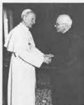
Servizio di copertina, pag. 4