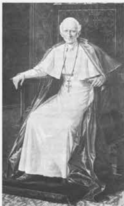
Leone XIII, Papa della Rerum Novarum .

messi a dormire in granaio); la storia successiva no.