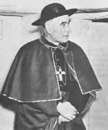
Il presente testo è un'omelia tenuta dal card. Raul Silva Henriquez, salesiano, che nel 1962 dopo un abboccamento con Papa Giovanni distribuí ai contadini poveri i terreni della sua diocesi.

uomini che siano come il lievito che trasforma tutta la massa. Ecco ciò che dobbiamo fare (...)