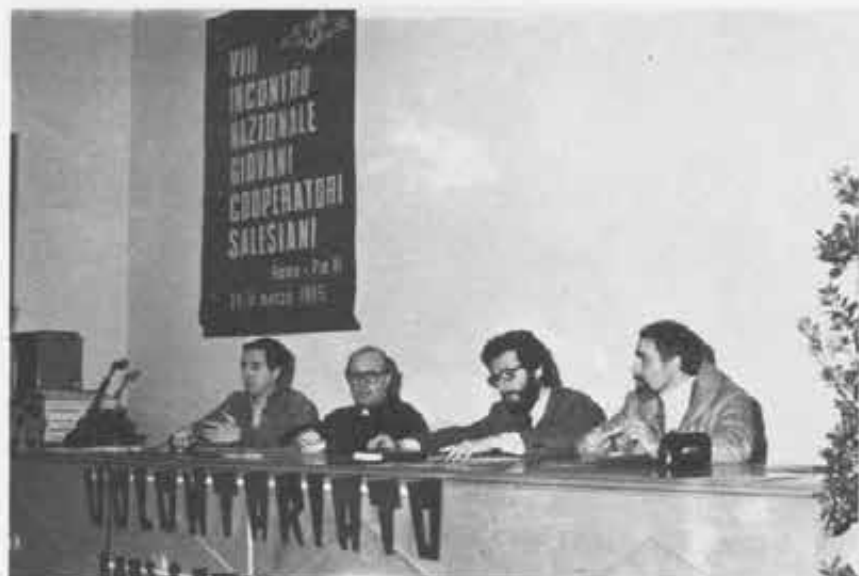
La Presidenza del Convegno GG.CC.