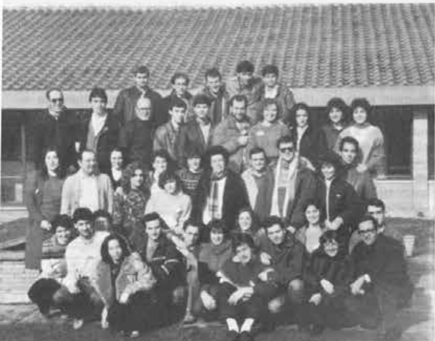
Arcinazzo - GG.CC. e simpatizzanti del Lazio a conclusione degli EE.SS.

cinazzo in un clima di preghiera e di intensa amicizia.