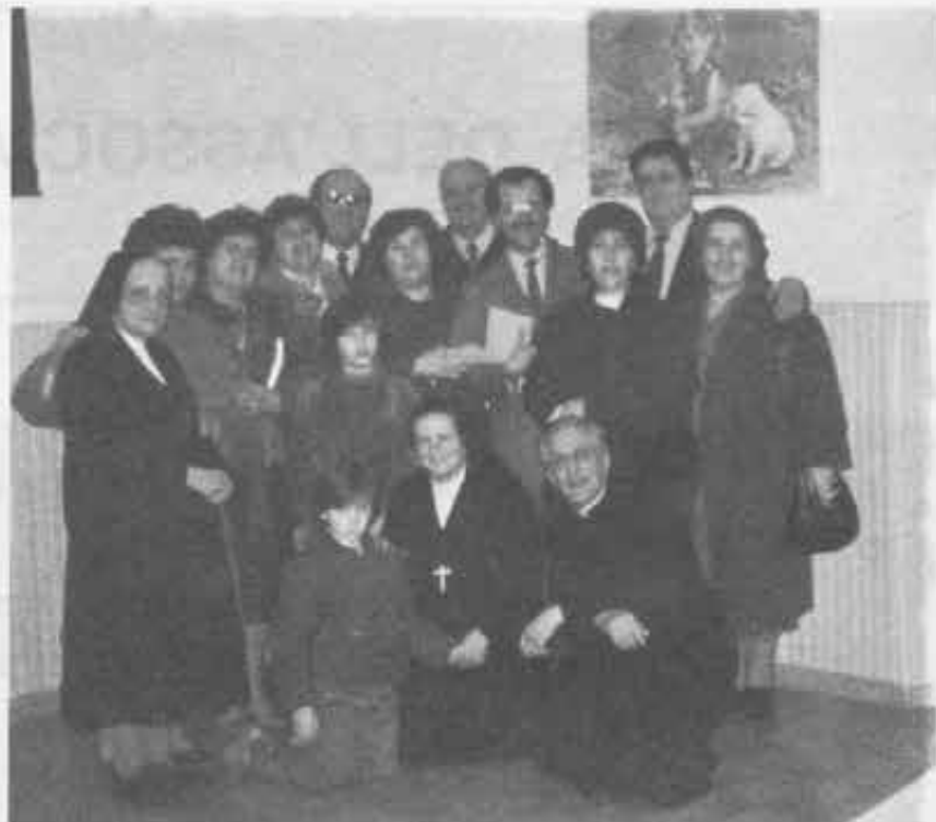
Marina di Pisa - Centro CC. locale in festa per le nuove Promesse.

Ai nuovi fratelli auguriamo di animare la realtà di oggi dello spirito dinamico di Don Bosco, della sua spiritualità realistica e del suo metodo educativo.