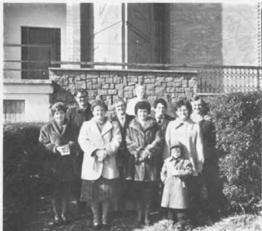
Orto Canavese - Gruppo dei Cooperatori della «Promessa».

dono che mi hai fatto di saper comunicare con i bambini: fa' fruttificare ancora questo talento per poter essere puro come loro nel difficile cammino della vita».