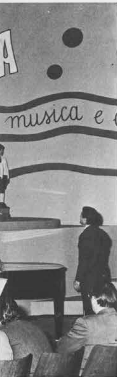
La musica dei ragazzi bisogna ascoltarla col cuore DON BOSCO

In un solo lustro questa manifestazione per ragazzi, nata in sordina al Centro Giovanile Salesiano di Padova, ha saputo affermarsi come una delle iniziative più nuove, giovani e utili del mondo dei nostri figli, conquistando vastissime simpatie e unanimi consensi. Possiamo augurarci che l'iniziativa, ricca di serena letizia e altamente educativa, sia realizzata da altri giovani più adulti?