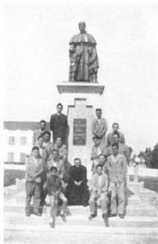
TUPA (Mato Grosso).