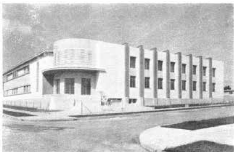
VIBORA-HABANA (Cuba) - Una prospettiva del nuovo Istituto Salesiano.

I confratelli hanno trovato un provvidenziale alloggio presso ottimi Cooperatori. Potranno in seguito occuparsi anche dell'istruzione e direzione religiosa della grande Scuola professionale cattolica del centro della città, che conta circa novecento alunni.