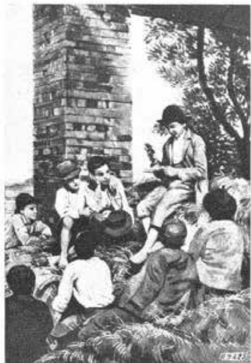
Giovanni Bosco fanciullo, che fa il catechismo ai ragazzi dei Becchi.

1) Un complesso di 170 autori ha lavorato nella compilazione di 351 pubblicazioni catechi-