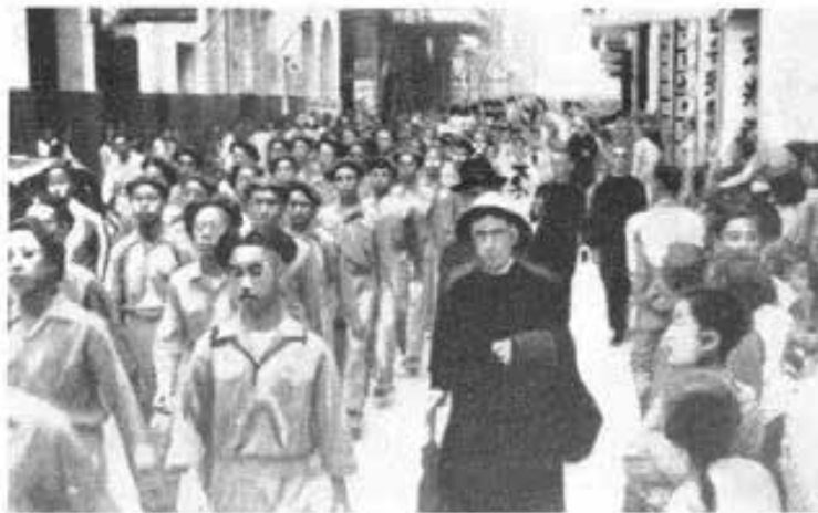
HONG KONG - Festeggiamenti ad onore del B. Domenico Savio. Arrivo dei Collegi

di triduo. Le feste si chiusero con una riuscita conferenza tenuta da don Fasulo, la sera della domenica, nella chiesa nuova, gremita da una folla imponente, che seguì con religioso raccoglimento e con visibile interesse la parola dell'oratore.