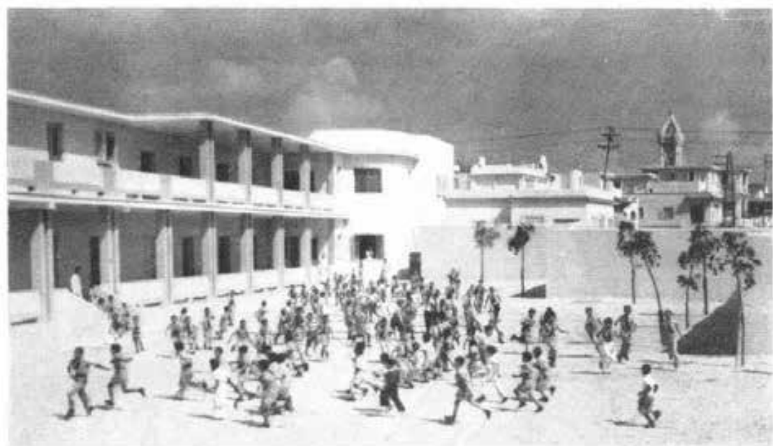
VIBORA-HABANA (Cuba) - Interno del nuovo Istituto Salesiano.

Il 3 giugno u. s. si è inaugurato ufficialmente il nuovo padiglione a due piani della nostra scuola tecnica. Alla cerimonia intervenne lo stesso Borgomastro di Leusden sig. Kwint, che tagliò il nastro e si disse molto lieto della collaborazione, che va constatando tra Scuola e autorità, allievi