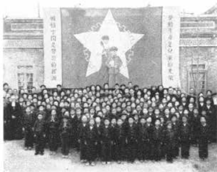
PERINO (Cina) - I nostri giovani all'inizio del Triduo ad onore del B. Dom. Savio.