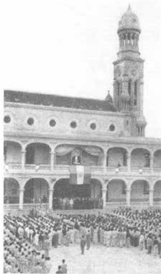
LIMA - Omaggio degli Allievi al Beato Domenico Savio.