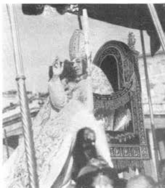
Il Santo Padre benedice.

Così abbiamo fatto in passato. Così faremo in futuro, finché al divino Fondatore della Chiesa piacerà di lasciare sulle Nostre deboli spalle la dignità e il peso di supremo Pastore.