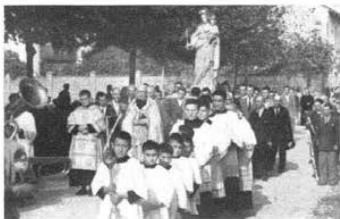
BELLINZAGO NOVARESE - Processione di Maria Ausiliatrice, in occasione dell'inaugurazione del tempio a lei dedicato.

Stavo sperimentando una stufa elettrica di forte potenza, e tutto andava bene, quando, per evitare il riscaldamento del tavolo, spinai lo strumento verso la destra. Mi trovai istantaneamente preso dalla corrente con la mano sinistra attaccata alla stufa senza possibilità di staccarmela per quanti sforzi facessi ed in pochi istanti perdetti completamente le forze; le gambe più non mi sostennero, caddi all'indietro, sempre attaccato alla stufa. Ma la Vergine era presente per salvarmi, poiché avevo un bel quadro di Maria SS. appeso all'armadio, e cadendo all'indietro, andai a urtare con la testa contro di esso. Con tutta la voce e col cuore mi rivolsi a lei, perché mi aiutasse. Fu un attimo. Benché già non vedessi