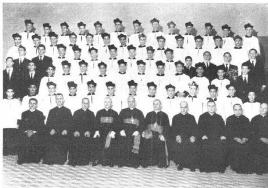
S. PAULO (Brasile) - I nuovi novizi delle nostre Ispettorie di S. Paulo e Rio de Janeiro attorno a S. E. Mons. Ernesto De Paula, Vescovo di Piracicaba, ed ai nostri Eec.ri Mons. Massa, Prefato di Rio Negro, e Mons. Domitrovitch suo Ausiliare, consacrato il 19 marzo u. s. dal Nunzio Apostolico nel nostro santuario del Sacro Cuore

nel nostro bel teatro dal Ministro degli Esteri Sig. Orazio Walker, alla presenza del Cardinale Arcivescovo di Santiago, del Ministro dell'Educazione, del Presidente della Suprema Corte di Giustizia, del Presidente della società economica italiana, del Presidente nazionale dei nostri ex allievi, di oltre 1000 giovani del nostro Istituto ( Gratitud Nacional ) e dei nostri studenti e filosofi.