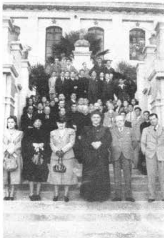
EQUATORE Festa del Beato Domenico Savio. Cooperatori e Cooperatrici.

La settimana commemorativa ebbe inizio con