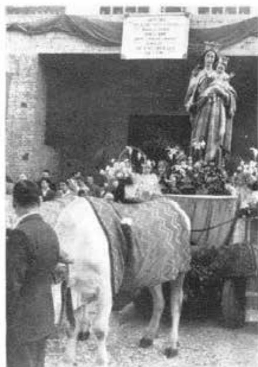
BRESCIA - Festa di Maria Ausiliatrice. Il carro della Madonna per la processione.

Fu allora che il sottoscritto (e come poteva agire diversamente?) suggerì, all'ammalato ed ai familiari assistenti, il ricorso a Maria SS. Aiuto dei cristiani mediante una Novena e quindi l'applicazione all'inferno della medaglia tanto consigliata da San Giovanni Bosco, in simili frangenti.