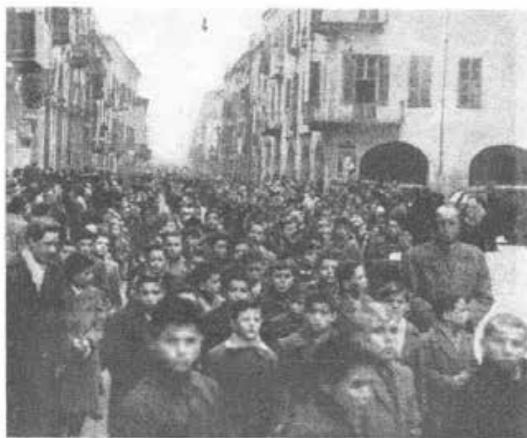
FOSSANO - Festeggiamenti ad onore del Beato Domenico Savio.