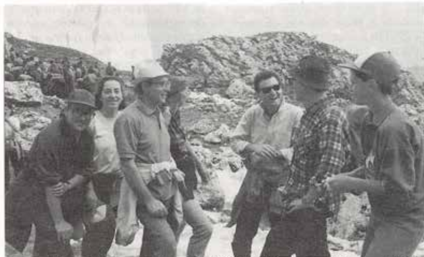
...tra una lezione e l'altra, una faticosa ESCURSIONE! E giunsero al rifugio tutti felici e contenti!