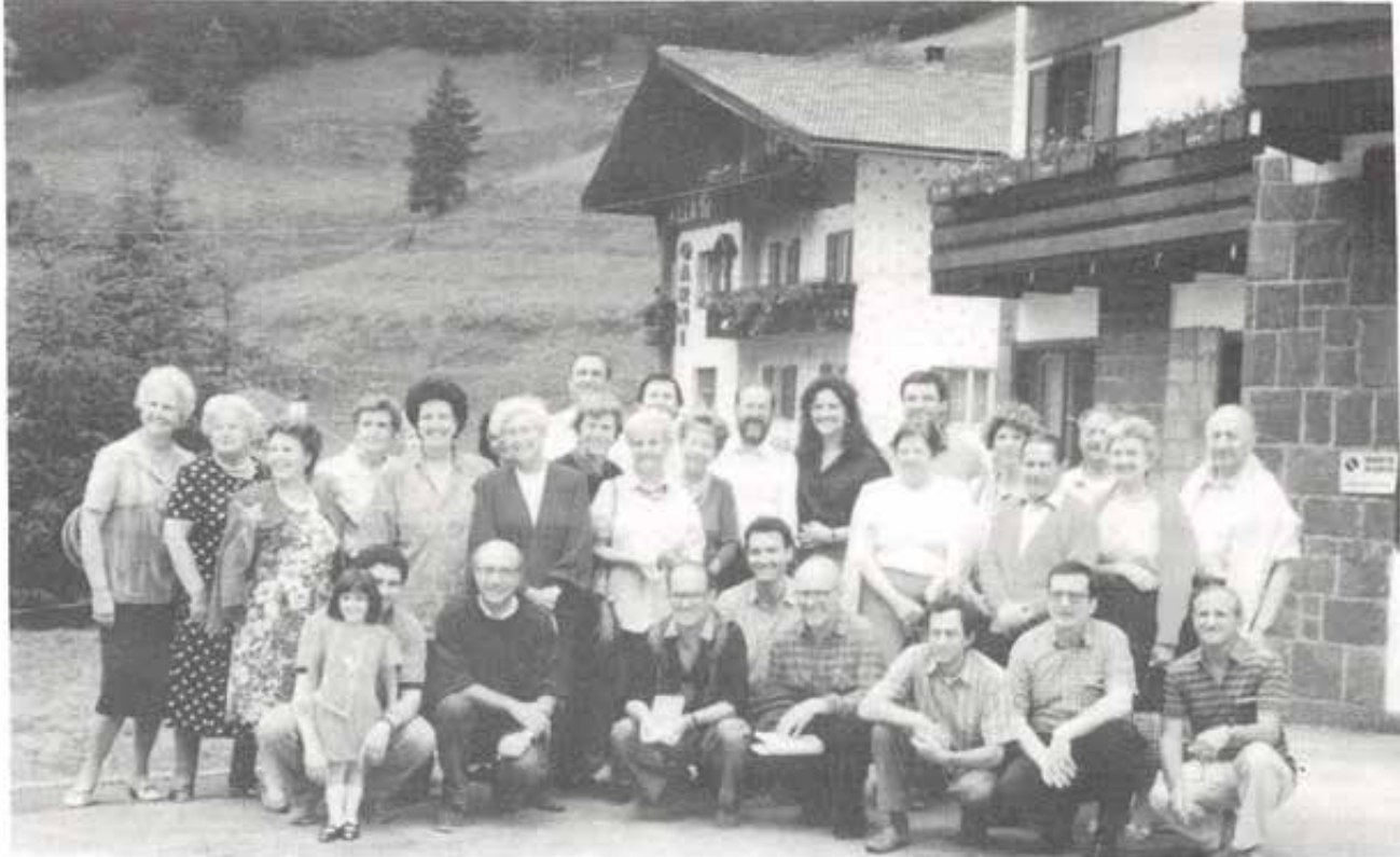
FONTANAZZO (TN) - Insieme sorridenti... dopo la scuola!