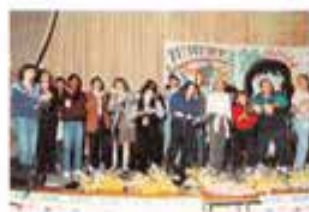
Il gruppo organizzatore

È difficile circoscrivere e comprendere in pieno il fenomeno delle nuove religiosità, che sta assumendo dimensioni inusitate con pesanti conseguenze psicologiche e sociali, soprattutto per i giovani, data la loro naturale partecipazione e fragilità emotiva verso esperienze così totalizzanti. Don Eugenio Fizzotti (UPS) coadiuvato da autori di studi specializzati sui singoli fenomeni e con l'ausilio di circostanziati documenti audiovisivi, ci ha fatto prendere coscienza della vastità e della varietà di questo universo, proveniente in gran parte dall'estero (USA, Messico, India, Corea), iniziando alle prime chiavi di lettura e differenziazioni. Si è vissuta in pieno la difficoltà di sentire urgentemente nostro questo problema per le difficoltà e il linguaggio "da iniziati" necessari per definirlo e, probabilmente, per il nostro abito mentale pratico, poco avvezzo a questi viaggi dentro sé stessi o verso inquietanti trascendenti. E tuttavia con impegno ci sia-