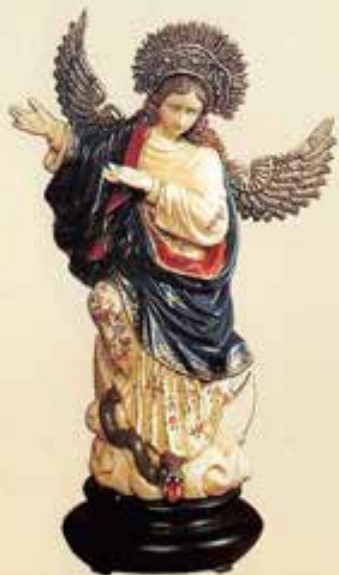
Ecuador. Assunta di Quito (Torino, Centro Salesiano di Documentazione Mariana).