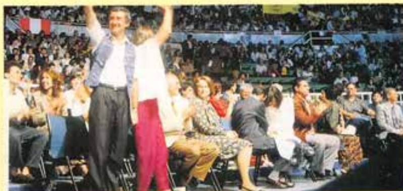
Un momento del «FAMILYFEST '93» al Palaeur di Roma. Il servizio fotografico di queste pagine fa riferimento al multicongresso internazionale del giugno scorso e trasmesso in mondovisione via satellite.

b) Coloro che desiderano sposarsi e formare una famiglia hanno il diritto di attendersi dalla società quelle con-