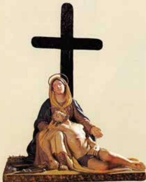
Torino. La Pietà (Centro Salesiano di Documentazione Mariana).

domenica lunedì martedì mercoledì giovedì venerdì sabato