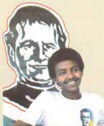
Don Bosco in Etiopia.

domenica lunedì martedì mercoledì giovedì venerdì sabato