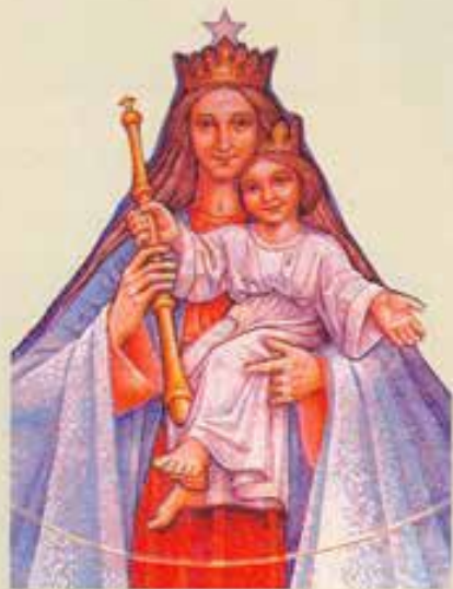
Cile, Maria Auxiliadora di La Florida (Santiago).