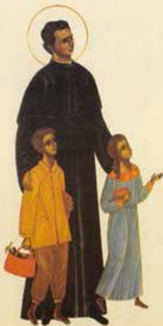
Don Bosco di Betlemme.