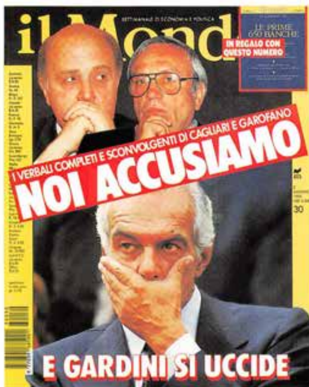
La copertina di un settimanale economico che riassume i drammi socio-politici e personali del nostro tempo.

senso contrario all'antieriore, è quello dell' avviso di garanzia ; i mezzi di comunicazione sociale ne hanno, in qualche modo, sfigurato la funzione; dovrebbe incamminare alla ricerca della verità, ma più d'una volta serve a ben altro. Anche qui le pupille di Dio non giudicano secondo le apparenze, ma con giustizia e diritto. Speriamo di accorgercene a tempo e di vedere con più oggettività le responsabilità delle persone. Evitiamo di fare di questi