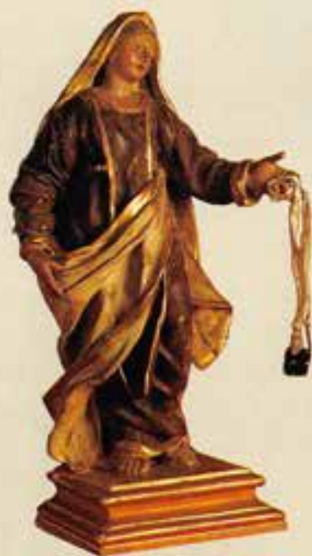
Torino. N.S. del Carmine (Centro Salesiano di Documentazione Mariana).

domenica lunedì martedì mercoledì giovedì venerdì sabato