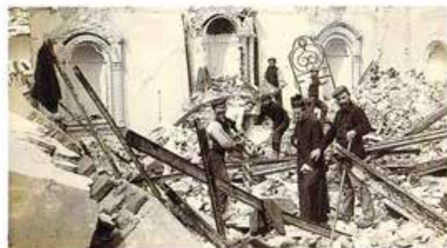
Messina. La chiesa dell'Istituto S. Luigi dopo il terremoto del 1908.

1908, che mise in ginocchio la popolazione: 80 mila vittime dei 172 mila abitanti. Tra le macerie rimasero sepolti anche nove salesiani e 42 ragazzi. La ripresa fu difficile, e l'oratorio fu fatto in baracche di legno. La nuova sede, su disegno del Valotti, fu inaugurata nel 1929, e da allora ospitò moltitudini di giovani dai vari quartieri. Nel 1916 e nel 1923 il San Luigi fu visitato anche dal beato don Rinaldi. Don Giuseppe Riggi scrive che a Messina, dinanzi a tante giovinette incontrate al San Luigi, don Rinaldi abbia esclamato: «Ora ho scoperto la Sicilia! La Sicilia che Don Bosco aveva visto in uno dei suoi sogni profetici. La Sicilia che in una delle sue istituzioni giovanili, il San Luigi di Messina, continua a essere onorata».