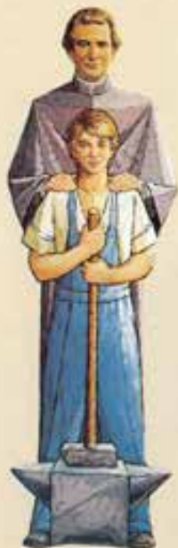
Don Bosco patrono degli apprendisti.