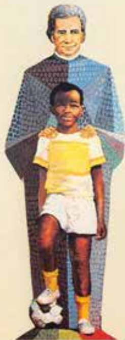
Don Bosco tra i ragazzi d'Africa.

domenica lunedì martedì mercoledì giovedì venerdì sabato