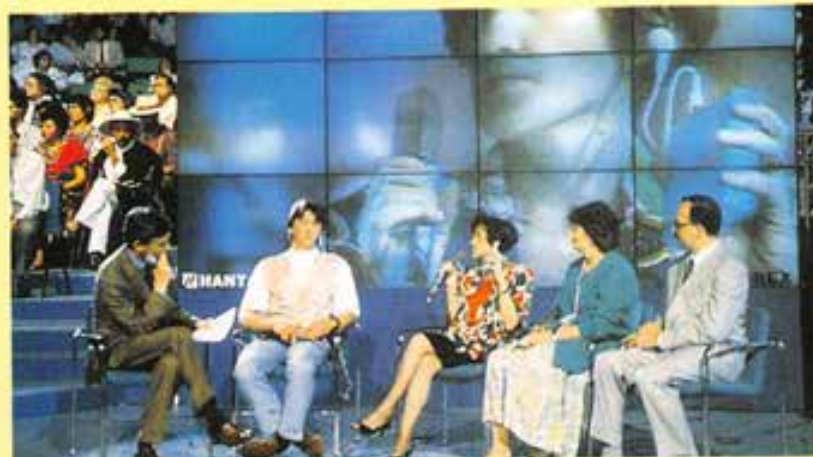
Roma, «Familyfest '93». La testimonianza dei rappresentanti della ex-Jugoslavia.

b) Le famiglie hanno diritto a misure nell'ambito sociale che tengano conto dei loro bisogni, specialmente nel caso di morte prematura di uno o di entrambi i genitori, di abbandono di uno dei coniugi, di incidente, di malattia o di invalidità, nel caso di disoccupazione, e ogni qual volta la famiglia abbia da sostenere oneri straordinari a favore dei suoi membri per ragioni di anzianità, di handicaps fisici o mentali o dell'educazione dei figli.