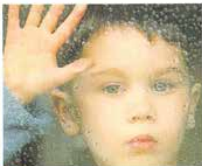
I bambini di fronte ai grandi interrogativi della vita.

La comparsa in libreria di un libro colorato e malinconico intitolato «Tommaso e l'infinito», destinato ai bambini dai nove anni in poi, che racconta la favola della «buona morte», ha suscitato dibattiti e discussioni sui giornali e sui teleschermi.