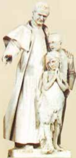
Roma. Don Bosco, padre e maestro dei giovani. Basilica di San Pietro (Pietro Canonica).