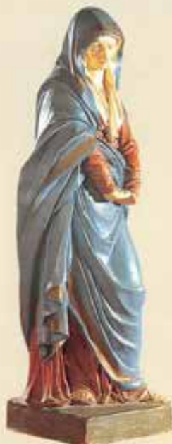
Faenza. Addolorata (terracotta del sec. XVIII. Torino, Centro Salesiano di Documentazione Mariana).