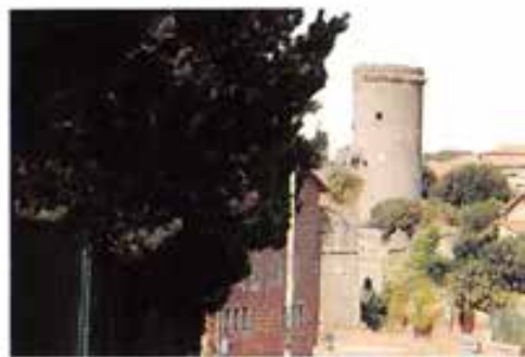
Panorama di Nepi, con la cattedrale e la torre della città.

Cresciuto in una famiglia di solidi principi cristiani, a otto anni ricevette la cresima e a dieci fece la prima comunione. Subito dopo il parroco gli benedisse l'abito clericale, onde potesse entrare nel seminario minore di Seveso. Durante il corso di teologia al seminario maggiore di Milano, poté godere dell'impareggiabile direzione spirituale di don Pasquale Morganti, futuro vescovo di Bobbio e arcivescovo di Ravenna. Don Morganti era un innamorato di Don Bosco. Già allievo dell'Oratorio di Valdocco, affezionatissi-