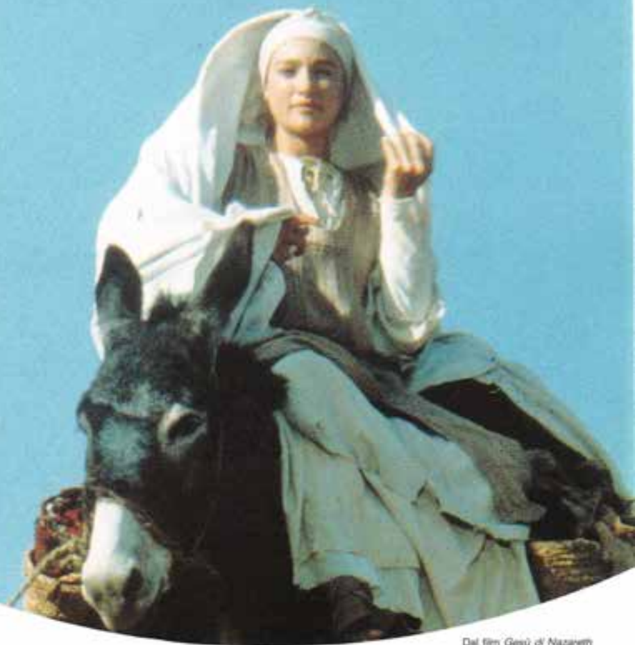
Dal film Gesù di Nazareth