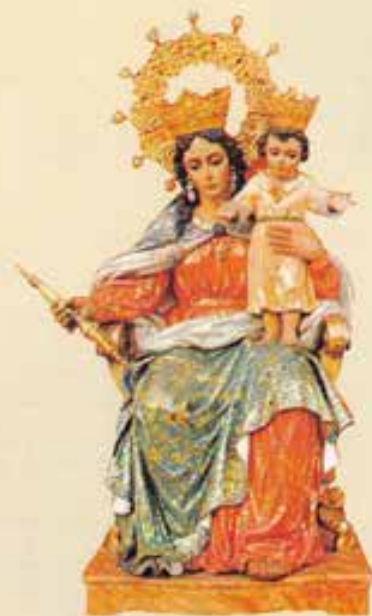
Spagna. Maria Auxiliadora di Triana (Sevilla).