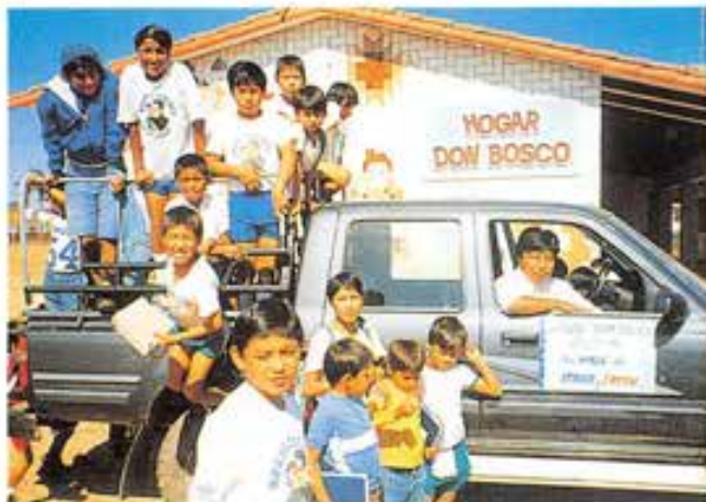
Santa Cruz. L'indispensabile «vagoneta», che gli amici del «Gruppo Bolivia» dell'Astori hanno donato all'Hogar Don Bosco.

L'estate scorsa sono partiti per la Bolivia sette periti meccanici neodiplomati. Quest'anno un secondo gruppo è partito per la stessa destinazione. Si tratta di altri sette studenti dell'Astori che guidati da due volontari adulti, un tecnico polivalente e due docenti della scuola, si sono recati all'orfanotrofio Don Bosco di Santa Cruz con un preciso piano di intervento: continuare la sistemazione dell'edificio nell'impianto elettrico e idraulico. E hanno fatto oratorio e doposcuola ai duecento ragazzi ospiti, che nel corso dell'anno scolastico sono stati "adottati a distanza" da molte famiglie degli allievi di Mogliano.