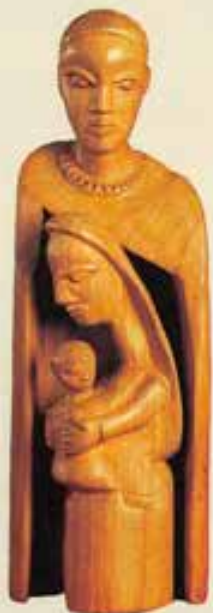
Nigeria. Santa Famiglia.