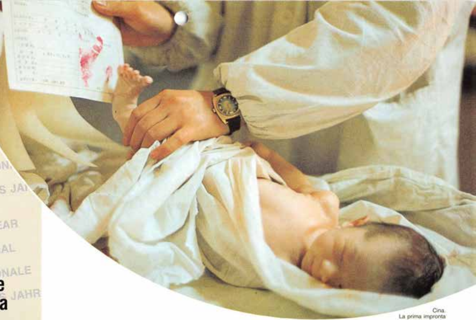
Cina. La prima impronta della vita

INTERNATIONAL YEAR OF THE FAMILY AÑO INTERNACIONAL DE LA FAMILIA ANNÉ INTERNATIONALE DE LA FAMILLE INTERNATIONALES JAHR DER FAMILIE