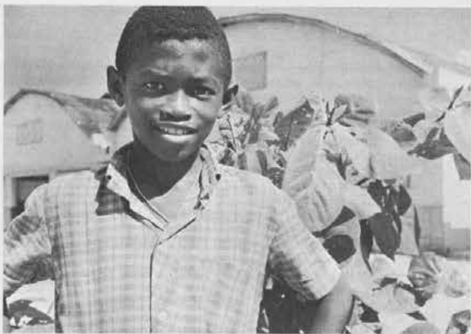
Un ragazzo di Belem. Sullo sfondo l'opera salesiana alla periferia della città.

Subito dopo sul teleschermo si videro ragazze e giovanotti muoversi svelatamente di casa in casa. I ragazzi portavano sulle spalle grossi sacchi, le ragazze ricevevano dalla gente oggetti: scarpe, biancheria, medicine. Una bambina offrì con un sorriso una delle sue due bambole. Intanto una voce fuori campo scandiva: «Questi sono i giovani del Movimento Emmaus, lanciato dalla Re-