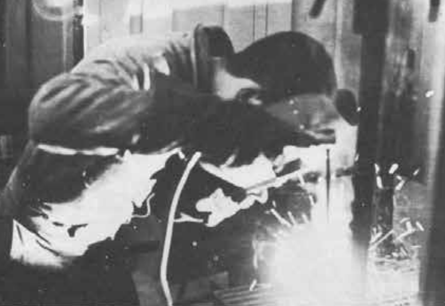
Un ragazzo del « Don Bosco Youth Center » alla saldatrice.

dalla fuliggine. Per loro, questo, è l'inizio di una vita nuova.