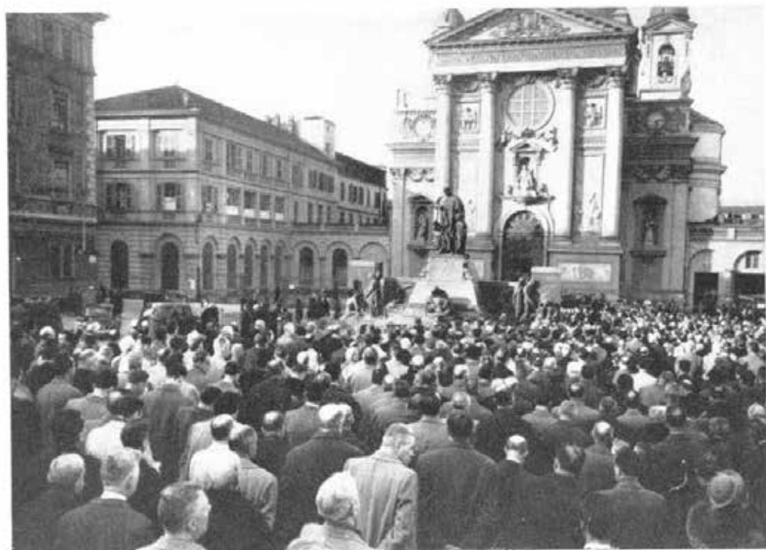
TORINO - GIUBILEO UOMINI DI AZIONE CATTOLICA