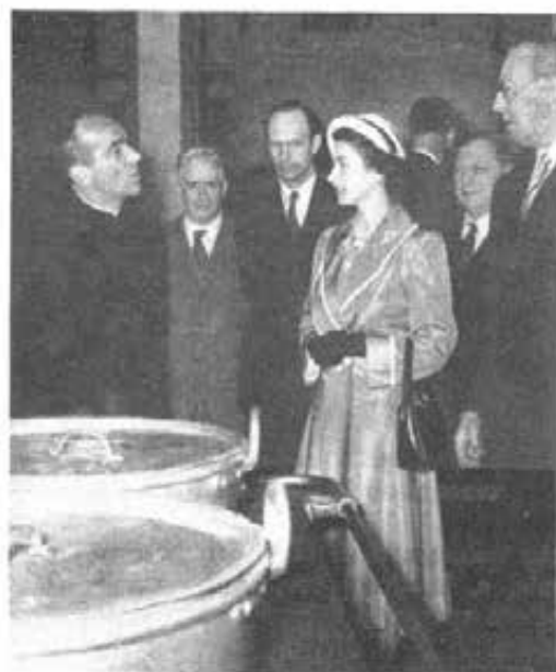
La Principessa Elisabetta d'Inghilterra al Borgo D. Bosco.

Vescovi, prima di chiudere il loro convegno, hanno onorato di una loro gradita visita il locale Istituto Salesiano, ove 130 giovani si preparano alla vita salesiana e sacerdotale.