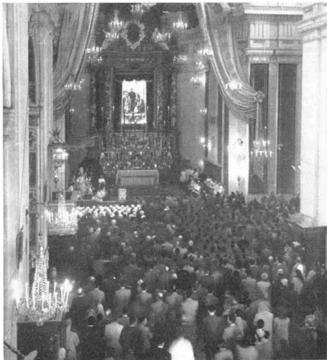
MACERATA - Chiesa di S. Giovanni - Festa cittadina in onore di S. Giovanni Bosco voluta dal Vescovo.