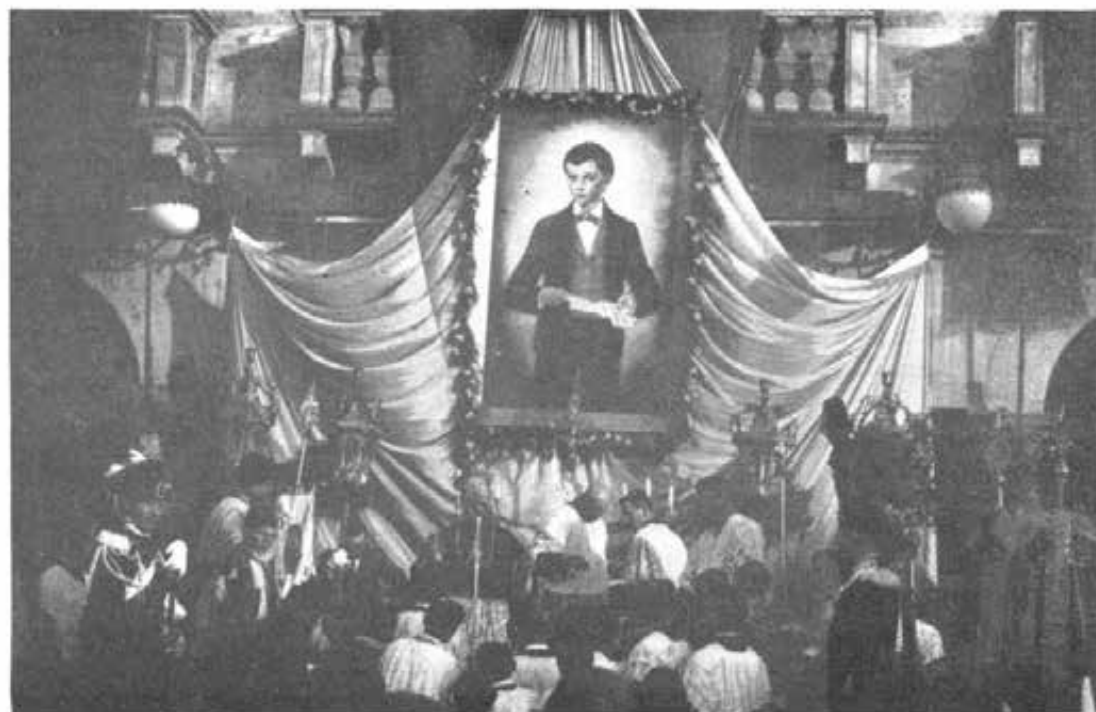
ESTE - Festa del Beato Domenico Savio. Parla il Vescovo di Padova.

I canti eseguiti dalle masse corali dei giovani dell'Istituto e dell'Oratorio Salesiano, accompagnati da un'ottima orchestra, conferirono alle