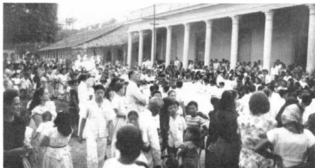
GRANADA (Nicaragua - Centro America) - Feste in onore del Beato Domenico Savio.

Nel pomeriggio i giovani si raccolsero all'Oratorio e di là, dopo un allegro trattenimento, mossero in corteo alla Cattedrale, agitando i loro vessilli, cantando gli inni del Beato e dell'Azione Cattolica. E Monsignor Vescovo, impartita la Benedizione Eucaristica, conchiuse la festa con la sua paterna parola di compiacimento e di plauso, indicando ai giovani il loro modello ed esortandoli ad imitarlo con quella energia di volontà, che in Savio Domenico decise l'ardita ascesa ai fulgori della santità.