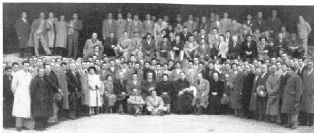
TORRE ANNUNZIATA - Precetto Pasquale al Pastificio Comm. Gallo.

Nel 1881 fu offerta a Don Bosco, perchè mandasse i suoi figli a officiarla; egli l'accettò e mandò i Salesiani, i quali promossero con attività instancabile la pietà eucaristica e la devozione mariana, e la chiesa parrocchiale divenne così un centro frequentatissimo di vita cristiana. Quest'anno ha avuto il grande onore di essere elevata al titolo di Basilica Minore, con grandissima gioia dei parrocchiani e della popolazione cittadina.