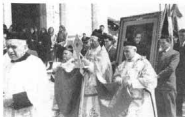
VEROLENGO - Festa in onore di S. Giovanni Bosco.

Il giorno del precetto fu caratterizzato da visibile commozione e profonda gioia interiore.