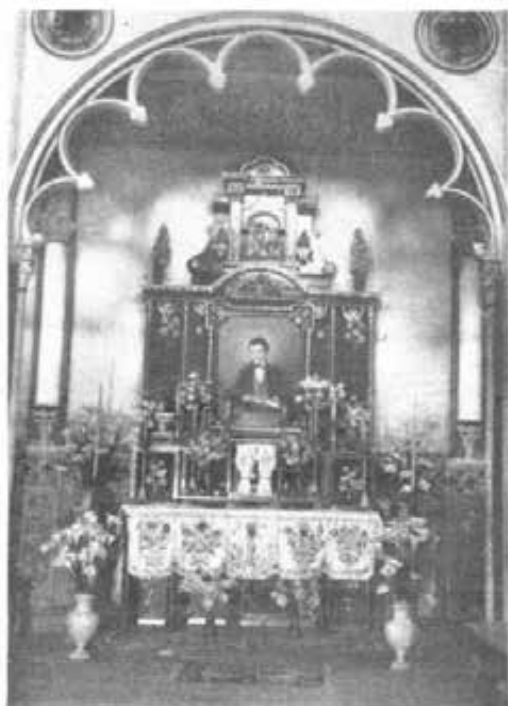
QUITTO - Oratorio festivo - Altare al B. Domenico Savio.

nella sua forma più semplice è sacramentale; infine esprime l'apostolato salesiano, che è apostolato di simpatia e di bontà. Guadagnarle anime per la gloria di Dio; guadagnarle per mezzo d'una amorevole e santificante assistenza; guadagnarle