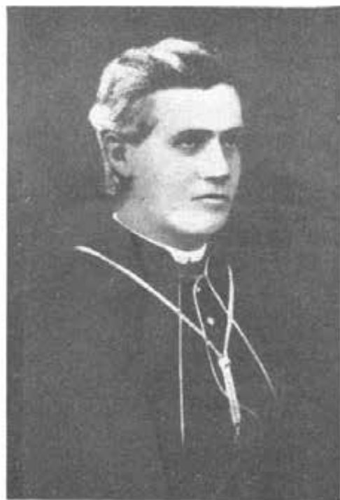
Can. Giuseppe Sarto, Vicario Capitolare di Treviso

Nel settembre 1886, Brescia preparava solenni festeggiamenti per l'incoronazione della statua di Maria venerata nel Santuario delle Grazie. I cantori di D. Bosco vi furono invitati per la parte musicale. Erano presenti