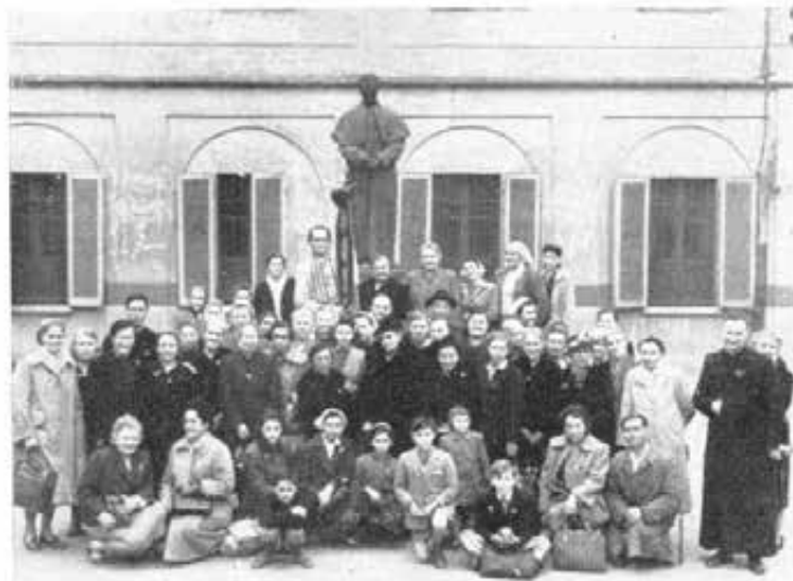
RIONE ABBADESSE (Milano) - Associazione S. Carlo.