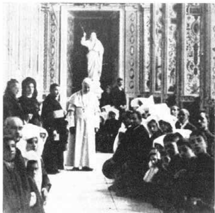
Pio X fra i terremotati di Calabria.