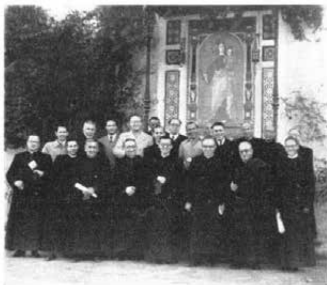
Sacerdoti Ex Allievi a Siviglia per la festa di San Giovanni Bosco.

Verso la fine di maggio, per determinazione della mia Ispettrice, mi trasportarono a S. Paulo nel Collegio « Santa Inez » per sottopormi all'esame di altri