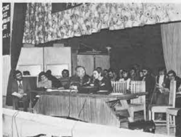
La Piccola Sorella di Gesù

Per fare una scelta più cosciente e matura ho partecipato a tutte le attività che il gruppo GG.CC. di Portici andava svolgendo in quel periodo. Io che non ho mai giocato a pallone ho fatto un campo-carta, sono stato il capogruppo del campo-base: ho lavorato per la costruzione in oratorio di un campo di pallone dove non ho mai