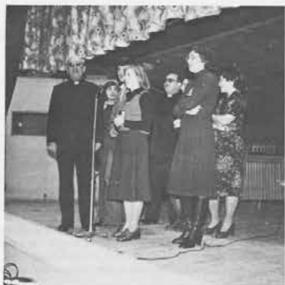
Con i fratelli di Polonia ci si comprendeva con il linguaggio del cuore e attraverso il canto...

3° dell'augurio sincero, che vorrei fosse insieme "congratulations": non c'è da attendere la conclusione per sapere come è andata. Non può non andar bene. Perciò congratulations!