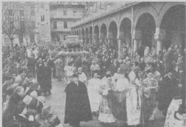
SAN DOMENICO SAVIO ritorna trionfante nel cortili che furono campo delle sue allegre ricreazioni.

Attorno all'urna del santo figliuolo del fabbro di Riva di Chieri avevano portato una simpatica nota di solidarietà nel lavoro illuminato dalla fede parecchie centinaia di lavoratori della Fiat-Mirafiori, i quali alle 9 di quel mattino, guidati dal loro presidente ing. Chiaiva, si erano recati a Valdocco per assistere alla Messa celebrata dal cappellano don Pelli, salesiano, e ascoltare la brillante conferenza del Sottosegretario alla Difesa, on. Bovetti.