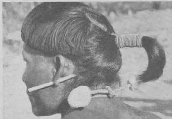
Tipo Xavante della Missione Salesiana Santa Teresina. Si notino le caratteristiche principali della tribù: - la pettinatura... alla moda - la tonsura ben visibile - l'ornamento all'orecchio - il cordone al collo, legato di dietro.

Mi trovavo un giorno con un gruppo di Bororo sulle sponde del Rio das Mortes; si era prossimi al tramonto e si lavorava per allestire un bivacco per la notte. Era l'ora in cui fanno la loro comparsa i capivara. L' Hidrocoerus capibara in lingua tupi è chiamato coapi-quara , cioè, mangiatore di erba, ed è il più grande roditore che io conosca; vive ai margini dei fiumi tropicali o in laghi e conche d'acqua. Può rimanere immerso sott'acqua molto tempo e in tal modo sfugge alla caccia del giaguaro e dell'uomo. Per i Bororo il capivara è tabù; nessuno lo può toccare, nessuno lo può uccidere, nessuno ha il coraggio di mangiarne le carni. Chi lo tocca, muore. L'unico immunizzato è lo stregone. Orbene, un