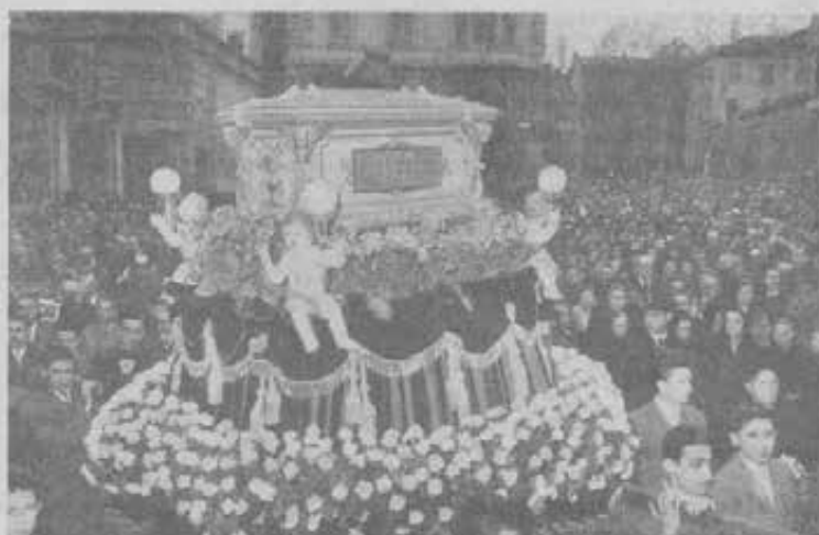
TORINO - Feste Centenarie di San Domenico Savio