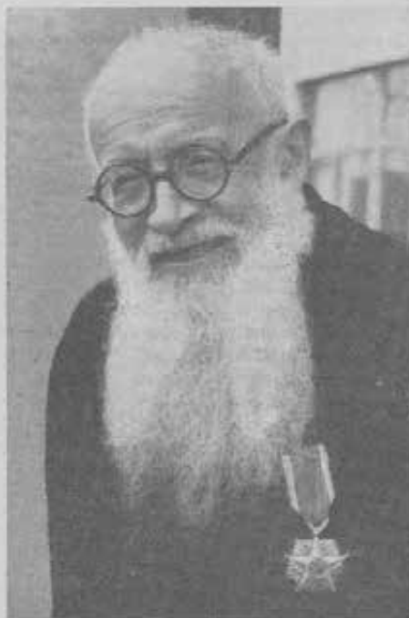
MONSIGNOR VINCENZO CIMATTI

Prima di consegnare la decorazione, Sua Eccellenza pronunciava elevate parole di ammirazione per il lavoro compiuto dai missionari salesiani in Giappone, sotto l'abile guida di Mons. Cimatti, e concludeva: «Questa decorazione è un giusto riconoscimento di un trentennio di nobile apostolato religioso e umanitario; con il quale Mons. Cimatti ha veramente onorato la Chiesa, l'Italia e la Congregazione di Don Bosco».