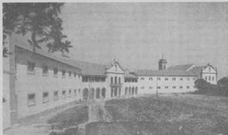
ESTORIL (Portogallo) - Il solitario monastero del 1500 è oggi una piccola città risonante della rumorosa allegria di 800 ragazzi di Don Bosco.

Era prima un piccolo monastero del 1500, che sorgeva al centro di un fitto boschetto. Con la soppressione degli ordini religiosi nel sec. XVIII è passato ad altri padroni, e nel 1932 vi entrarono i Salesiani, giacchè l'ultimo proprietario per legato testamentario lo destinava ad un'opera di formazione per ragazzi poveri. Così al silenzio monastico successe la gioia chiassosa della gaité gioventù di Don Bosco.