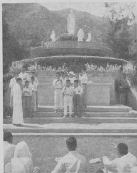
ACCADEMIA ALL'APERTO A HONGKONG - Mentre i nemici di Dio incrudeliscono contro i sacerdoti e i missionari, i nostri aspiranti inneggiano alla Madonna e La pregano per i persecutori dei benefattori e padri delle loro anime.