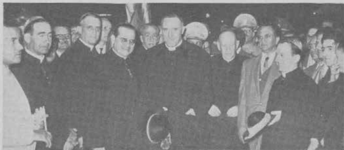
CARACAS - Il trionfale ricevimento del Rettor Maggiore all'Aeroporto Internazionale di Maiquetia (Venezuela). Tra i presenti S. E. il Nunzio di S. S., l'Arcivescovo di Caracas, i Vescovi Salesiani di Coro e di Puerto Ayacucho e numerose personalità civili e militari.

Entrato in città, la prima sua visita è alla Casa della Regina delle opere salesiane, il tempio