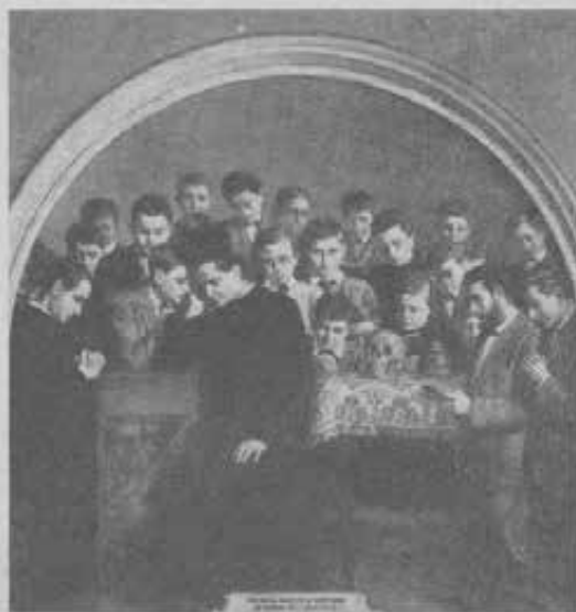
Don Bosco ascolta le confessioni dei giovani dell'Oratorio.