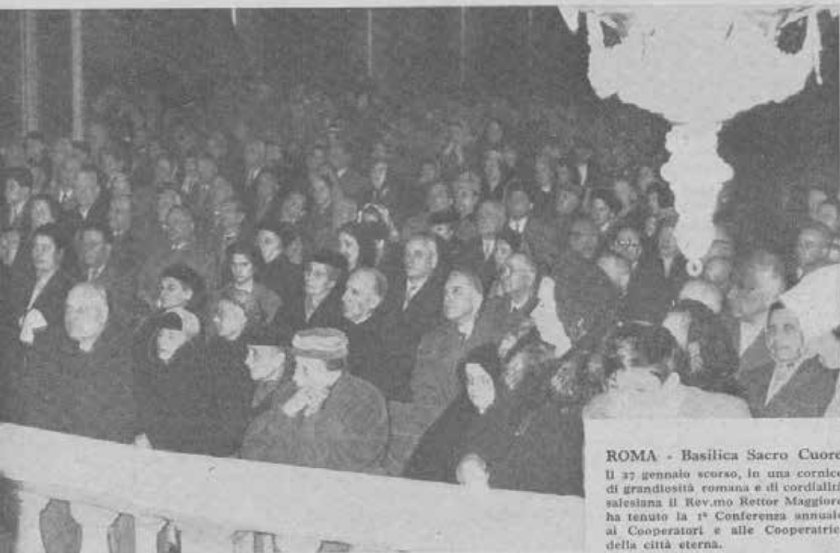
ROMA - Basilica Sacro Cuore Il 27 gennaio scorso, in una cornice di grandiosit  romana e di cordialit  salesiana il Rev.mo Rettor Maggiore ha tenuto la 1  Conferenza annuale ai Cooperatori e alle Cooperatrici della citt  eterna.

Concludiamo riassumendo le impressioni generali in una sola parola: un'ora di serena, benefica letizia.