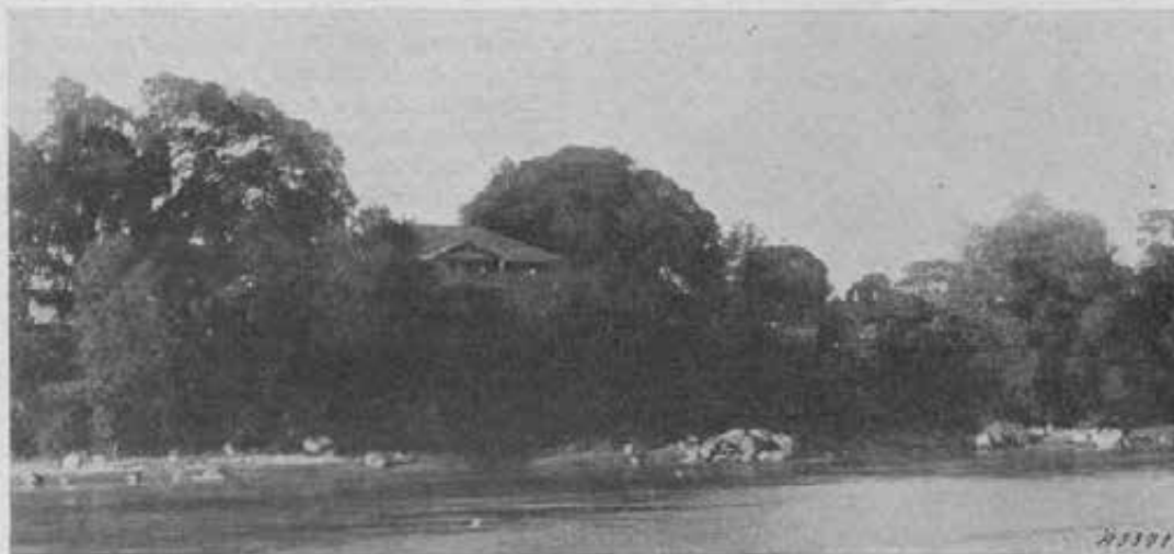
Tezpur (Assam). - La casa salesiana spunta tra il verde sulle rive del fiume.