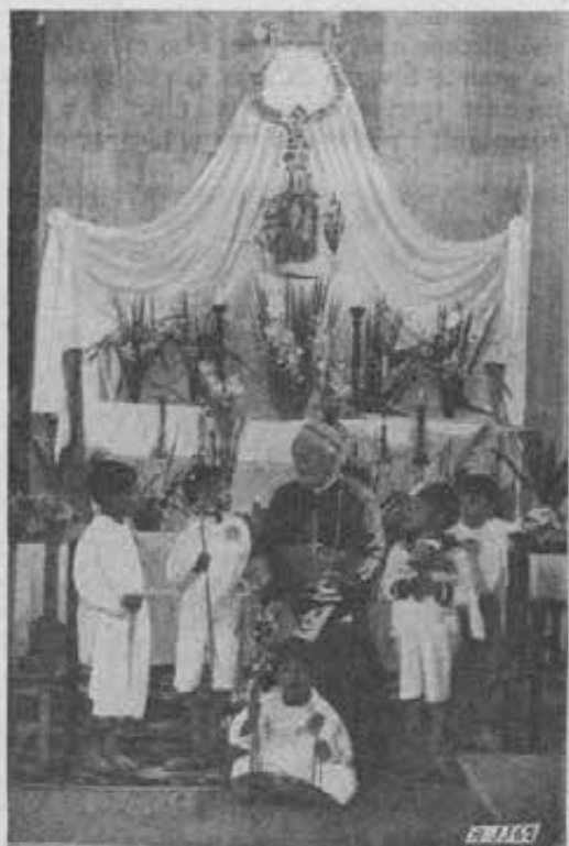
Equatore. - Sotto gli sguardi dell'Assistentrice il Vescovo raccoglie i Kivaretti che han fatto la prima Comunione.

CONSOLANTI RISULTATI. — Conquistarli con le buone, adescarli con regalucci, surrogare la mamma, indovinare i loro gusti, contentarli se non sono cattivi e, se cattivi, correggerli con modi benevoli, senza che s'accorgano che debbono far così, non perchè così si vuole, ma perchè è cosa più ragionevole, perchè la vuole Iddio. Se sul giogo pesa un po' l'uomo, non l'accettano. È quello che facciamo, procurando di imitare, nel più alto grado possibile, lo spirito di soave bontà e di dolcezza di don Bosco.