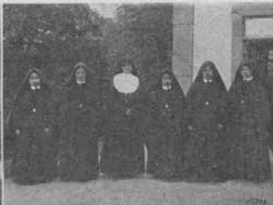
Beppu (Giappone). - La seconda vestizione delle Figlie di Maria Ausiliatrice. Le giovani novizie giapponesi prima e dopo la funzione.

Duplichiamo i Cooperatori di Don Bosco Santo!