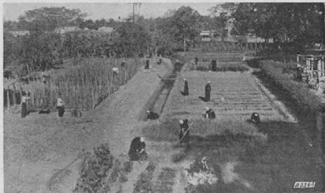
Bang Nok Khuek (Siam). - Chierici salesiani ed alunni alla scuola pratica di agricoltura.

I MEZZI. — Come si fa a mantenere nelle Missioni tutti questi frugoli? Il primo aiuto è l'obolo della santa Infanzia di Parigi, che però è ben lungi dall'essere sufficiente. Mi son rivolto ai nostri colleghi dell'Equatore, nei quali si son formati dei gruppi di Amici della Missione. Questi piccoli missionari s'impongono dei sacrifici e raccolgono una pensione mensile per tenere nella Missione un selvaggio. Il mio plauso e il mio « grazie! », specialmente ai due colleghi di Guayaquil, « J. D. Santistevan » e « Cristobal Colón », all'Istituto di « Benefi-