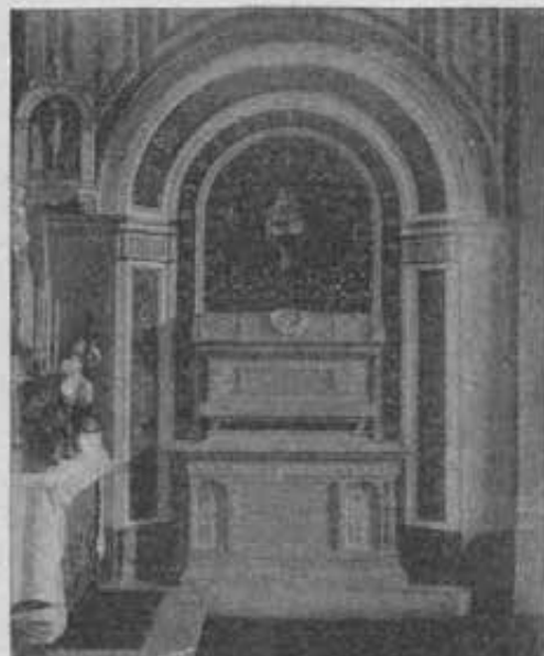
Tomba della Ven. M. Maria Mazzarello a Nizza Monferrato.

Il nome della Ven. Mazzarello sta accanto a quello di S. Giovanni Bosco nella storia delle gesta salesiane; storia e gesta di carità e di conquista d'anime, e di rinnovamento cristiano: documento non perituro della vita storica e della perenne, indefettibile fecondità spirituale della Chiesa di Cristo.