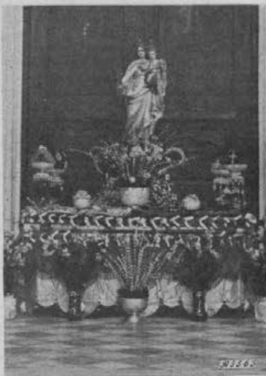
Siam. - La statua di Maria Ausiliatrice nell'esposizione floreale organizzata dai nostri giovani.

xilium Christianorum ; dopo quella di Vienna, Innocenzo XI approva l'erezione in Monaco di Baviera di un'Arciconfraternita sotto il titolo di Maria Ausiliatrice . Tornato a Roma, dopo la prigionia, Pio VII istituisce la festa della Vergine Ausiliatrice da celebrarsi ogni anno in Roma il 24 maggio, data della firma dell'abdicazione di Napoleone (24 maggio 1814).