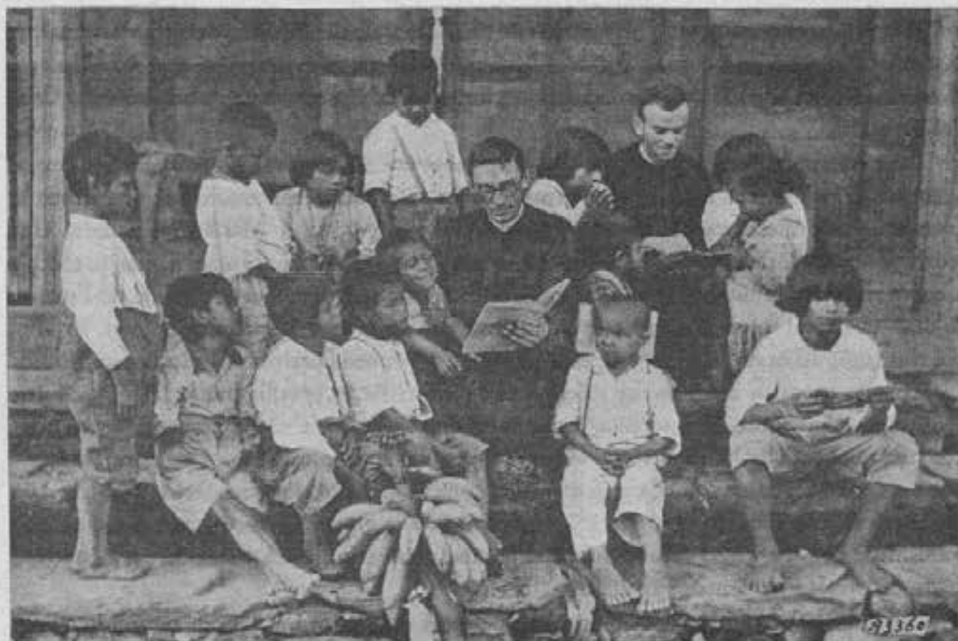
Mendez (Equatore). - Kivaretti a scuola.

Dopo qualche giorno giungemmo a Kankata, il villaggio Maria Ausiliatrice. Fu qui infatti che la carità e lo zelo delle Suore seppero guadagnare alla fede quei pagani sino ad allora refrattari al Vangelo. Ora, eccoli tutti attorno ad insistere per ricevere l'Acqua che purifica