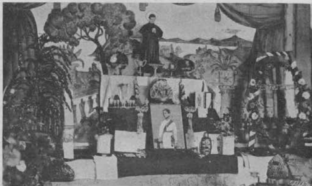
Siam. - L'aula dell'Esposizione agricola organizzata dai Salesiani.

a vedere una Mostra preparata da ragazzi. Ma io vi confesso che, se avessi saputo di trovare qui ciò che ora ho visto, avrei portato con me tutti i maestri e i capi-villaggio di tutta la provincia. E, seduta stante, volle l'assicurazione che si sarebbe organizzata una nuova esposizione nei nostri locali e sotto la nostra direzione, estendendo la partecipazione a tutta la provincia.