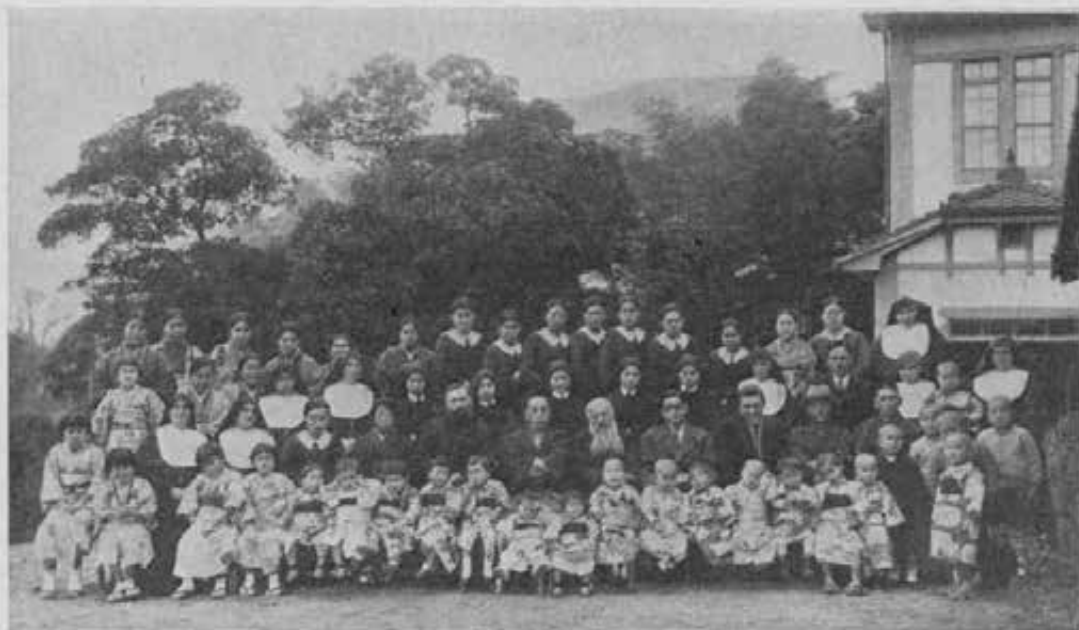
Beppu (Giappone). - Gruppo generale dopo la funzione della vestizione nella Casa "Madre Mazzarello".

Un'altra bella giornata, che ha segnato un gran passo in avanti per la nostra piccola Santa Infanzia, fu quella del 13 dicembre, giornata del bazar . Il bazar in Giappone è il gran mezzo per battere cassa e fare propaganda. Non v'è scuola che non lo prepari annualmente; ogni Opera fa il suo piccolo assegnamento sui bazar : chiamar gente, ricavare qualche cosa dalla vendita delle proprie confezioni, farsi conoscere... è lo scopo. « Fate un bazar! » ci insinuavano alcuni dei più caldi ammiratori della nostra Opera. « Aprite un giorno le porte a tutti tanti desiderano venire e non osano... ». Poichè, se è vero che da qualche tempo attorno all'umile Opera nostra si venivano suscitando onde di entusiasmo e da varie città del Kiushu e della Grande Isola, e perfino dalla capitale, venivano sovente visitatori anche a gruppi, è anche vero che dei Beppesi ben pochi fino allora si erano spinti fin quassù ad assicurarsi de visu