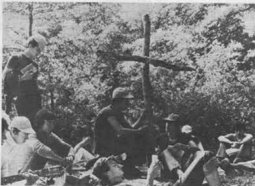
Giovani per un'estate diversa. Sono quelli del Centro Giovanile Salesiano di Potenza. Passati attraverso l'esperienza forte di Taizé, hanno poi vissuto il «Concilio dei giovani» nel loro rione, nel loro oratorio, nei paesini sperduti dei loro monti, tra la loro gente.

Il 15 novembre scorso il presidente del Senato, Giovanni Spadolini, ha conferito al Collegio salesiano «Astori» di Mogliano Veneto il diploma con medaglia d'oro concesso dal Presidente della Repubblica ai benemeriti della scuola, della cultura e dell'arte. Dopo aver rievocato l'azione sociale di Don Bosco, il sen. Spadolini ha osservato che il fondatore dei Salesiani intuì che la più valida componente del divenire sociale sta nell'educazione spirituale e nella formazione professionale dei giovani.