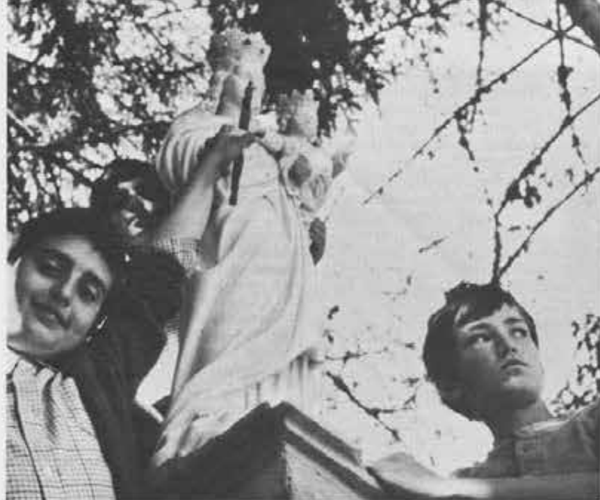
In alto: La «Madonnina», conosciuta e cara a tutti i Caglierini del mondo, attornata dai ragazzi d'oggi. In basso: L'allegria di sempre accanto al tipico porticato del «Cagliero».