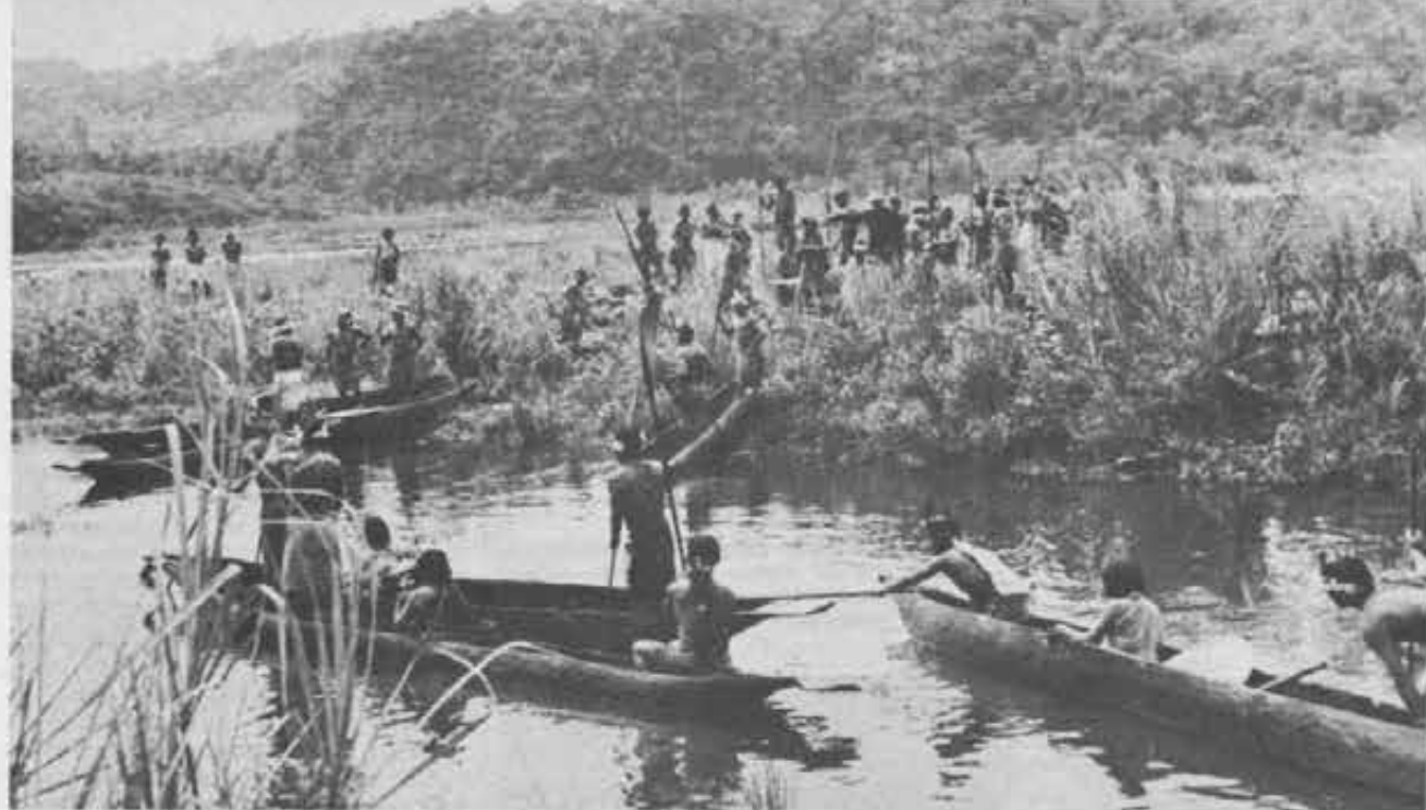
Incontro di indios in uno dei tanti angoli verdissimi e intatti dell'Amazonia.