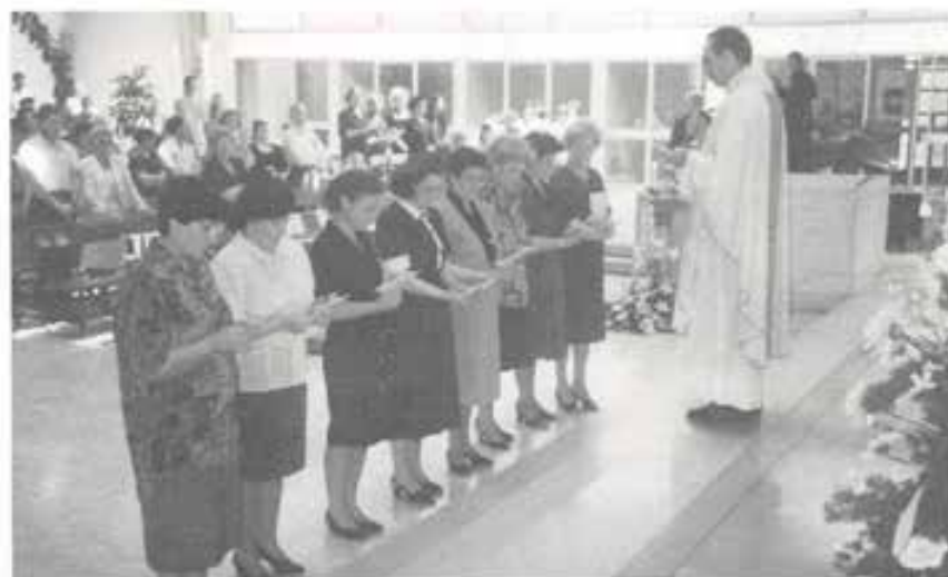
La Spezia - Canaletto: Il momento solenne della «Promessa».