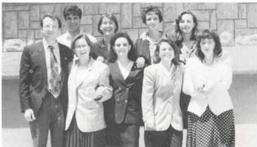
Potenza: I magnifici 9 neo-Cooperatori!