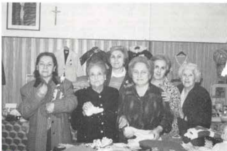
Napoli - Vomero: Cooperatrici impegnate nel Laboratorio «Mamma Margherita».