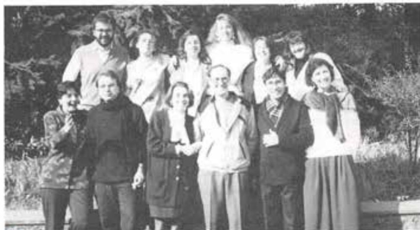
UPS - Roma: Il neo-Gruppo dei Cooperatori sorto presso l'Ateneo Salesiano. Complimenti e... buon lavoro.

Erano presenti i Coordinatori, Consiglieri, Delegate e altri Coope-