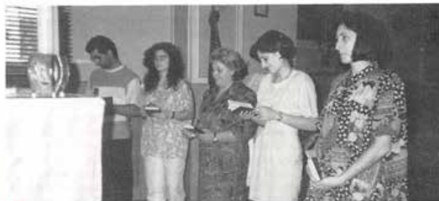
È sempre commovente il giorno del «si».