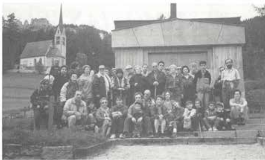
«Amici di Fontanazzo» in escursione al Santuario di S. Giuliana, patrona della Val di Fassa.