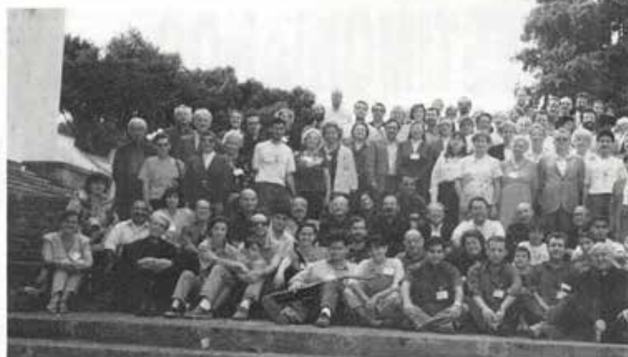
Foto ricordo dei partecipanti.