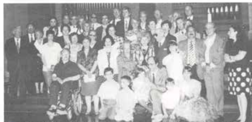
Roma: Il Gruppo dei Cooperatori nel giorno della «Promessa» a S. Maria della Speranza.

ratori sensibili al problema, provenienti dai Centri di Agliè, Aosta, Caluso, Cavaglià, Romano, S. Giusto, Salussola, Torre e Vercelli.