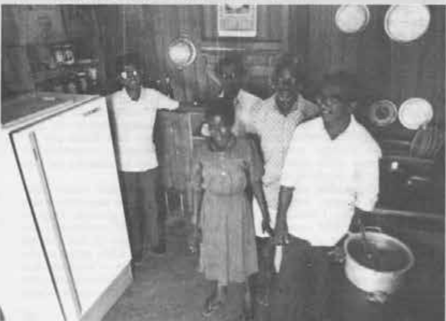
▼ — Con i missionari a Korr è arrivato anche... un frigorifero.