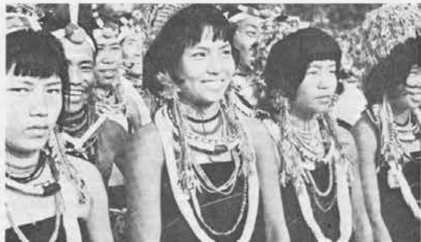
Ragazze della tribù del Rongmei-Naga nel loro ricchi costumi di danza.