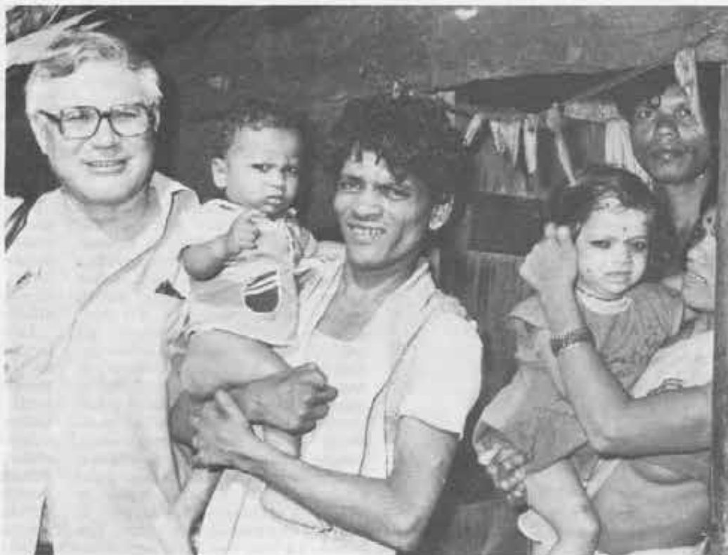
In alto: A Calcutta con Madre Teresa. La stessa è stata a Udine su invito dell'Associazione fondata da Siplone nel dicembre 1981.

Sono piccole gocce in un mare immenso di attese e sofferenze, ma