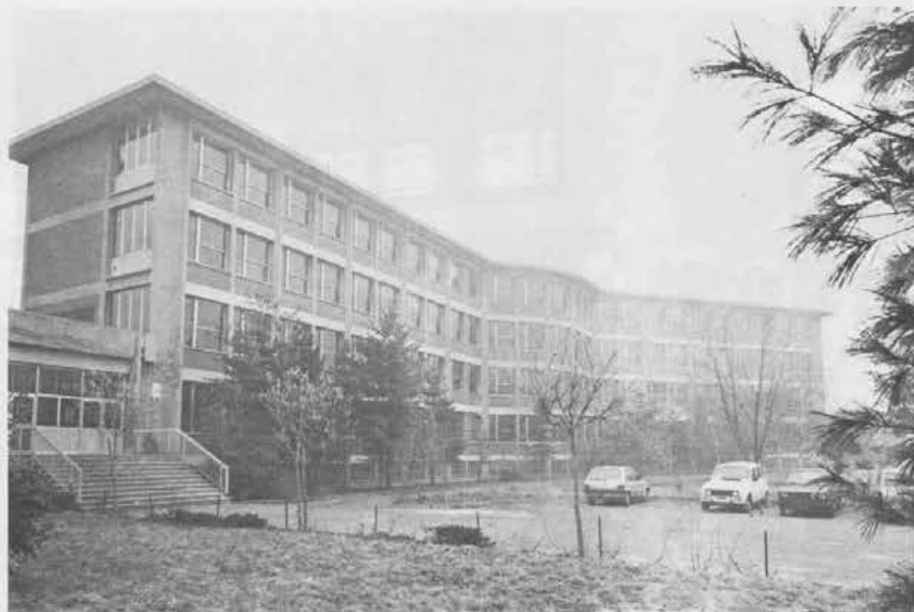
La scuola professionale Maria Mazzarello di Cinisello Balsamo (Milano) diretta dalle Figlie di Maria Ausiliatrice.