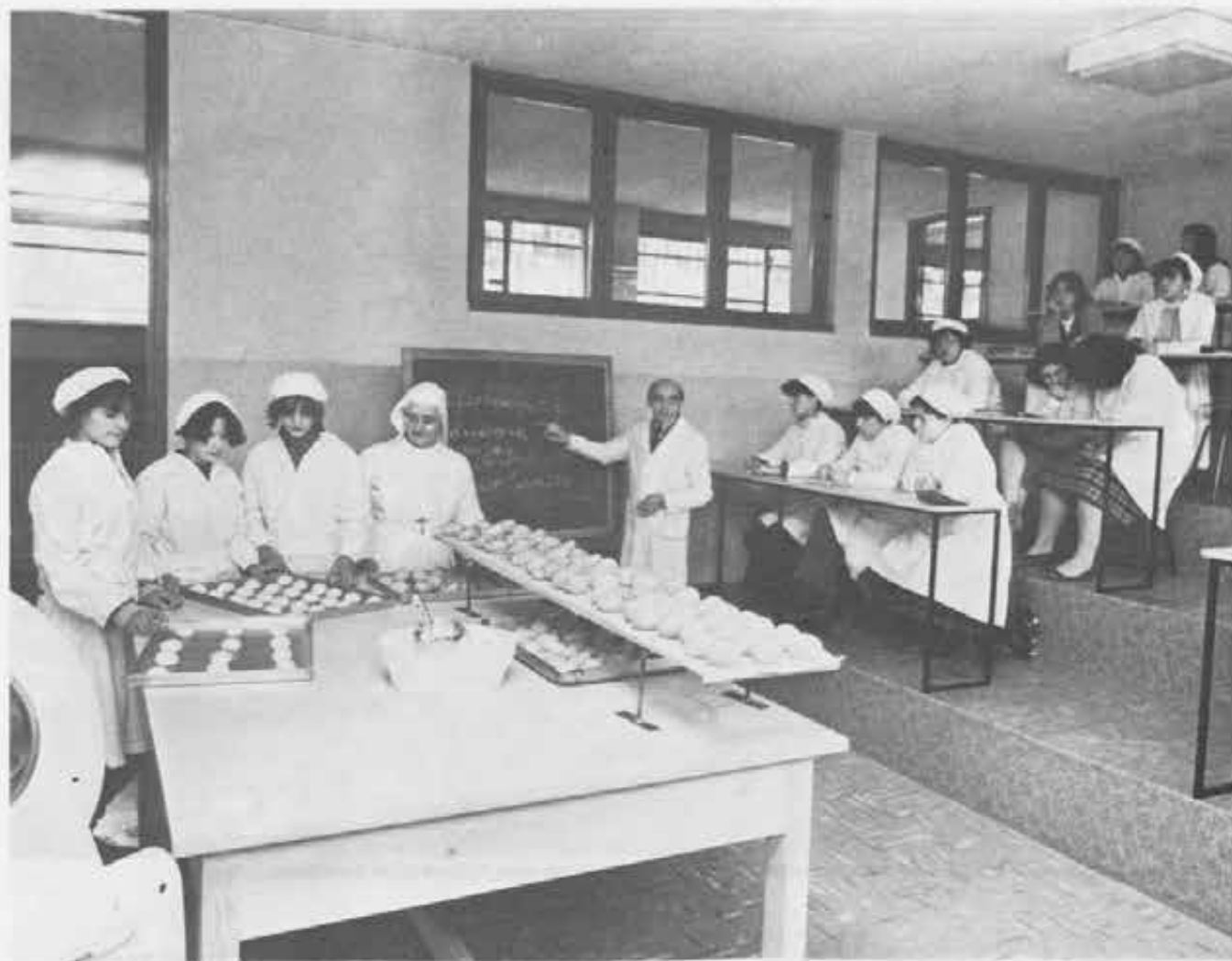
Ecco alcune immagini del corso professionale che prepara Tecnici per l'alimentazione: