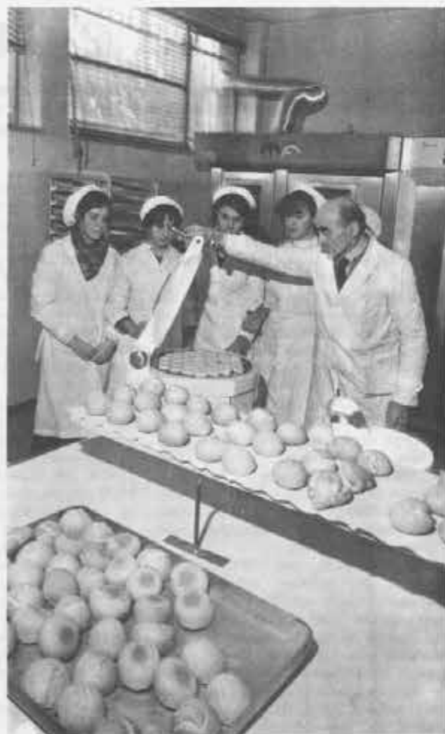
L'iniziativa della FMA è una concreta risposta alle esigenze del territorio lombardo.