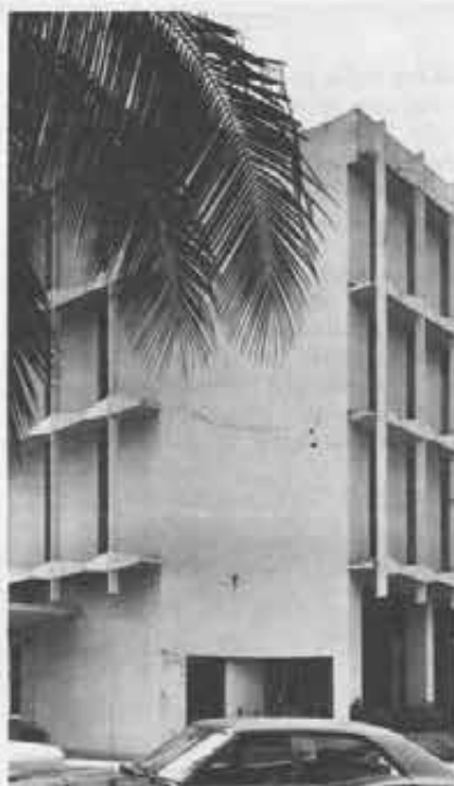
L'Auditorium del «Pius XII Catholic Center» di Manila.