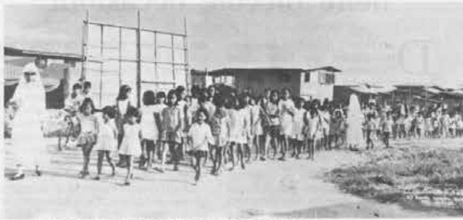
Suore della Casa Maria Auxiliadora di Tondo con le loro bambine.

Una presenza salesiana come segno di speranza nel ricordo della visita di Paolo VI.