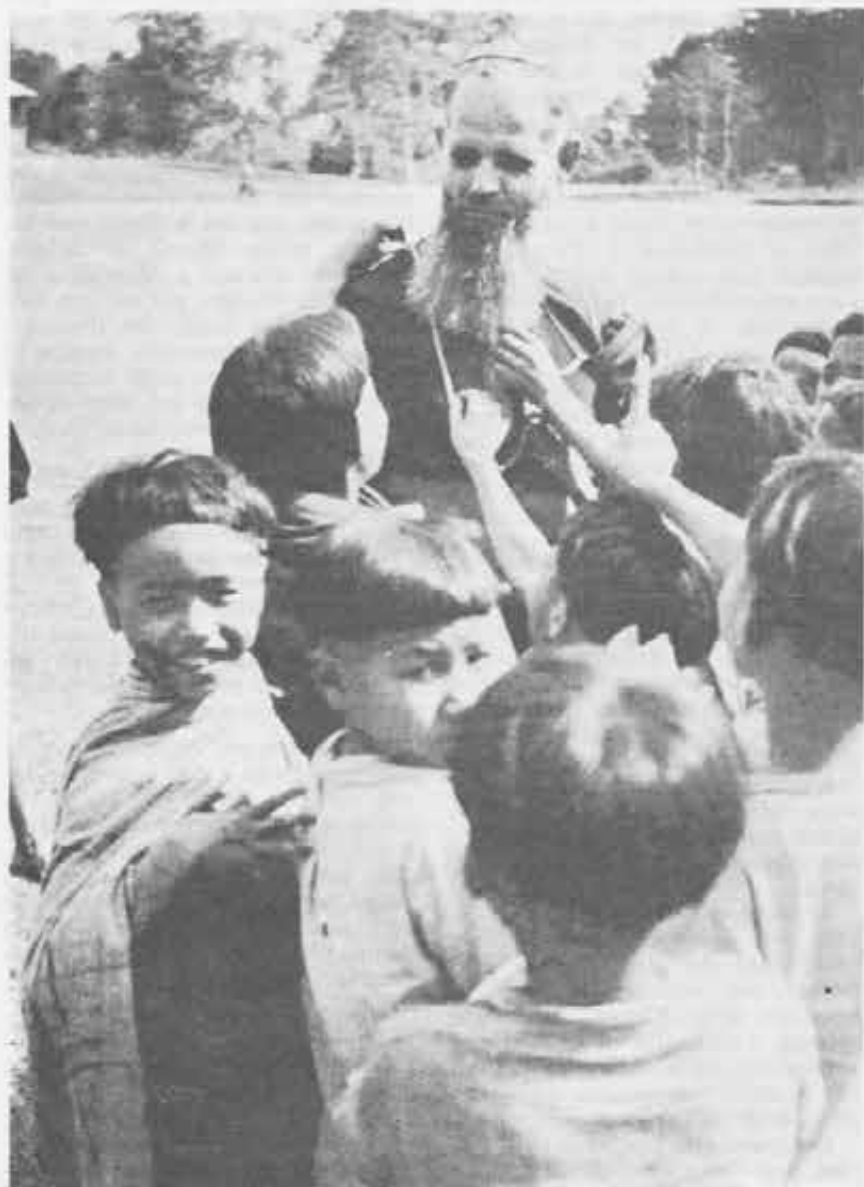
Tra i piccoli amici della tribù dei Lotha-Naga.

Tornava da un lungo giro di attività apostolica nel luglio 1951, quando fu colto da una notizia che non aspettava e non desiderava: la sua nomina a vescovo dell'erigenda diocesi di Dibrugarh. Inutili le sue proteste, i suoi pianti; si arrese solo quando il Rettor Maggiore don