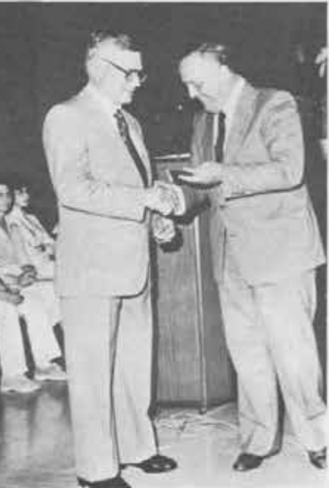
La consegna del «Premio Giovanni XXIII» ad Ancona.

Le sue parole semplici, l'esempio e la dedizione di tanti missionari e suore, soprattutto la visione impressionante e indimenticabile di tanti fratelli emarginati e di tantissimi bambini abbandonati, che attendono fiduciosi il nostro concreto interessamento, ci incoraggiano a proseguire con rinnovato impegno e generosità, a lavorare e sacrificarci per una autentica testimonianza di amore verso i «prediletti di Dio». ■