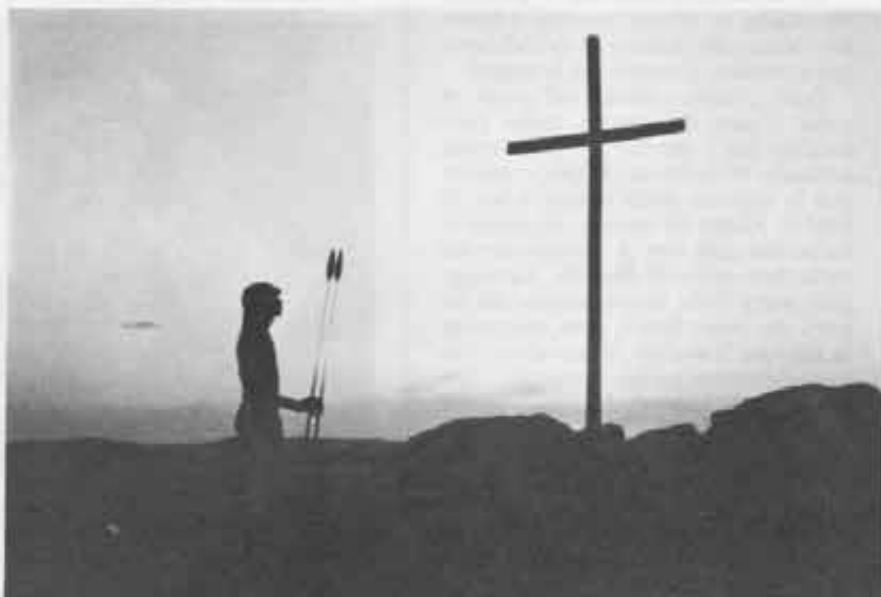
▲ — Plantare la Croce di Cristo è il primo impegno missionario. ▼ — Si fa catechismo nel deserto di Korr sullo sfondo di tipiche e povere capanne.

Le loro case hanno un diametro di 3 metri al massimo. E dentro vivono tre, anche quattro persone. L'abitazione è divisa in parti uguali. A