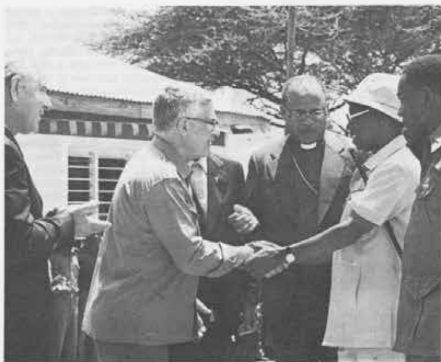
L'incontro in Tanzania con il presidente Julius K. Nyerere.

Lo scorso anno sono stati realizzati due altri asili a Hombolo e Ovada in Tanzania e due scuole a Pamarru e Naigonda (India); altri progetti sono in fase di realizzazione per handicappati e figli dei lebbrosi. Con l'aiuto della Provvidenza e di tanti amici speriamo completarli al