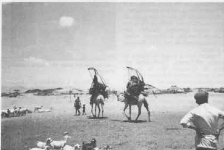
▲ — Una famiglia emigra: tutti i suoi averi eccoli sui cammelli.