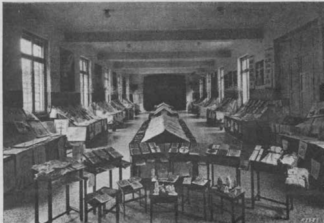
Milano - La Mostra Catechistica nella Casa Ispettorale delle Figlie di Maria Ausiliatrice.

Interessante, la raccolta di lezioni didattiche svolte dalle alunne della Scuola magistrale per bambini d'Asilo e delle Classi elementari. La Sacra Scrittura — Antico Testamento — era finemente illustrata con simboli e figure, in