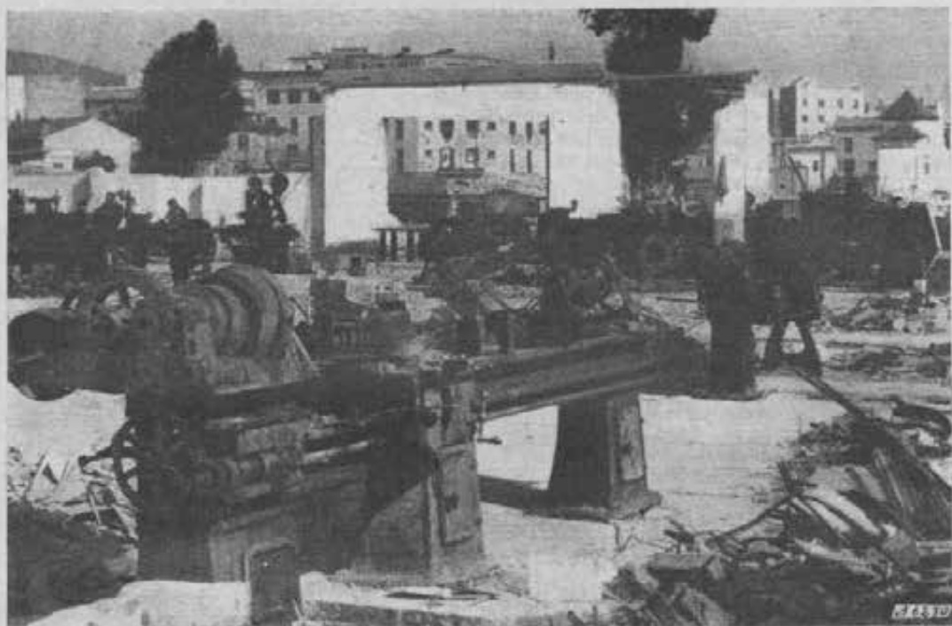
Sarrià-Barcellona - Uno dei laboratori devastati dai «rossi».