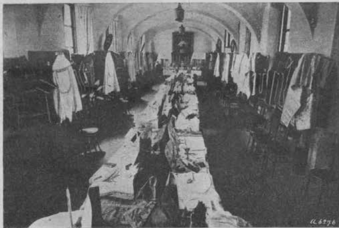
L'esposizione degli arredi sacri offerti dalle Dame-Patronesse per le Missioni.

Abbiain contato: 116 pianete; 3 paramentali completi, 9 piviali, 8 veli omerali, 6 cassette-cappelle, 11 altarini portatili, 3 servizi completi per altare (candelieri grandi e piccoli, cartegloria, crocifisso, messale e porta messale); 2 ostensori, 4 turiboli e navicelle, 5 pissidi, 2 lumiere a braccia per altare, 4 cartelle per la benedizione, 2 campanelli a grande suoneria, 5 cassette di pronto soccorso, una cassa di chinino dello Stato, 1 borsa per i SS. Sacramenti.