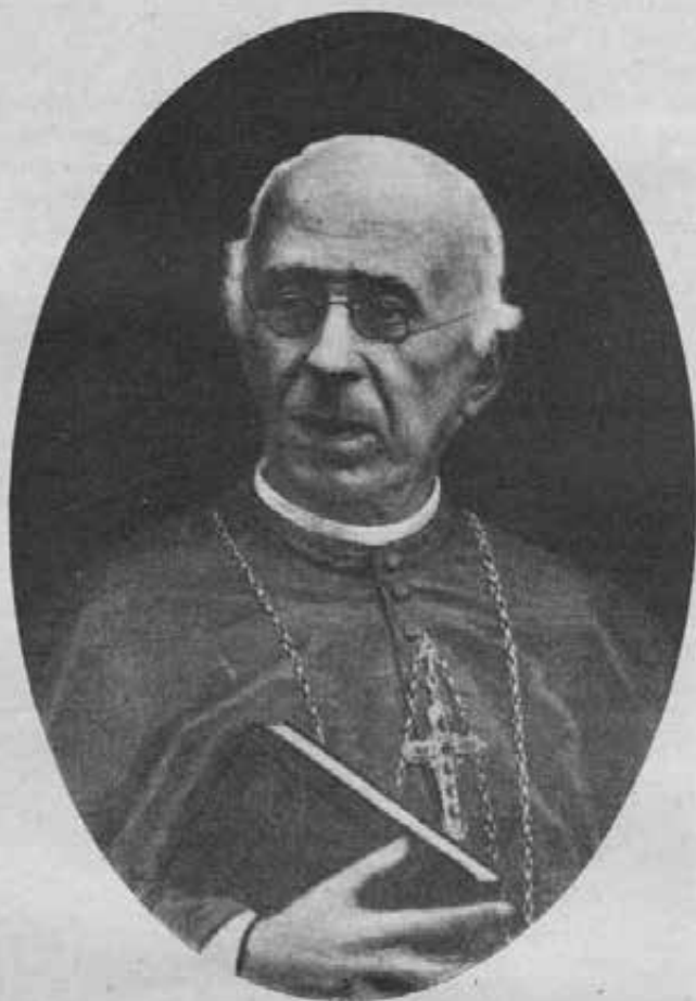
S. Em. Il Card. Gaetano Alimonda, Arciv. di Torino dal 1883 al 1897.

sostenuto per il bene della Congregazione! Come non ho tralasciato di pregare che Vostra Paternità Reverendissima e Carissima sostenesse senza pregiudizio della salute queste fatiche, così mi rallegro e ringrazio il Signore che l'abbia ricondotta ormai a noi vicina, incolume e, voglio sperare, anche in migliore stato. Noi ci vedre-