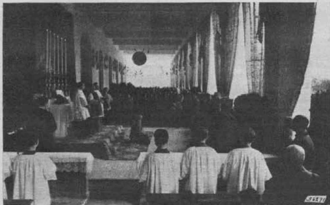
Fordenone - S. E. Mons. Bartolomasi commemora D. Bosco nel Collegio Salesiano, alla presenza delle Autorità e della truppa del Presidio.

magistrale intorno alle figure più note di Sacerdoti santi. — Al centro i Servi di Dio cresciuti alla scuola di S. G. Bosco e in bel'a corona parecchie eminenti figure di Sacerdoti educatori ed apostoli della carità.