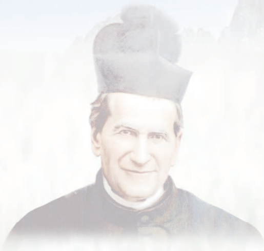
St John Bosco