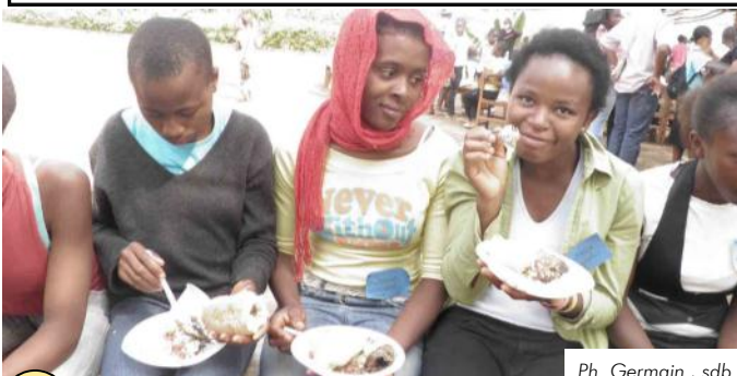
Ph. Germain, sdb

2 A la fin de la Messe, dans la cour du Centre de Jeunes de Mimboman qui accueille la rencontre, une méga-animation est organisée par les animateurs des différents oratoires : des chants de joie et de fête et la danse aux différents rythmes de chez nous. Bien que très intéressante, il faudra interrompre cette activité à 12h 00 pour passer à la projection du Film sur la fondation de la Congrégation Salésienne, au moment de partage dans les différents groupes constitués selon les couleurs des badges et la mise en commun des résolutions des différents groupes.