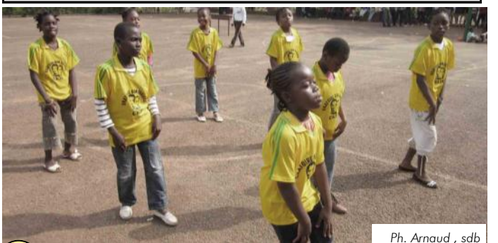
Ph. Arnaud, sdb

3 Vient le moment attendu par tous. Il faut partager. Pas facile l'organisation. Chaque Oratorio s'est organisé. Il y a le sirop bien préparé pour tous. Mais pour le repas, chaque oratoire a pris des dispositions qui lui sied le mieux. Repas préparé pour tous après une collecte des fonds ou repas tiré tu sac. Voilà les deux modalités d'organisation. Il faudra certainement faire mieux prochainement pour qu'aucun des enfants de Don Bosco ne manque un morceau de pain. Surtout pour des journées comme celle-ci.