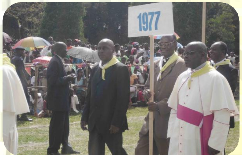
Jubilé de Diamant : grand séminaire fécond. En 75 ans, 1050 Prêtres et 26 Evêques p.19