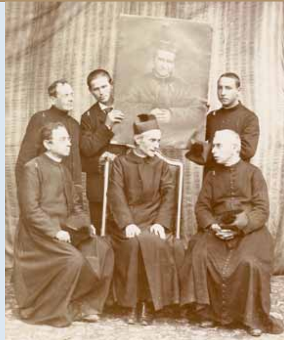
Don Rúa en 1892