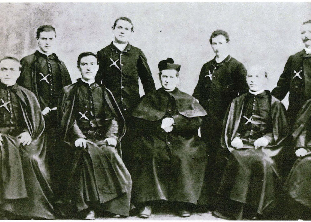
▼ Don Bosco amb els missioners de la 12 a expedició, l'última que es va fer mentre encara era viu (1887).