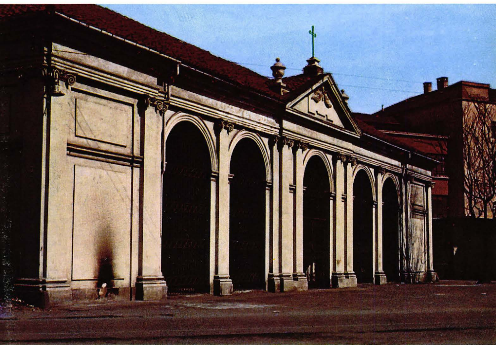
▲ Sant Pere ad Vincula.