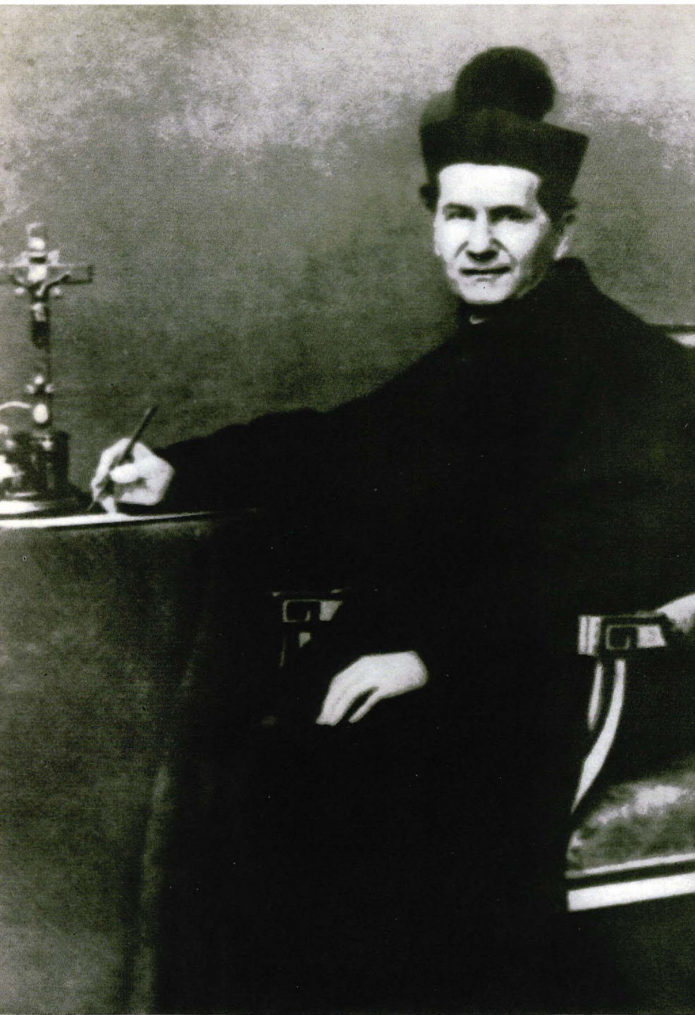
▲ Don Bosco a la seva taula de treball.