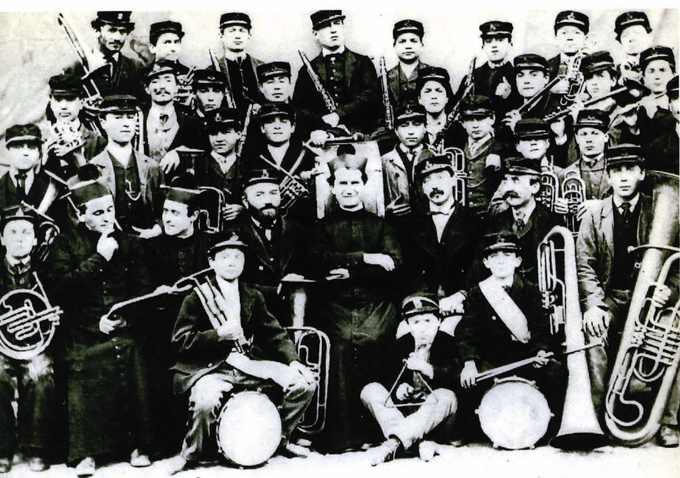
▲ Don Bosco enmig dels músics de l'Oratori.