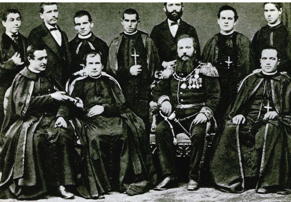
▲ Don Bosco enmig dels seus primers missioners (1875).