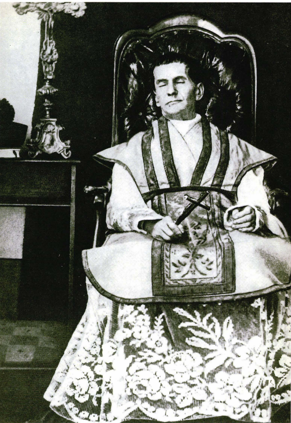
▲ Les despulles de Don Bosco exposades a la veneració dels fidels. La foto es va fer el 31.1.1888.