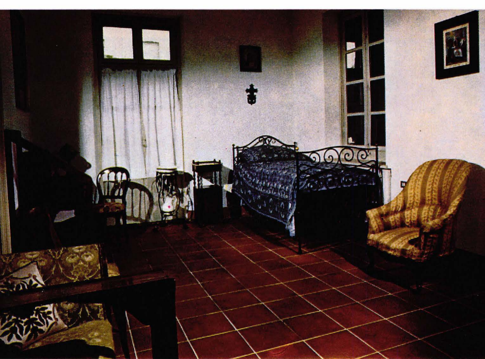
▲ Habitació de Don Bosco.