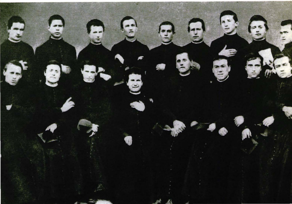
▼ Don Bosco envoltat pels sacerdots i clergues de l'Oratori (1870).