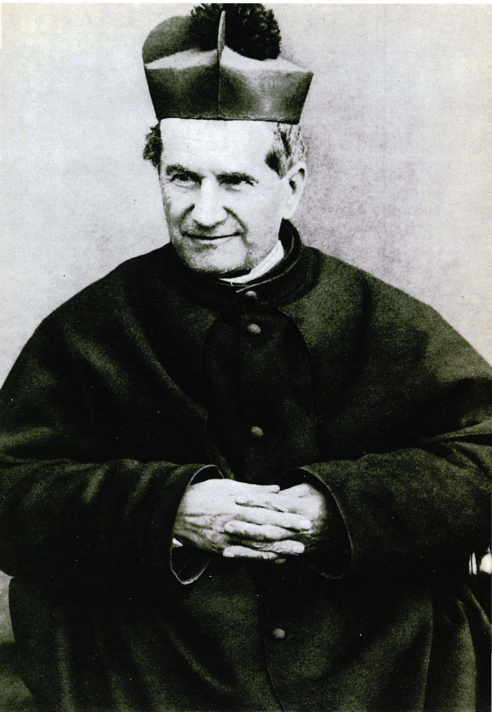
▲ Don Bosco el 1887.