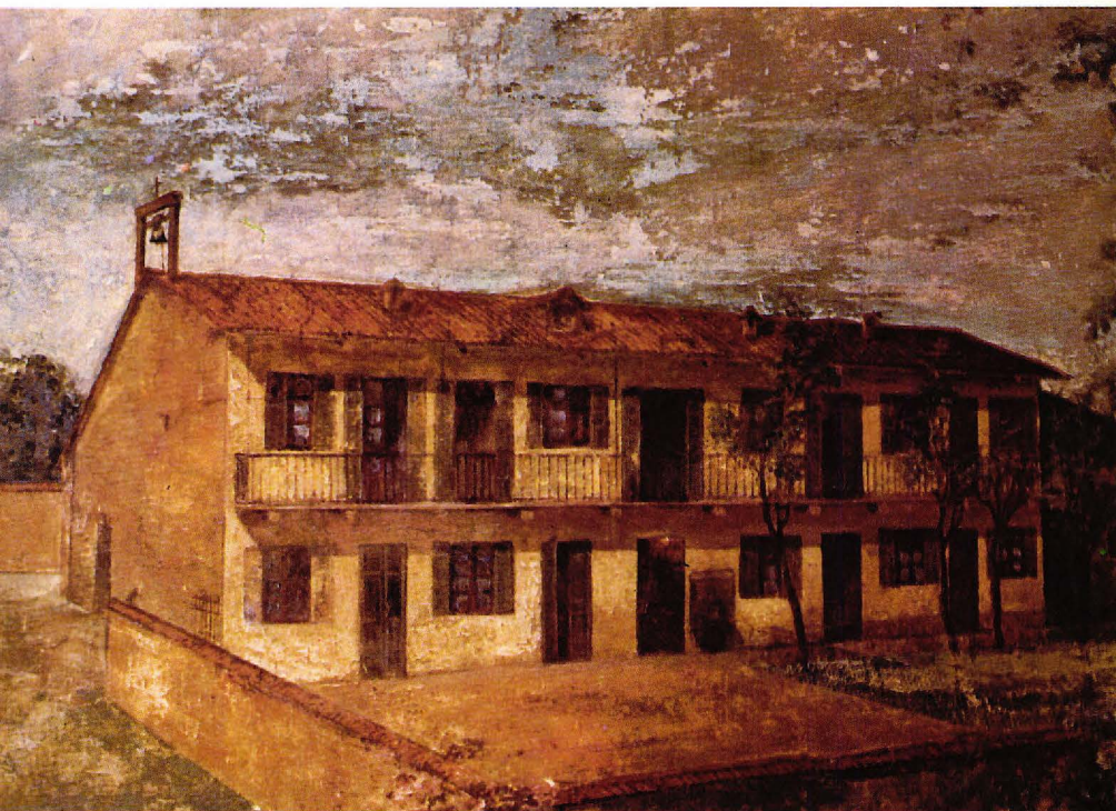
▼ Casa Pinardi.