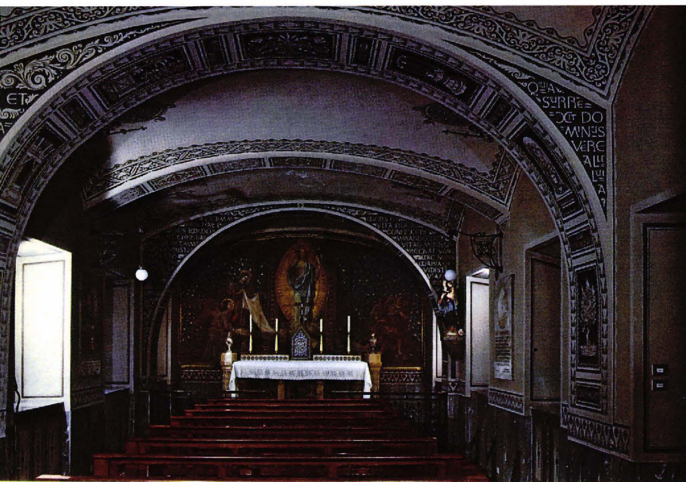
▲ Capella Pinardi (interior).