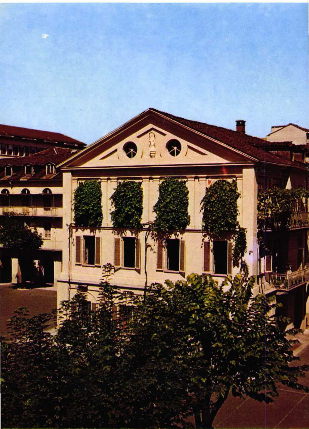
▲ La casa en què va viure Don Bosco. La seva habitació i el seu despatx eren al segon pis.