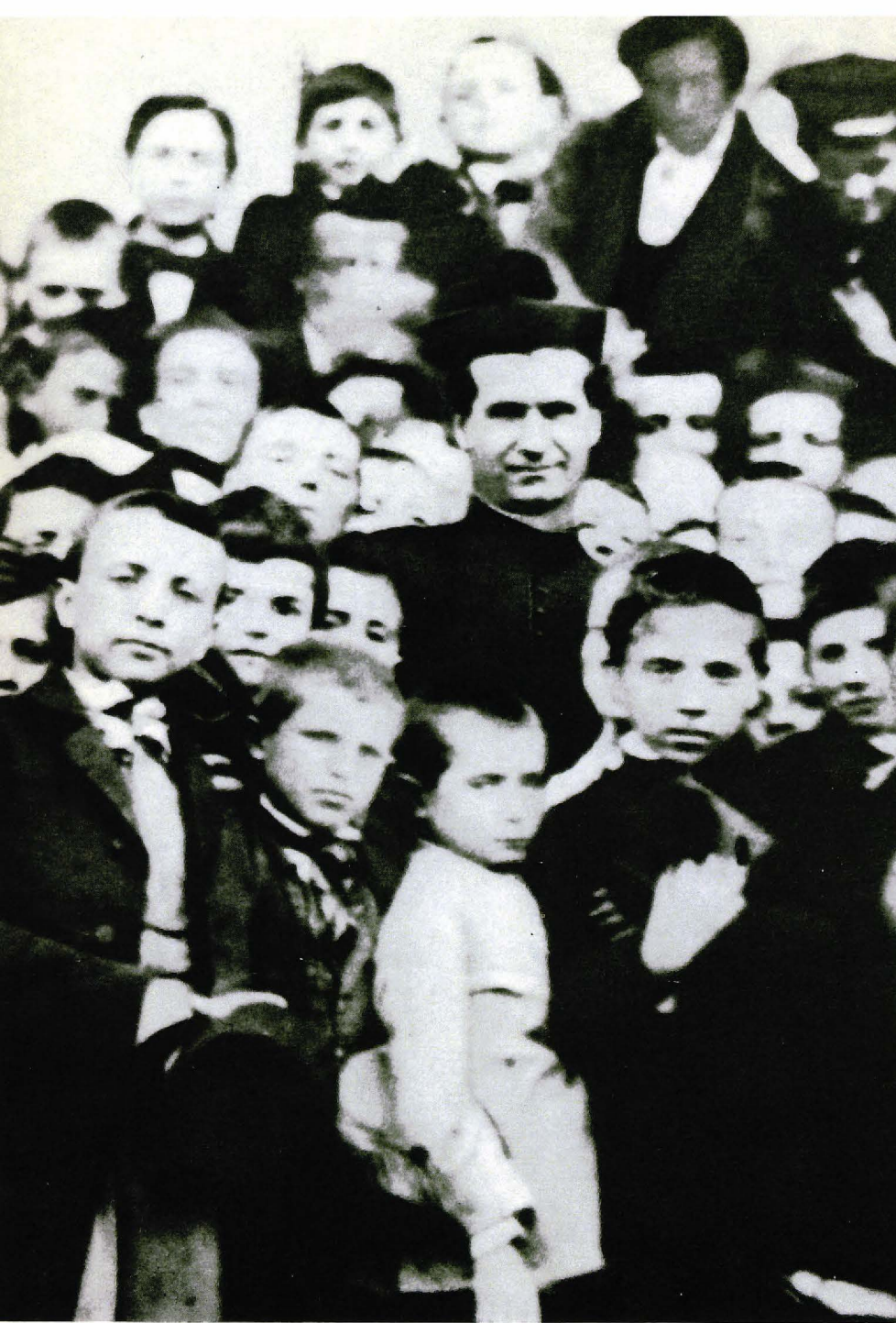
▲ Don Bosco enmig dels seus joves (1861).