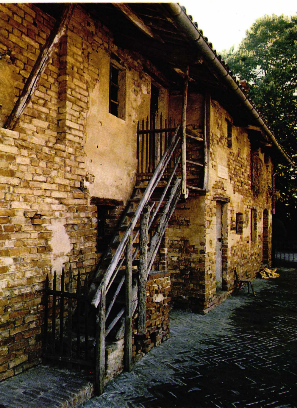
▲ Casa de Don Bosco a I Becchi.