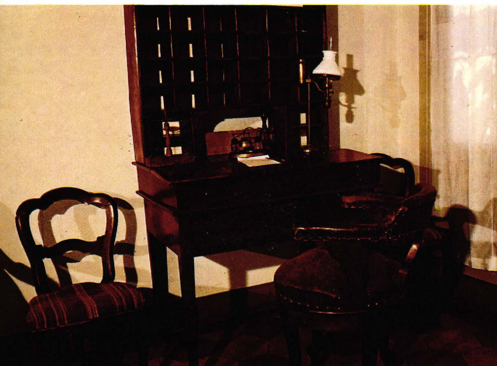
▼ Escriptori de Don Bosco.