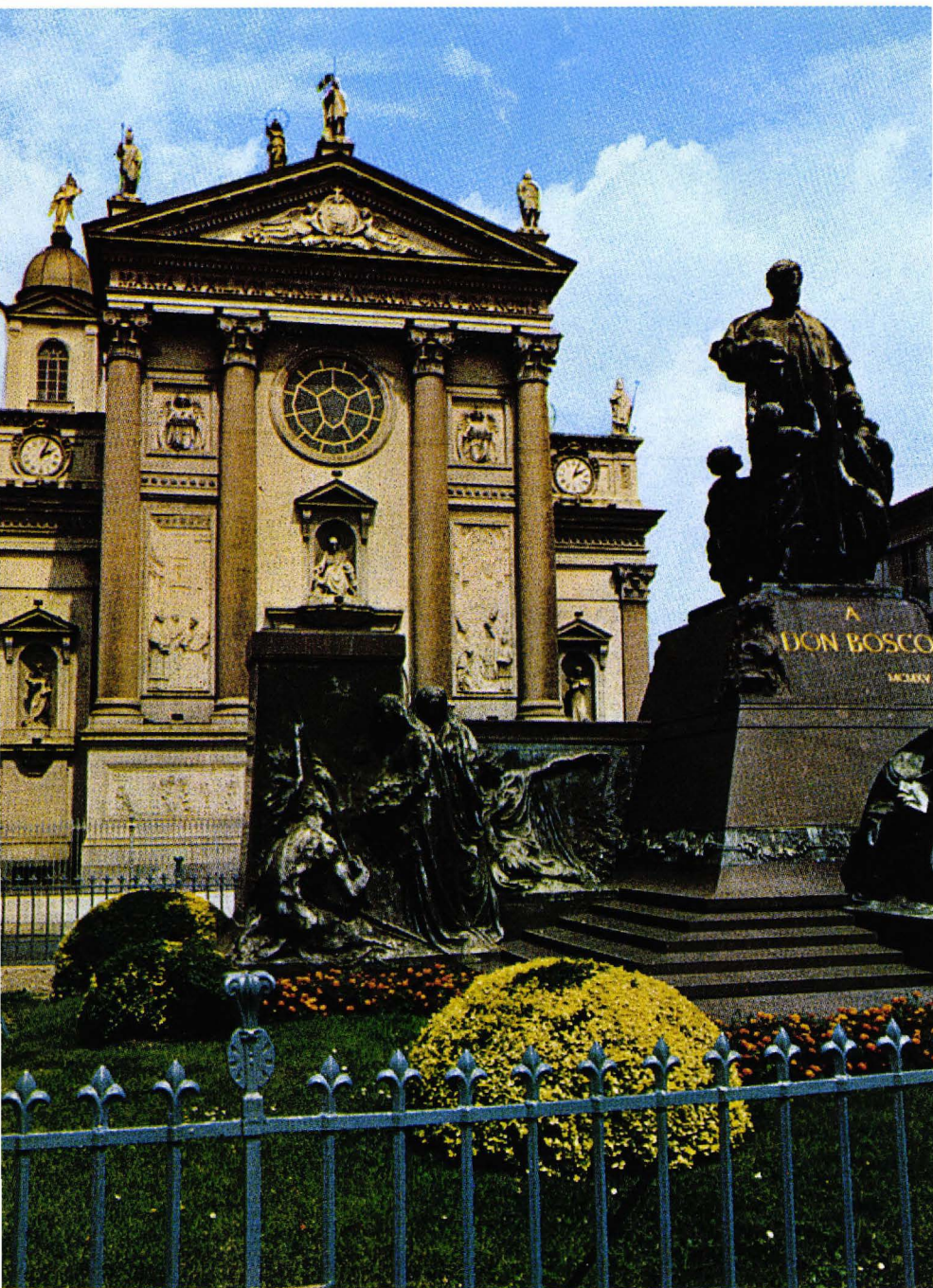
▲ La Basílica de María Auxiliadora.