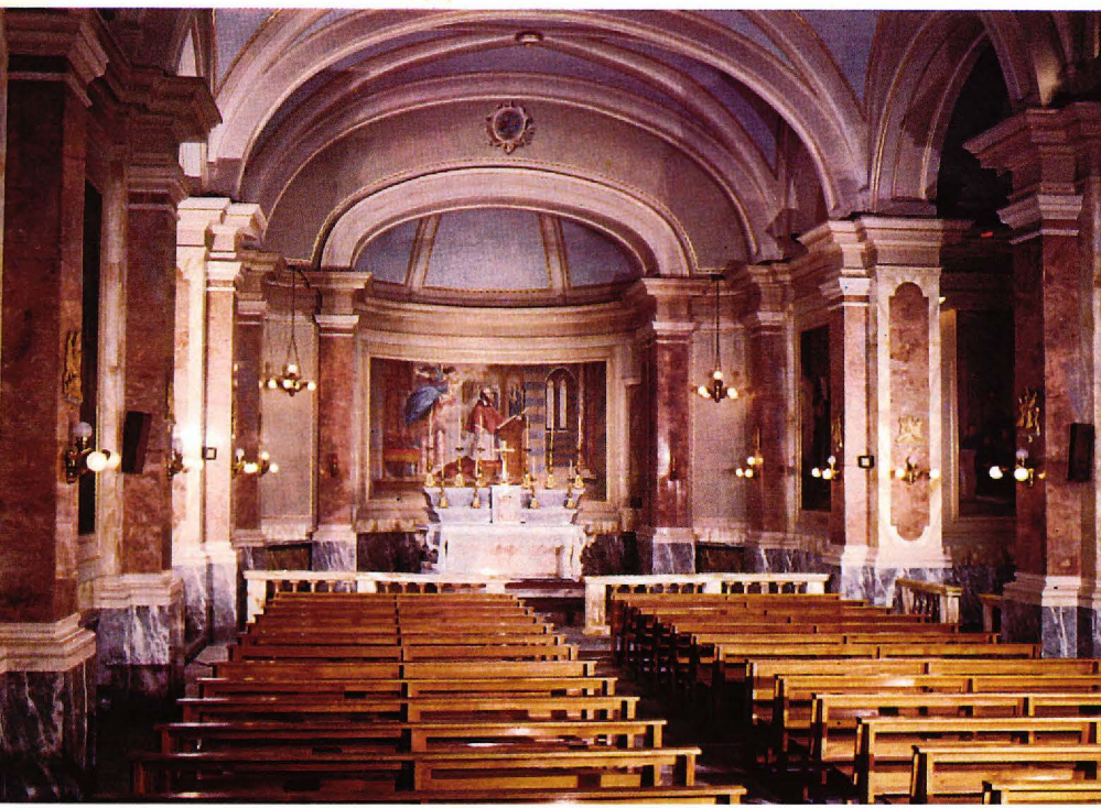
▼ Església de Sant Francesc de Sales. (interior).