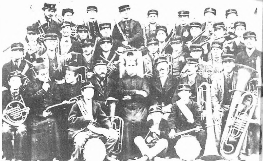
▲ Don Bosko Oratoryonun Badosuyla.