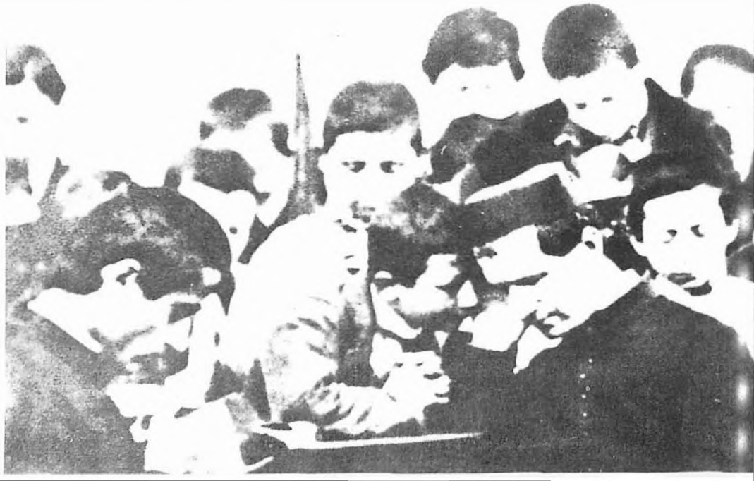
▼ Don Bosco Paolo Albera'ya Günah Çıkarttırıyor. O Sonra İkinci Başkan Olacaktır (1861).