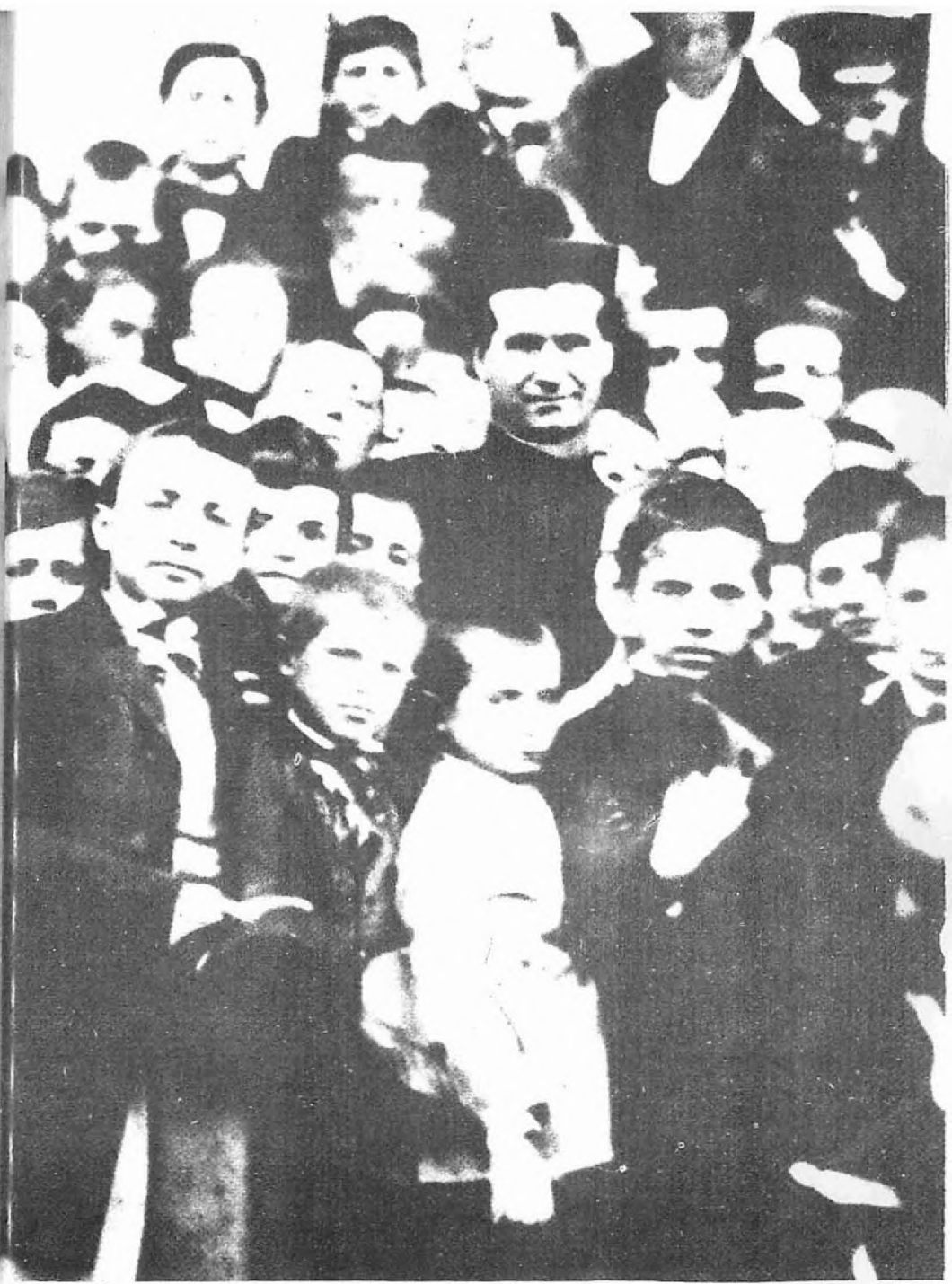
▲ Don Bosko Çocukları İle Birlikte (1861).