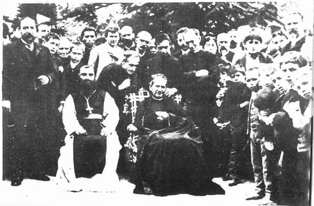
▼ Don Bosko İspanya - Barselona (1886).