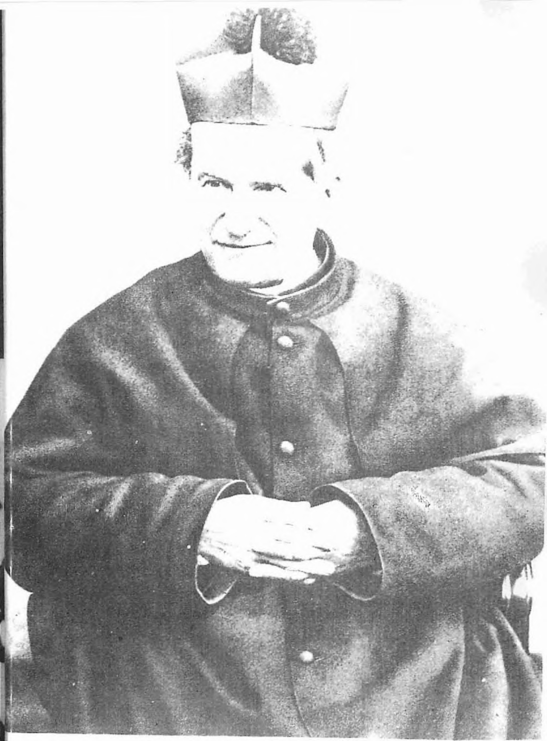
▲ Ölümünden Bir Kaç Ay Önce (1887).