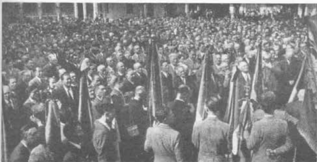
In cortile, durante il discorso del Presidente Internazionale.

Dalla basilica gli Ex-allievi, al suono della banda, sfociarono nel cortile, ove il Presidente Internazionale tenne il discorso ufficiale rin-