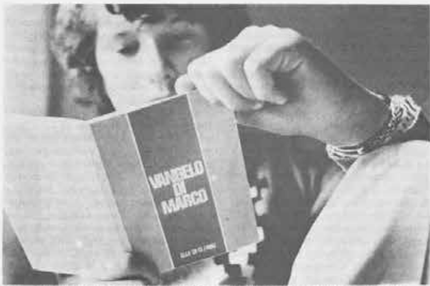
Molti giovani trovano nello studio della Bibbia e nella liturgia, la loro maturazione alla fede.

d) Nella definizione di fede di 26 ragazzi su cento entra esplicito (an-