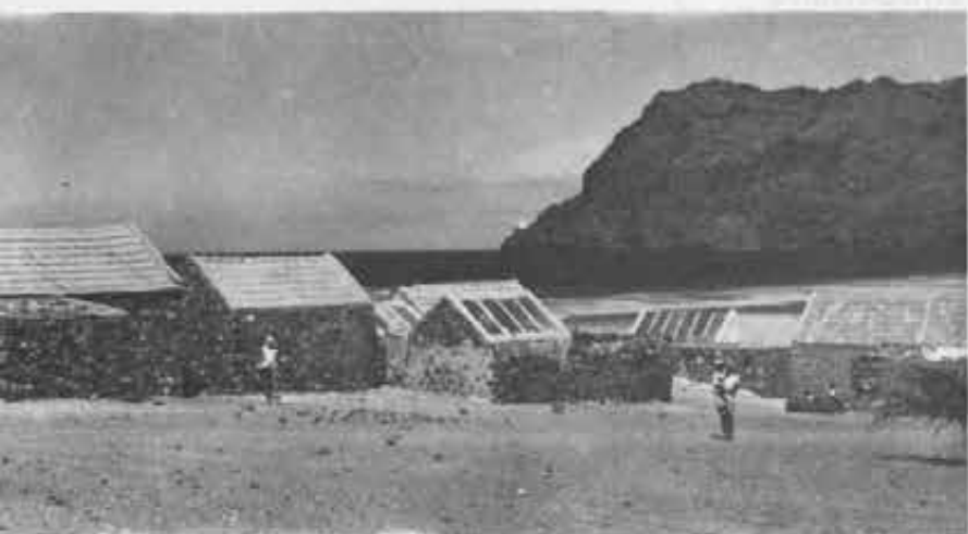
Cabo Verde: un villaggio in riva al mare. Da una decina d'anni non piove.

impegnate per una risposta adeguata a questa società giovane e bisognosa».