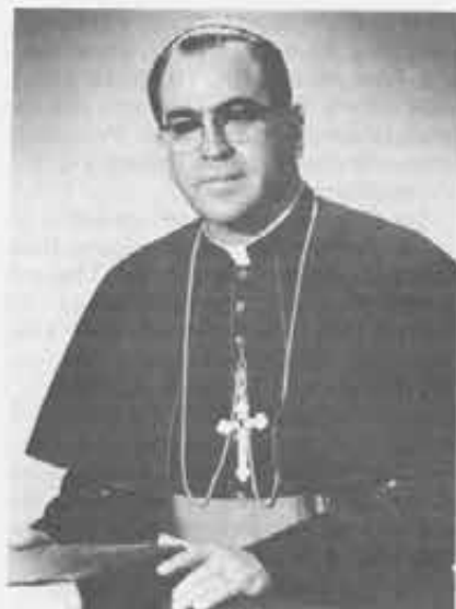
Mons. Arturo Rivera, amministratore apostolico di San Salvador, chiamato alla gravosa responsabilità di succedere mons. Romero.

menti così critici e decisivi» che il paese latino-americano attraversa.