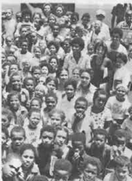
I ragazzi di São Vicente all'uscita dalla scuola salesiana.

Insomma l'impegno di tutti è — come spiega padre Maio — di «fare della parrocchia una comunità di comunità vive, dove non ci siano soltanto dei servizi ben organizzati, ma si realizzi una comunione di persone