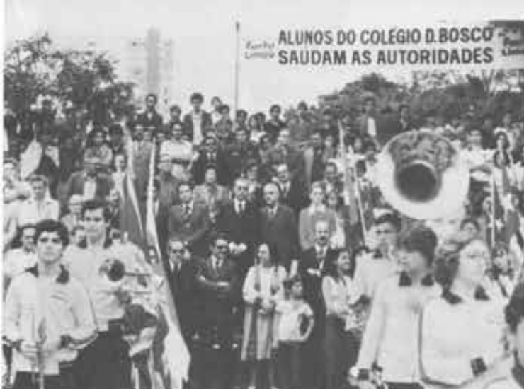
Gli exallievi sono arrivati a frotte, e si mescolano con gli allievi giovani, con la banda e la gente. Hanno tutti qualcosa in comune: l'affetto a Don Bosco.