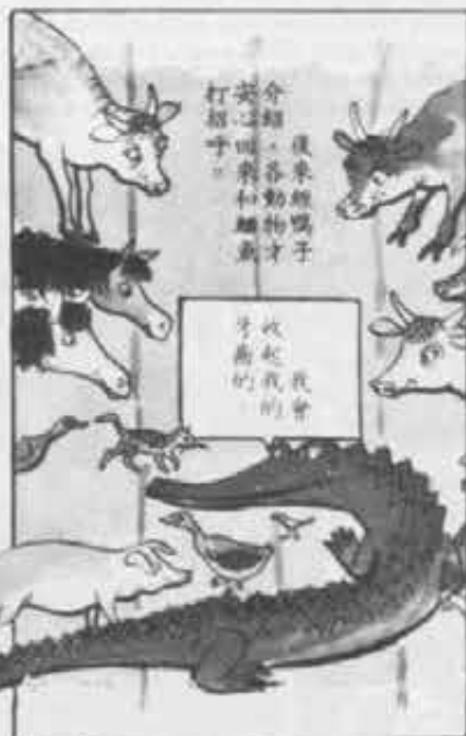
Un testo cinese per le elementari. Da cui risulta che nelle fiabe orientali gli animali parlano cinese. Lo sapeva Esopo?