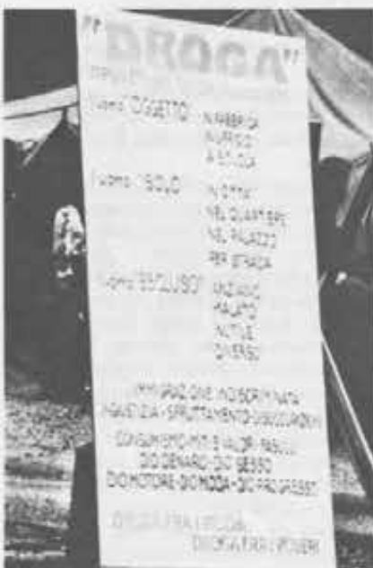
Manifestazioni contro la droga. Molti giovani trovano l'approdo alla fede nell'impegno sociale e politico a favore dei loro fratelli.

Le risposte a questa ulteriore domanda di approfondimento sul tema della fede, sono risultate di due generi opposti. Un primo blocco di motivazioni comprende bisogni di tipo difensivo , passivo, rassicurante. Su questa posizione si collocano 45 giovani su cento. Essi vedono nella fede l'aiuto a recuperare sicurezza personale e una propria identità. Sono ragazzi profondamente delusi dalla società che secondo loro non soddisfa, che annienta il senso della persona, che nega la loro identità. Scrivono: «I giovani sono spinti ad avere una fede in seguito all'urto con una realtà che non li soddisfa». «La sfiducia della vita e il desiderio di continuare spingono ad aggrapparsi alla fede»; «Bisogna aggrapparsi a un appiglio, per