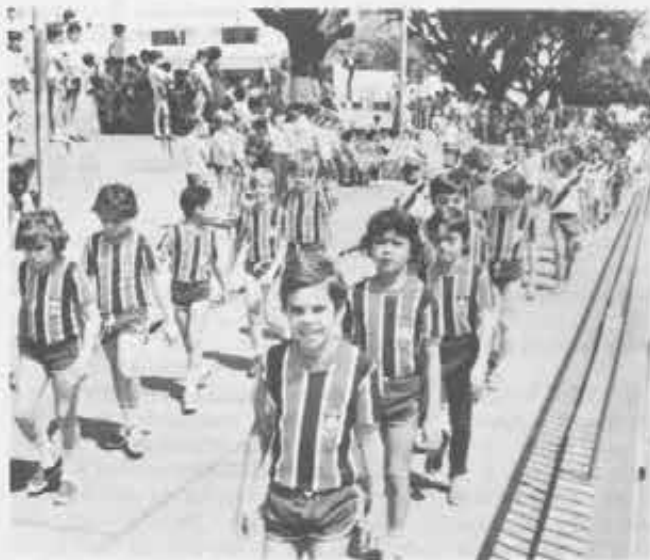
I ragazzini festeggiano a modo loro il cinquantenario del loro collegio: con le mini-olimpiadi. E lì in mezzo c'è forse un Palé.

La parola torcida equivale al nostro «tifo sportivo», e la festa consiste nel «fare tifo per Dio». E' l'invenzione di un salesiano pieno di fantasia; è stata celebrata per la prima volta a Goiânia. Era il Corpus Domini, e anche lì le autorità avevano difficoltà ad autorizzare la processione, che bloccava il traffico. Quel salesiano si è detto: «Non si può per le strade? Allora tutti nello stadio a fare tifo per Dio». L'iniziativa — chiaro esempio di come una festa religiosa può rinnovarsi col mutamento dei tempi — si sta diffondendo altrove, è approdata anche a Campo Grande. Centinaia di giovani con costumi dai colori più vivi, le splendide coreografie, tutta la gente sugli spalti, e migliaia di fiaccole per illuminare la messa al campo. ■