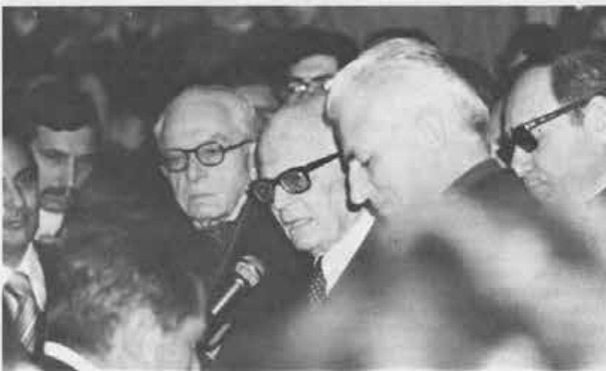
25 aprile 1980: Il Presidente Pertini parla nella «sala verde». A destra don Angelo Viganò, a sinistra il sen. Valiani. Sopra il titolo, il collegio (dal porticato si accede alla «sala verde»).

Altre riunioni si svolgono nella sala verde. Tra il 16 e il 19 aprile il Clnai accoglie la proposta di «far scattare l'insurrezione dall'occupazione ope-