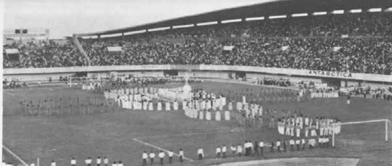
Campo Grande. Allievi e non allievi, ragazzi e ragazze, e si capisce anche gli adulti, tutti allo stadio per la «Torcida de Deus»: il tifo per Dio.

BRASILE ★ CON I DIECIMILA ALLIEVI DI CAMPO GRANDE