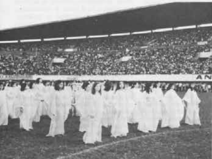
Altra panoramica sulle suggestive coreografie dello stadio: la festa delle scuole salesiane è in primo luogo una festa di gioventù.