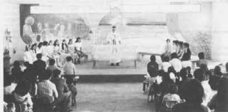
Messa al Barrio Norte di Trefew (Argentina), dove i Giovani Cooperatori Italiani animano l'oratorio e alcune opere sociali.