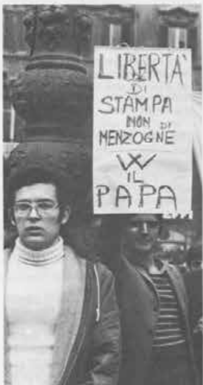
Roma, 1976: una sciocca campagna contro il Papa era in corso sui giornali, e i Giovani Cooperatori come per un invito di Don Bosco sono scesi a manifestare in piazza.

Morendo nel 1888, Don Bosco lasciava sul tavolo una lettera «da spedirsi dopo la mia morte». Era rivolta ai Cooperatori, diceva: «Se avete aiutato me con tanta bontà e perseveranza, ora vi prego che continuate. Le opere che col vostro appoggio io ho cominciate non hanno più bisogno di me, ma continuano ad avere bisogno di voi... A tutti pertanto io le affido e le raccomando». Queste parole non sono cadute nel vuoto. Sotto i