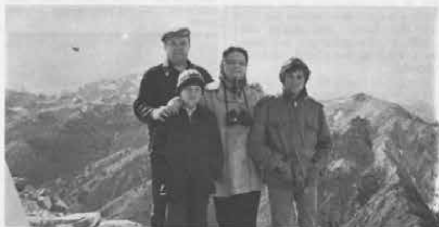
Virginia con il marito e due dei figli più piccoli: alle loro spalle le Ande.

Dire che il funerale fu un trionfo è espressione abusata e logora. Quel 19