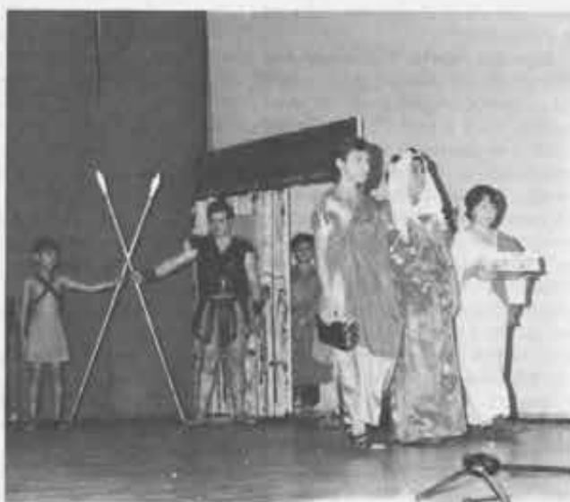
E si gareggia anche per il concorso biblico: alcuni alunni stanno sceneggiando con tutta serietà la storia di Giuseppe in Egitto.