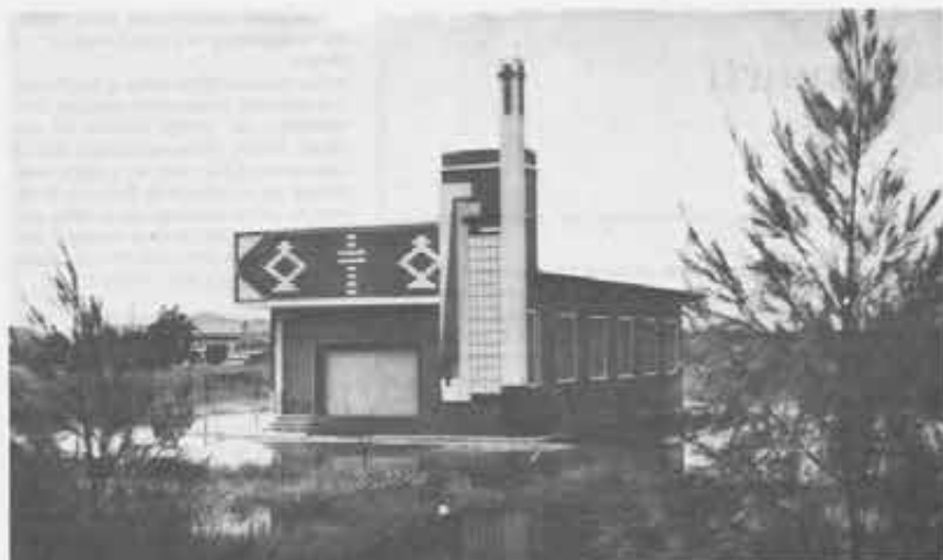
Ratburi (Thailandia). La bella chiesa che i cristiani hanno dedicato a san Giovanni Bosco.