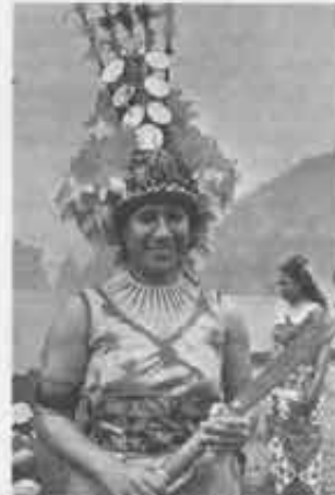
Donna samoana pronta per la «danza del coltello».

Recentemente è arrivato un barcone con quasi cento fuggiaschi vietnamiti, tutti pescatori, che hanno raccontato un