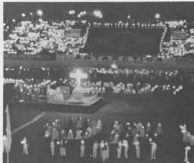
E' scesa la notte, nello stadio si sono accese le fiaccole, al centro la grande Croce e l'altare, e l'Eucarestia per dire grazie al Signore.