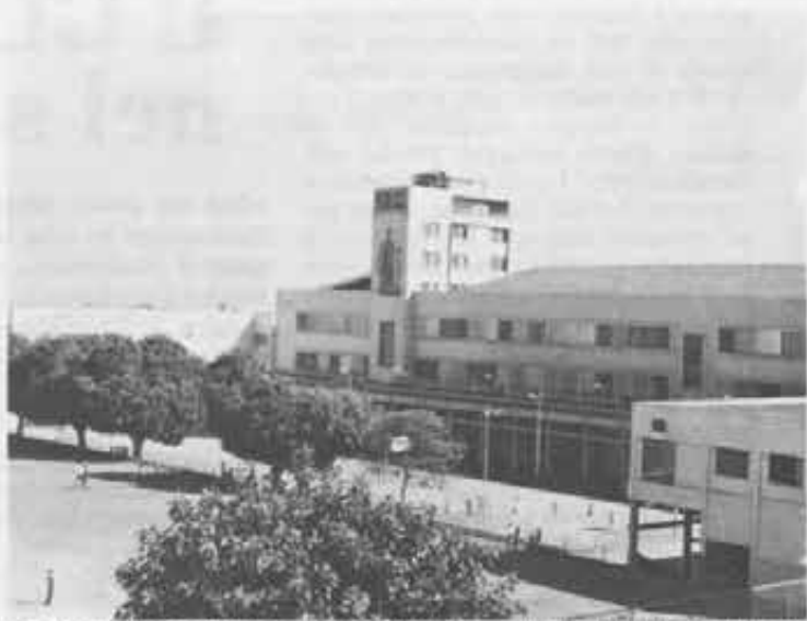
Uno degli edifici scolastici del collegio Don Bosco: gli allievi in tutto sono 10.200, e frequentano a turni senza sosta il mattino, pomeriggio e sera.