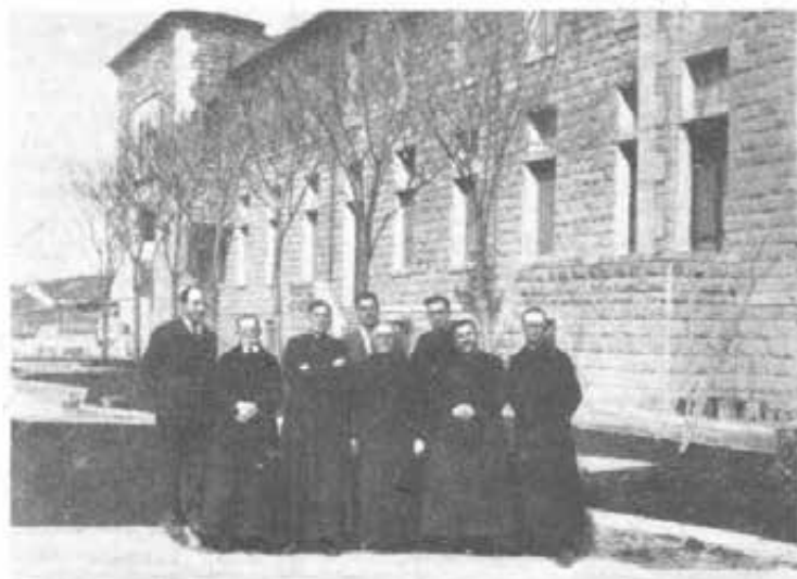
SIRIA - Aleppo - La Scuola Salesiana "Giorgio Salem".

Da noi il problema delle Colonie è in programma fin dalla fondazione dei nostri istituti in posizioni climatiche, ove si tengono abitualmente aperte le porte anche nel periodo delle vacanze. La prima guerra mondiale, con la vulnerazione e la denutrizione di tanti teneri organismi, impose una forte intensificazione di questa forma di apostolato; la seconda non fece che accrescerne l'urgenza e lo sviluppo. Diciamo forma di apostolato, perchè noi non ci limitiamo alle cure igieniche, terapeutiche e ricostituenti, ma completiamo