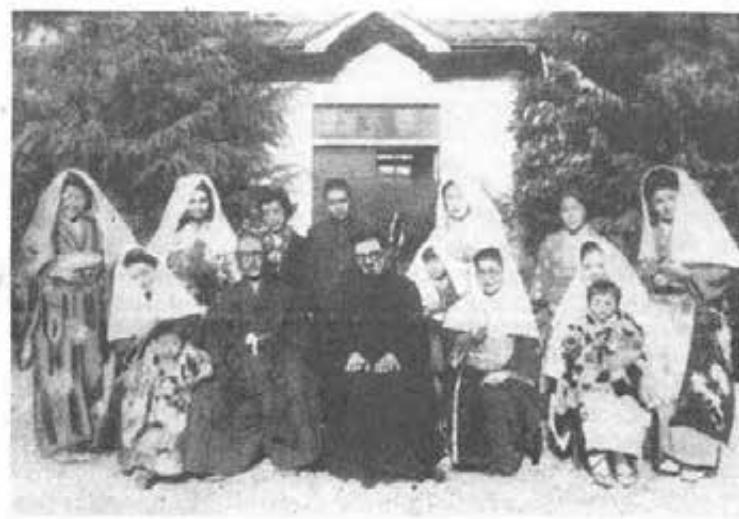
GIAPPONE - Un ex allievo battezzato con tutta la famiglia.

— Con sacrifici non lievi, abbiamo acquistato del materiale tipografico e allestito alla meglio una tipografia in un vecchio magazzino. Le due pedaline non stan mai ferme! Oltre ai due periodici mensili in portoghese e in inglese soprattutto per i nostri amici e cooperatori, ci siamo avventurati a pubbli-