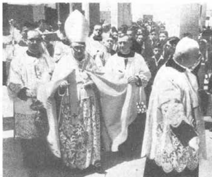
PERÙ - S. Em. il Card. Guevara benedice le fondamenta del tempio di S. Giovanni Bosco al Callao.

S. Eminenza il Cardinale Guevara, Arcivescovo-Primate del Perù, ha coronato i solenni festeggiamenti svoltisi nel mese di dicembre scorso per la celebrazione del Cinquantenario dell'opera salesiana nel porto del Callao con la benedizione e posa della prima pietra del tempio che verrà dedicato a S. Giovanni Bosco. Sarà il quinto tra i nostri più grandiosi: tre innalzati in onore di Maria Ausiliatrice, nelle città di Lima,