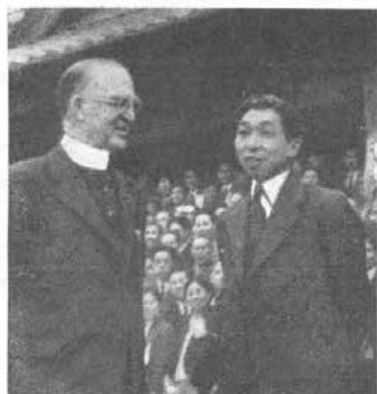
GIAPPONE - L'apostolo dei fanciulli il compianto Mons. Flanagan e il Principe Ta'vamaiva in visita al nostro Ospizio di Oyada Koen.

La Missione « ad paganos ». — Se la zona costiera è quasi interamente cristiana, l'interno della colonia purtroppo è ancor in massima