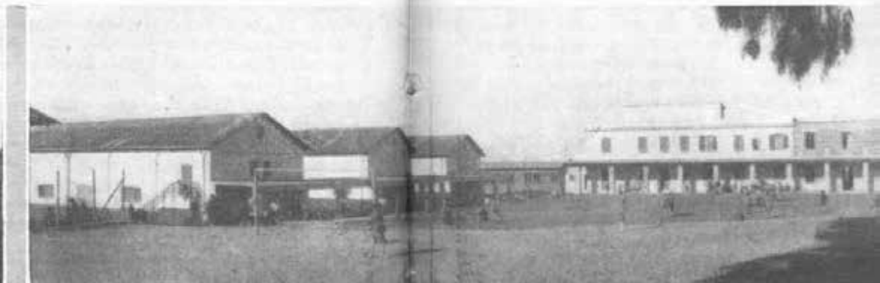
ROMA - Il Borgo "RAGAZZI DON BOSCO"; Panorama.