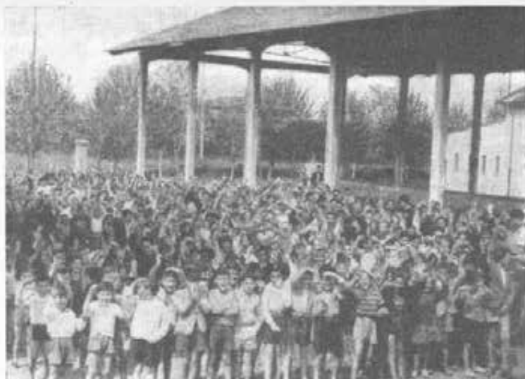
ROMA - Borgo "RAGAZZI DON BOSCO" Gli esterni si ammassano davanti all'obiettivo.

Ragazzi di Don Bosco in Roma, imitato ...l'apostolato dei nostri confratelli ...«Ragazzi» collocati al lavoro, ...nei vari paesi donde erano stati ...dalla speculazione di sfruttatori, ...curate 2163; accolti gratuitamente ...buone famiglie private, 48; salvati ...Estrive, 21.160; assistiti quoti- ...circa 3000; curati presso vari ...con disinfezione o disin- ...tutte le umiliazioni, le pri- ...i nostri confratelli sacerdoti, chierici ...santa in piena guerra, con poca ...al termine delle ostilità. Ma