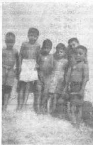
KRISHNAGAR Come arrivano i bimbi al collegio.

In poche scene S. E. Ragia- gopalaciari ammirò come i no- stri allievi vengono attrezzati nell'uso delle diverse macchine, nei vari reparti di saldatura, meccanica, falegnameria, sar- toria, nonché nell'agricoltura; rivede le allieve del collegio femminile « La Sacra Fami-