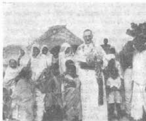
KRISHNAGAR - Il Vescovo accolto a festa nel villaggio di Chandra.

Il 15 agosto 1947, quando l'India acquistò la sua indipendenza, l'immensa regione si è divisa in due paesi diversi: India e Pakistan. Il nuovo stato di Pakistan è formato da due territori separati: uno «West Pakistan» al Nord India; l'altro «East Pakistan» nel Bengala a circa 1500 km. dal West Pakistan.