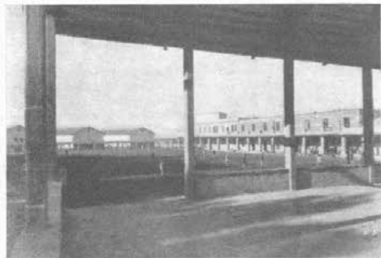
ROMA - Borgo "RAGAZZI DON BOSCO": il cortile principale.