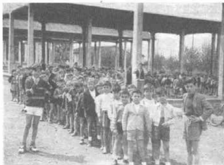
ROMA - Borgo "RAGAZZI DON BOSCO" Pronti per la passeggiata.