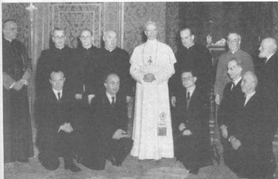
Roma - Il Santo Padre fra i Salesiani addetti alla Tipografia Poliglotta Vaticana.