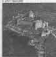
Illustrazione di G. Cadeddi

Ogni racconto è seguito da una pagina di suggerimenti per un lavoro individuale e di gruppo, intitolata «Proposte di attività e ricerca» e una «Scheda di approfondimento», che sviluppa un aspetto interessante dell'episodio narrato. Il libro si conclude con una scheda bibliografica contenente preziose indicazioni per una lettura amena.