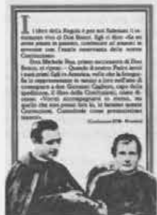
Nella foto: il testo del Proemio alle Costituzioni su cartolina.

L a festa di San Giovanni Bosco 1985 è stata per molte comunità salesiane l'occasione per ricevere, con semplici e suggestive cerimonie, le Costituzioni della Società di San Francesco di Sales recentemente approvate dal Capitolo Generale della Congregazione e dalla Santa Sede dopo non poche discussioni. Lo stesso Rettor Maggiore ha presieduto alcune di queste cerimonie e dove non ha potuto andare è stato sostituito dal suo Vicario don Gaetano Scrivo o da qualche altro membro del Consiglio generale. Raccolta in un elegante volumetto in carta india la «regola di vita» dei Figli di Don Bosco è suddivisa in 196 articoli costituzionali e in 202 articoli regolamentari. In appendice vengono riportati alcuni scritti di San Giovanni Bosco ritenuti fondamentali per la stessa identità salesiana. L'interesse per questa «regola di vita» salesiana è stato notevole anche al di fuori della stessa Congregazione. A molte «cerimonie di consegna» la partecipazione è stata aperta a tutti. A Roma, Cinecittà, ad esempio, essa è avvenuta