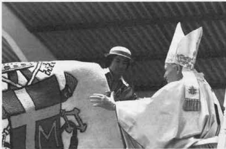
Le immagini di questo articolo si riferiscono al recente viaggio di Giovanni Paolo II in America Latina

— alla tentazione anticristiana dei violenti, che non credono nel dialogo e nella riconciliazione, e che sostituiscono le soluzioni politiche con il potere delle armi o dell'op-