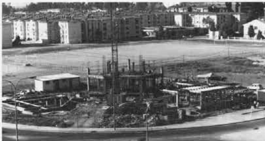
Nel cuore del quartiere sivilgiano sta sorgendo il futuro centro parrocchiale

«Noi salesiani abitiamo in un edificio rosso».