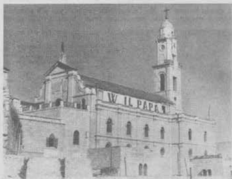
La chiesa dei Salesiani a Betlemme

È inimmaginabile la gioia dei Salesiani e delle Figlie di Maria Ausiliatrice al conoscere i termini di quel colloquio breve, ma tanto significativo. Il Papa ha pensato a noi, prima ancora che ci presentassimo! Il Papa conosce e apprezza il nostro lavoro!... Questa loro gioia è gioia di tutta la nostra Famiglia, perchè tutti abbraccia la benevolenza paterna e la benedizione del Vicario di Cristo.