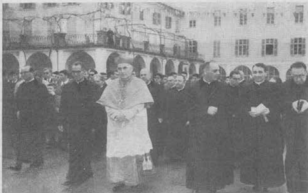
Borgo San Martino (Alessandria) - Sua Eminenza il cardinale Raul Silva, Salesiano, Arcivescovo di Santiago (Cile), ha voluto rivivere e far rivivere le visite che il primo Cardinale Salesiano Giovanni Cagliero ogniqualvolta tornava dall'America, faceva al primo Collegio fondato da Don Bosco fuori Torino