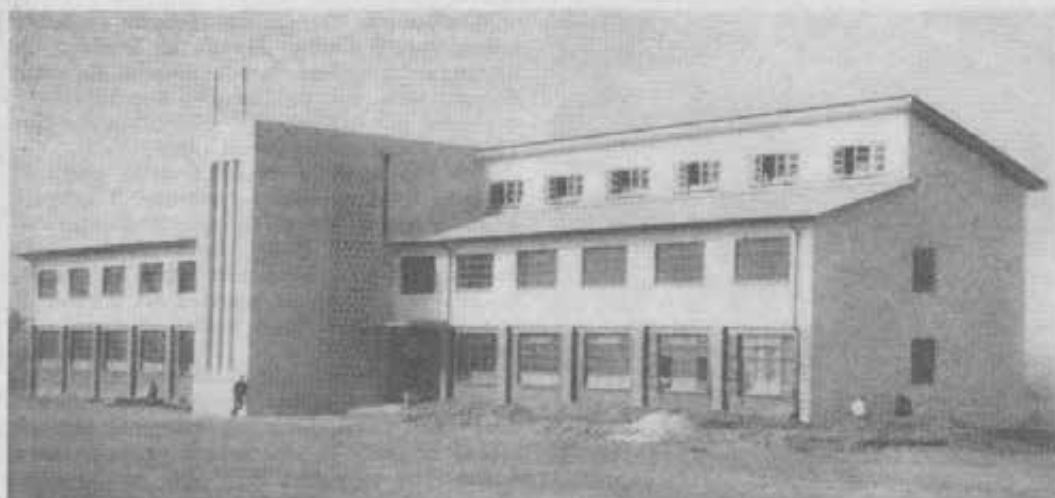
A Seoul (Corea) i Salesiani hanno aperto una seconda casa, che da quest'anno accoglie i novizi coreani