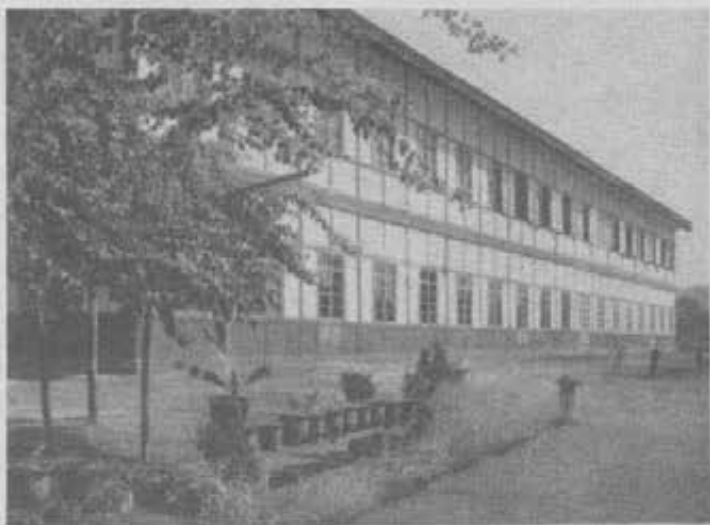
L'Aspirantato di Anisakan, la sede delle speranze salesiane in Birmania

In 25 anni di lavoro in Birmania i Salesiani non hanno ancora ottenuto i risultati che ottennero altrove. Le ragioni sono palesi. Una lunga e disastrosa guerra fu combattuta nella