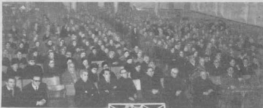
Torino - I Cooperatori raccolti nel teatro di Valdocco per l'incontro col Successore di Don Bosco che vuole precedere la prima Conferenza annuale.

« Viaggi ai paesi dell'anima » si intitola questa trasmissione, e questa volta come meta è stata scelta la regione di Valdocco, centro e cuore motore di tutta l'opera salesiana. Tutta la trasmissione fu allietata da musiche, canti di ragazzi, suono di campane, tutto registrato nella Basilica di Maria Ausiliatrice. Don Bosco, il suo spirito, il suo cuore di padre sono stati rievocati, nell'anniversario della morte, con parole commosse e sugge-