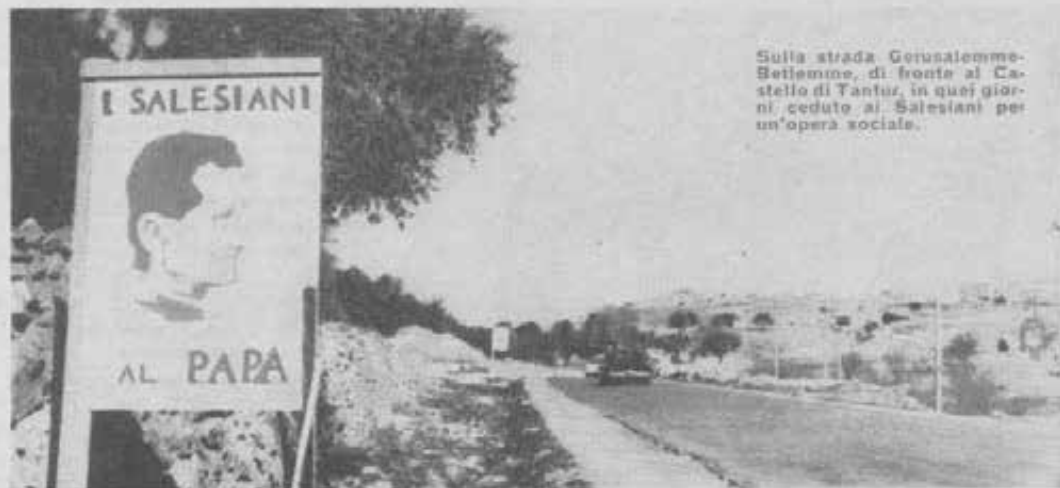
Sulla strada Gerusalemme-Betlemme, di fronte al Castello di Tautur, in quei giorni, ceduto ai Salesiani per un'opera sociale.

Ma l'onore della preparazione più prossima alla venuta del Santo Padre fu dei nostri