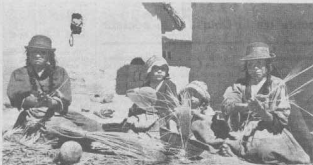
Puno (Perù) - Una delle tribù Inca, che vivono a oltre 3000 metri intorno al lago Titicaca. I Salesiani lavorano per la formazione della gioventù e l'elevazione del popolo.

compiere poi i loro doveri sociali. I giovani che vengono a quest'Istituto ricevono dal Governo una borsa per tutta la durata dei loro studi. Dopo i corsi-base, essi si specializzano come meccanici, elettricisti, falegnami, sarti, agricoltori. Tutti inoltre seguono anche corsi di musica vocale o strumentale.