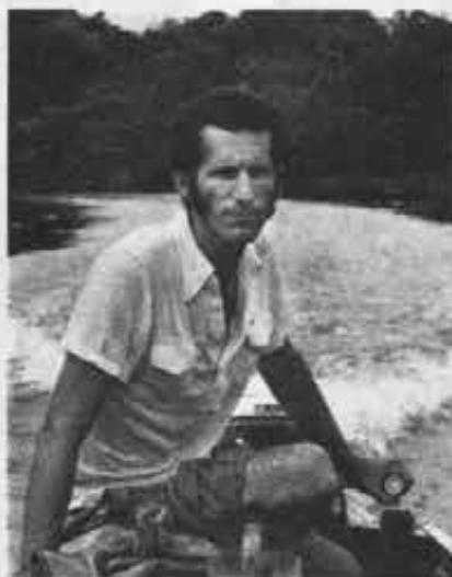
«Non portate né bisacce né sandali. Andate».