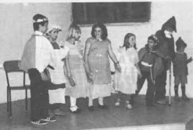
A Fontanazzo: la recita del Club del Sassolungo ovvero 'cooperatori piccoli' in attività.