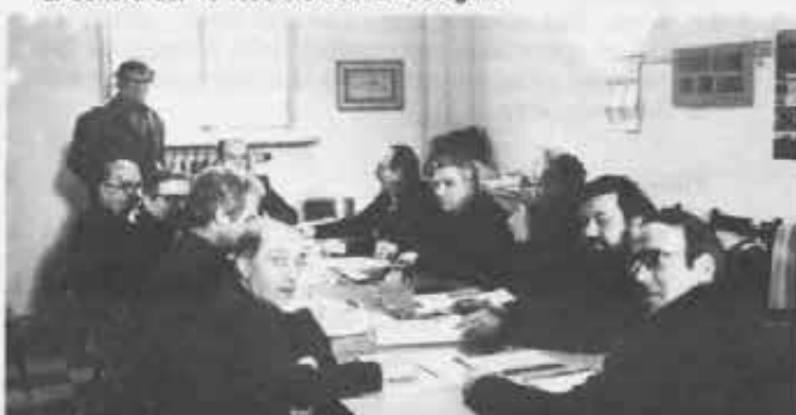
Guardateli i vostri Delegati! Foto storica a ricordo della Riunione di settore del 19 febbraio 1983 a Bologna.