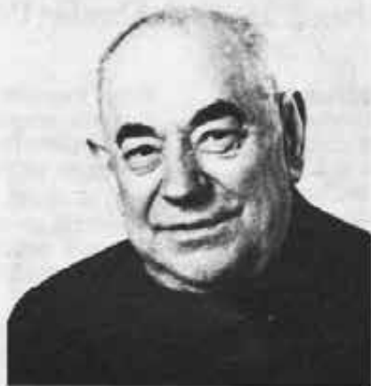
Don Guido Favini, fu Direttore del BS dal 1932 al 1950 e Segretario Generale dei Cooperatori Salesiani per 21 anni.

A lui l'Associazione deve moltissimo. Basti citare la sua opera «Il cammino di grande idea» che resta fondamentale per coloro che vogliono capire i Cooperatori. Dice don Raineri: «Quello che sperimentiamo tra i Cooperatori nel mondo è dovuto anche alle sofferenze di questo uomo, che sapeva ricercare nella "tradizione" e nella "memoria" quanto c'era di valido e sapeva riproporlo in modo adeguato alla situazione in cui viveva».