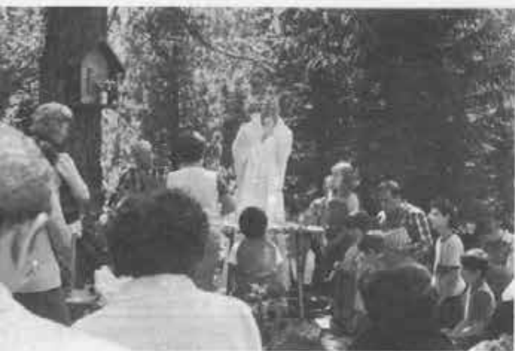
La celebrazione della messa all'aperto durante una delle giornate comunitarie sulle Dolomiti in valle San Nicolò.