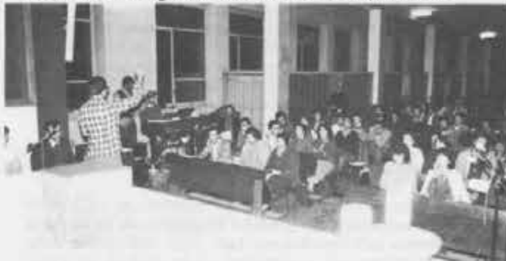
Scuola di preghiera a Torino-Valdocco.