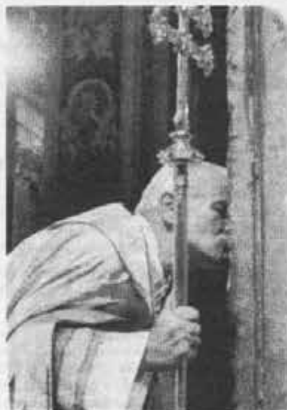
Giovanni Paolo II bacia il frontale della Porta Santa.

In tale anno la Chiesa solitamente chiama i fedeli a Roma dove le Tombe degli Apostoli Pietro e Paolo sono segni particolarmente eloquenti della fede portata nel mon-