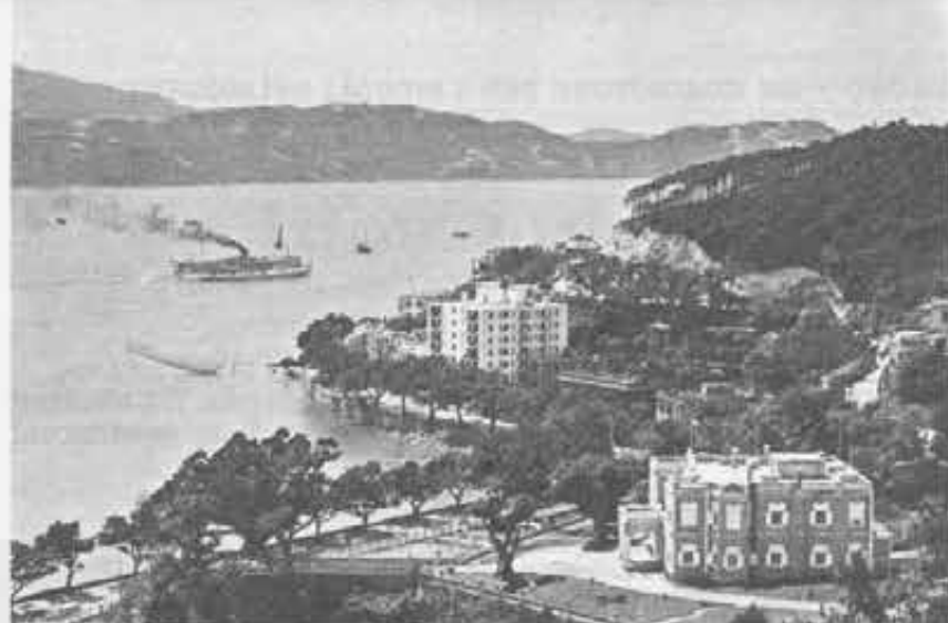
Ecco Macao, il suo mare e in primo piano la Casa del Governatore.

Del resto non hanno altro modo di avere denaro e la maggior parte