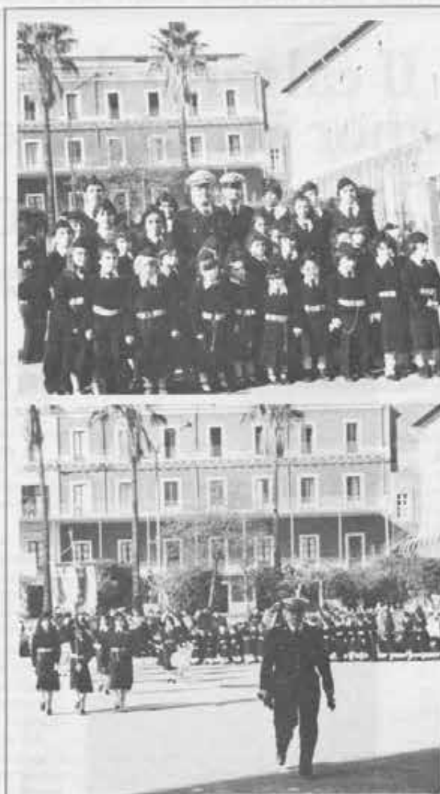
ITALIA, CATANIA. IL COMANDANTE E I MINIVIGILI

Fra i 55 corsi professionali che le Figlie di Maria Ausiliatrice gestiscono nella Regione lombarda, uno ha suscitato particolare interesse. Si tratta del corso che prepara «Tecnici per l'alimentazione» ed è frequentato da 32 ragazze presso la Scuola professionale delle suore di Cinisello Balsamo. Il corso —