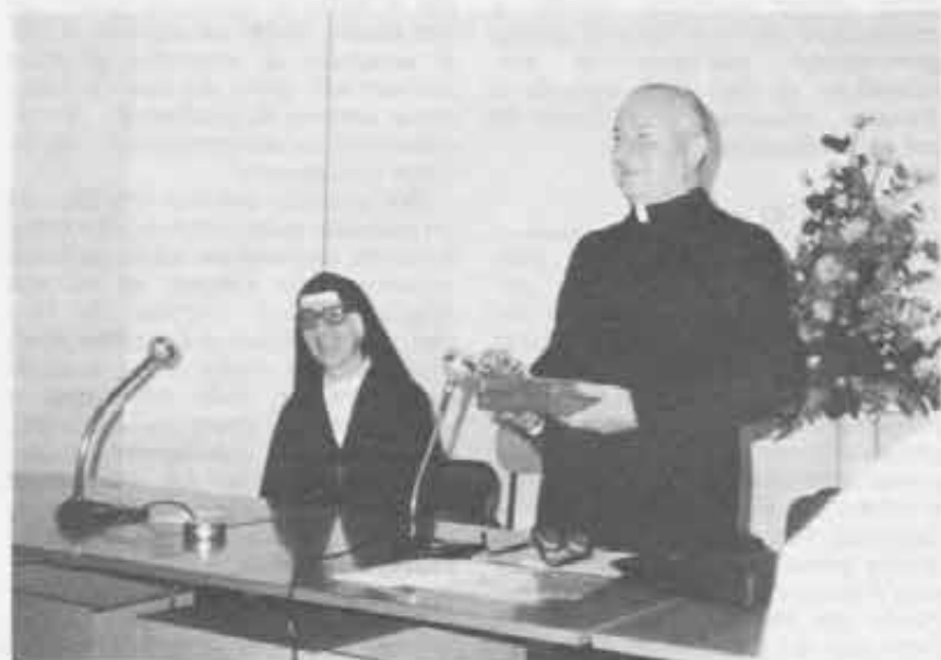
Tra la curiosità generale il Rettor Maggiore consegna alla neoletta Superiora Generale delle FMA una lettera autografa di Don Bosco.

Quasi alcuni secoli da di- stribuire alle vostre Figlie. Ritengono per voi la dolcezza dei profumi, sempre e con- tante; ma state sempre presenti a ricercare gli uomini nelli «mieghi» e «bambini» grandi e Dio primizie di vostro amore. Dio vi benedica e vi dia «vita» e «coraggio» da santificare con «tutte le comunità» in «vostri fratelli». pregate per me che vi sarò un S.C. Don Bosco 1877. 12. 12. 1877. San J. B. Bosco