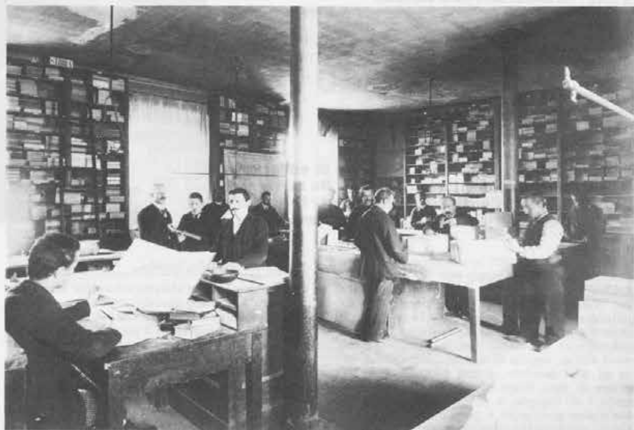
Una foto di fine Ottocento: è il laboratorio dei Legatori della scuola tipografica di Torino-Valdocco.

dire il fine principale della sua opera e della sua vita — che è la missione evangelizzatrice ed educatrice della gioventù e del popolo — «si deve però porre tra le finalità più grandi della sua attività apostolica» (Valentini, Don Bosco e L'Apostolato della Stampa , pag. 7-8; Torino, SEI, 1975).