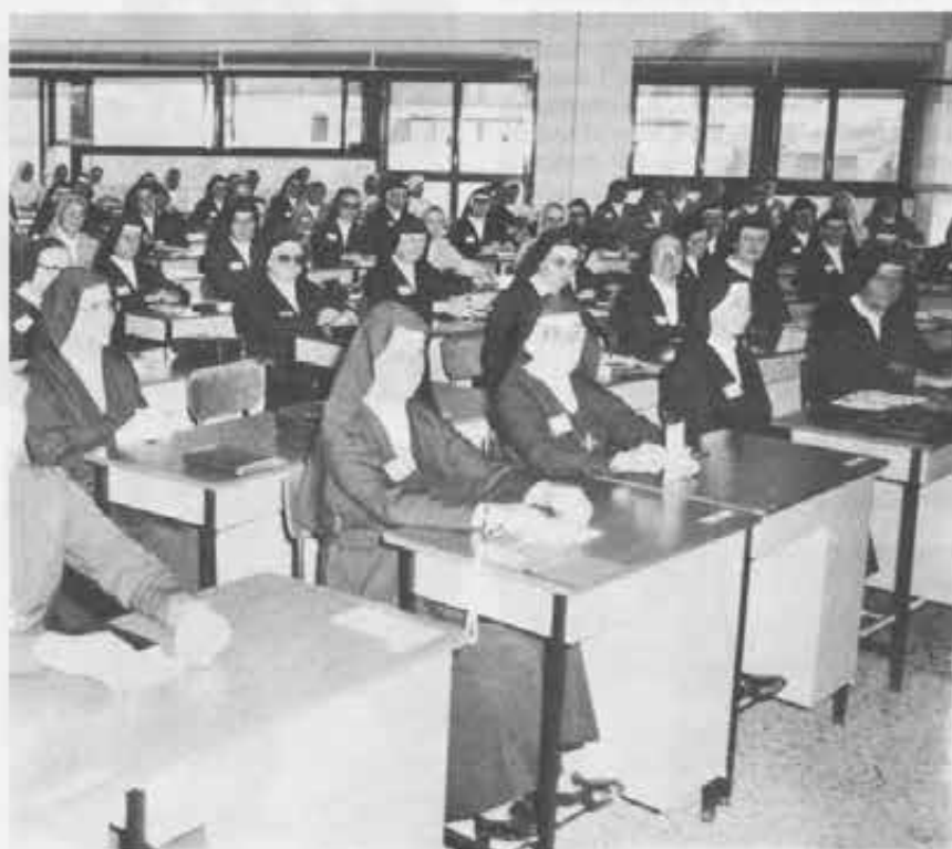
Ecco le Capitolari in una delle tante assemblee del XVII Capitolo FMA.

L'8 ottobre a Mornese è stato per tutte le capitolari una giornata di contemplazione e di pace. La Messa in parrocchia; la visita al piccolo cimitero; la passeggiata fino al Collegio, con lo sguardo attento per