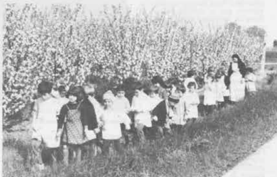
Bambine di uno dei tanti asili animati dalle Salesiane Oblate.