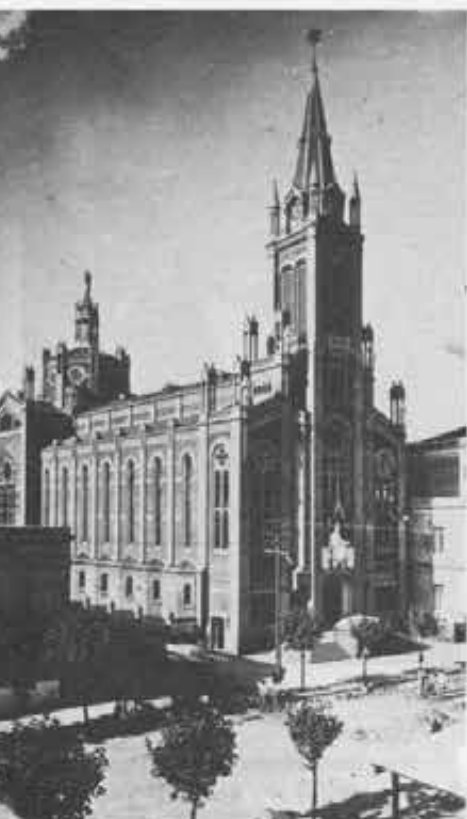
Il tempio di Maria Ausiliatrice e l'Istituto San Carlo di Buenos Aires.

Però i contrasti si acuiscono, aggravati dalle tensioni tra la S. Sede di Roma e il Governo a Buenos Aires (che aveva il diritto di «patronato», cioè di proporre una persona gradita) per la nomina del successore dell'Arcivescovo nella capitale. Le organizzazioni cattoliche sociali insistevano su mons.