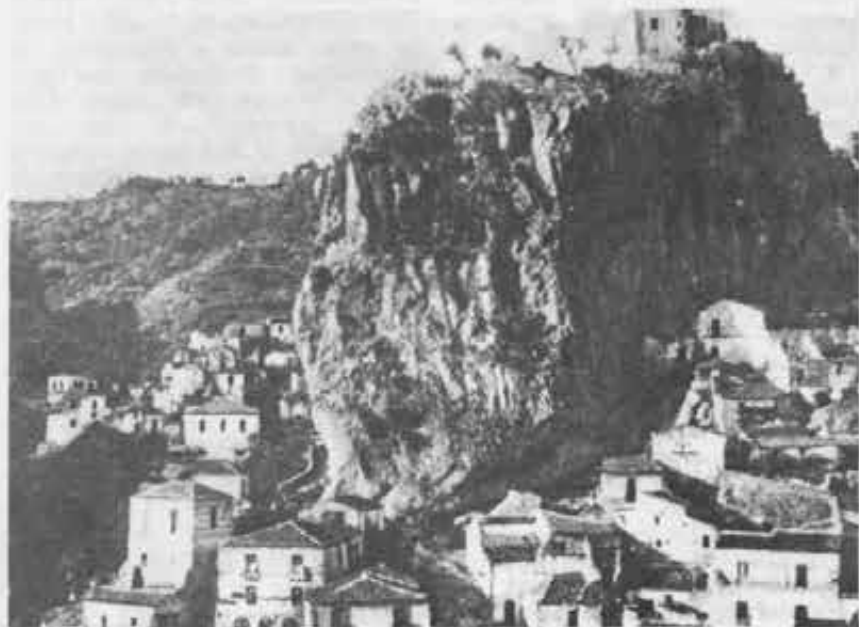
Paese montano della Diocesi di Bova.

Non trovando Istituti disposti ad adattarsi alla povera situazione di quei paesi, nell'ardente e creativo cuore apostolico di mons. Cognata balenò allora l'idea di fondare una nuova congregazione femminile.