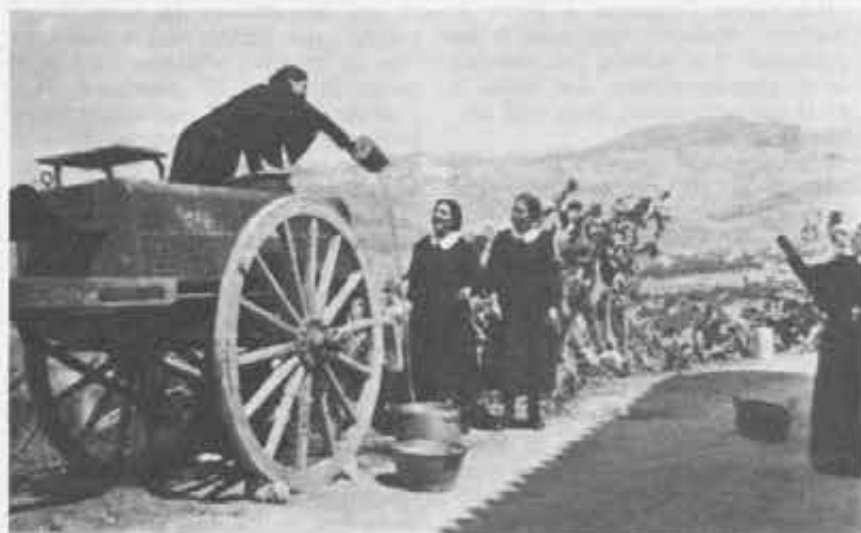
In molti paesi della Diocesi di Bova l'acqua giungeva così e di tanto in tanto: per le Oblate era una festa!