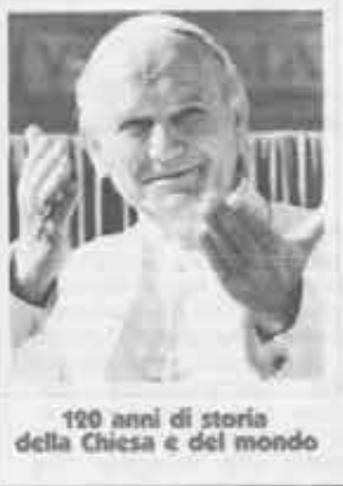
120 anni di storia della Chiesa e del mondo