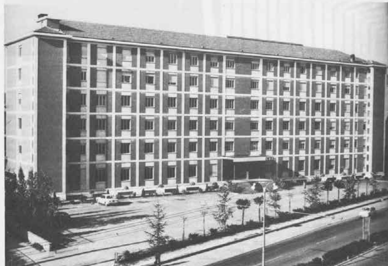
Fra le editrici salesiane fa spicco il lavoro della ElleDICI di Leumann (Torino). Questa è la sua sede centrale.