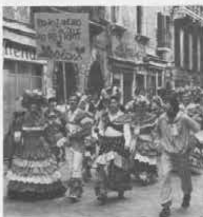
Le foto del servizio si riferiscono alla marcia «Su e zo per i ponti» edizione 1981.