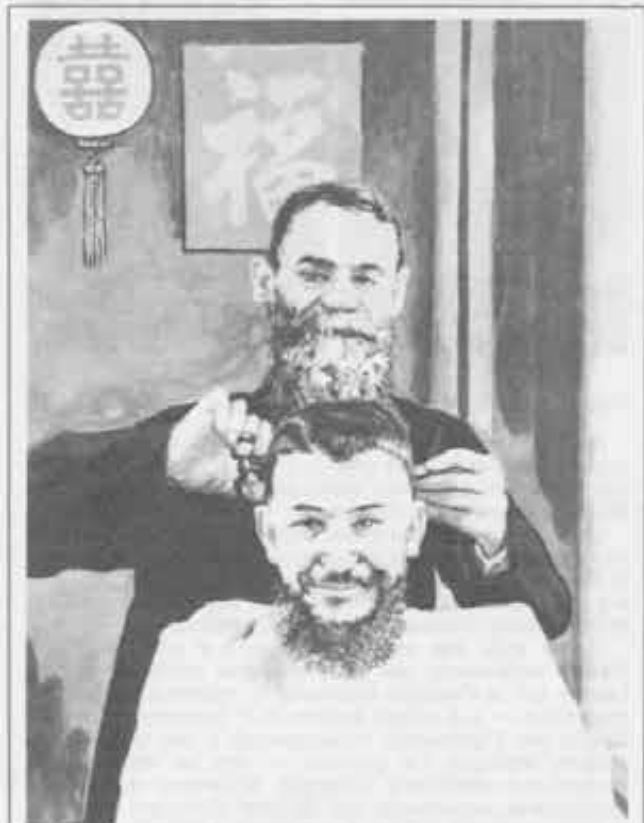
TAIWAN. Questo quadro è una copia fedele di una fotografia esistente in archivio inviataci dal lontano oriente. Raffigura il Servo di Dio mons. Versiglia che taglia i capelli all'ispettore don Braga, altro grande missionario salesiano. È un'immagine che ci riporta alla povertà e alla semplicità delle origini.